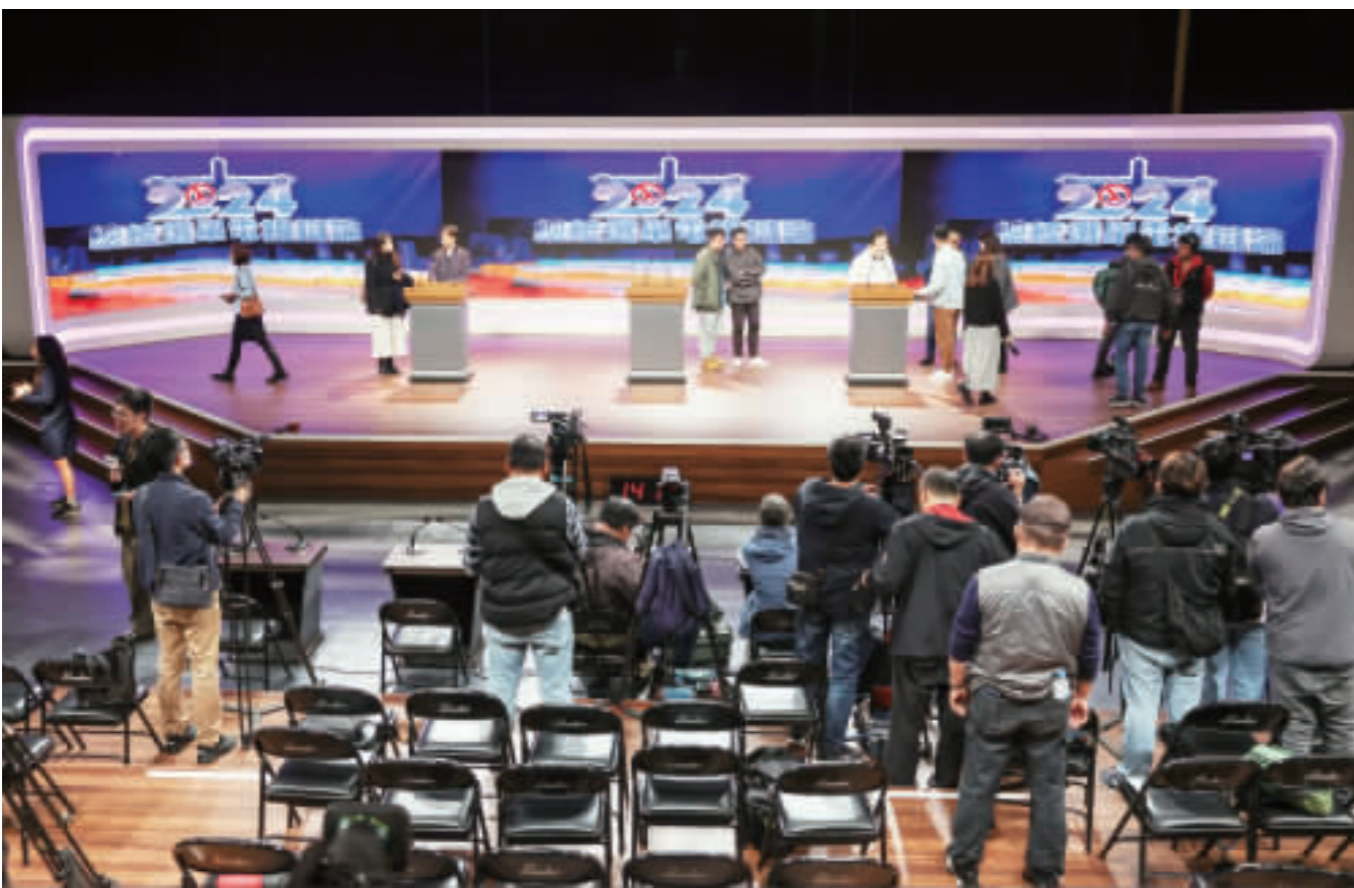
2024大選進入最後倒數，總統候選人電視辯論會30日將在公視舉行，29日下午3黨陣營代表抵達攝影棚場地，了解流程與動線。