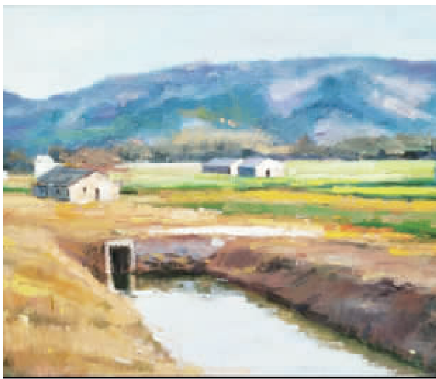
許玉音畫作一左、大武山下；右、黃昏的木麻黃。