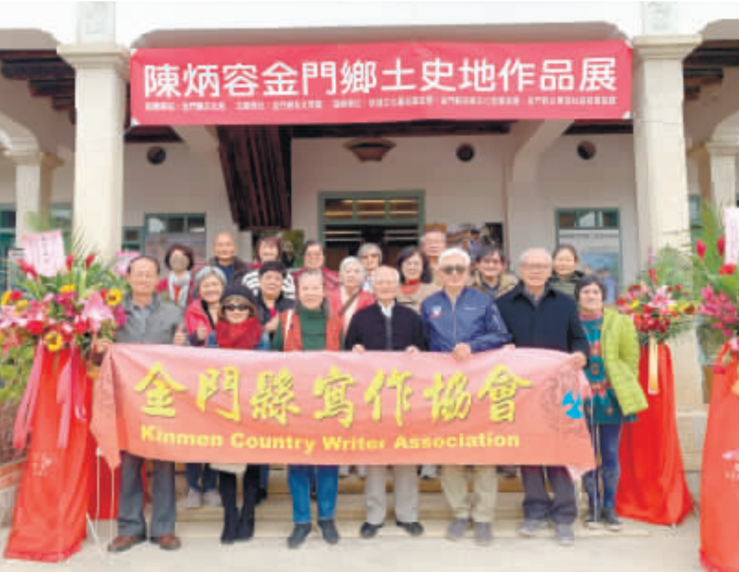
陳炳容金門鄉土史地作品展