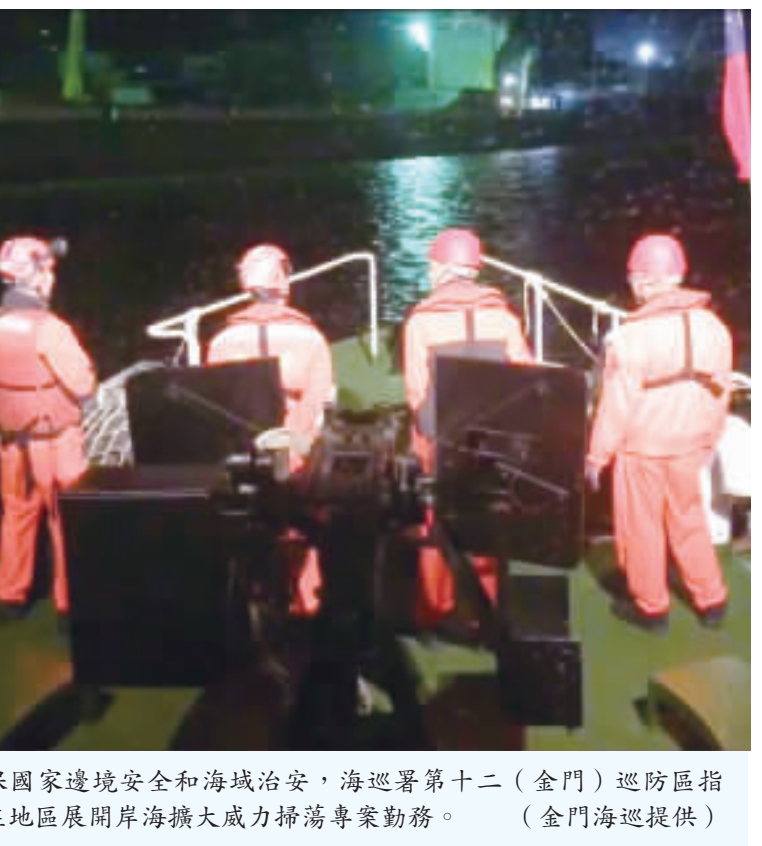
確保國家邊境安全及海域治安，海巡署第十二(金門)巡防區指揮部在地區展開海岸海巡大威力掃蕩專案勤務。