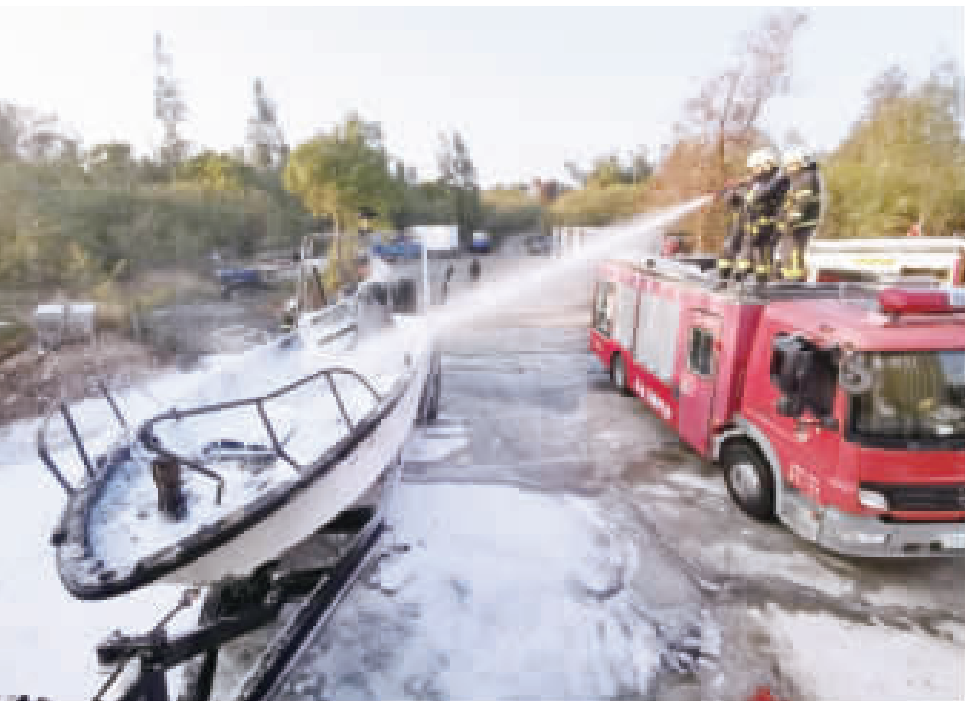
陽翟船舶火警，由金沙和金湖消防分隊合力撲滅。