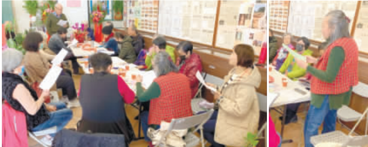
寫作協會於睿友文學館辦理讀書會。