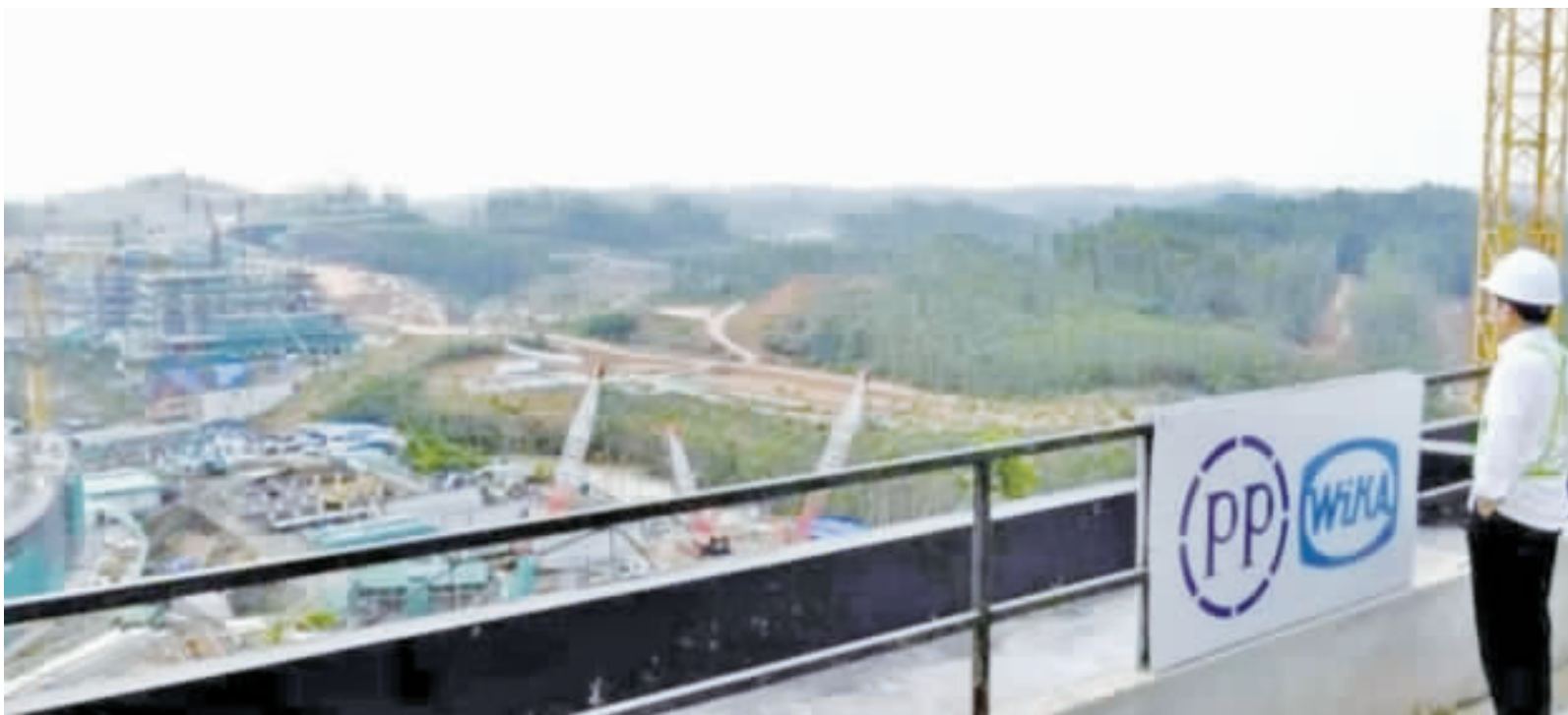
印尼努山塔拉新首都相關建設正如期舉行。(截至12月28日)