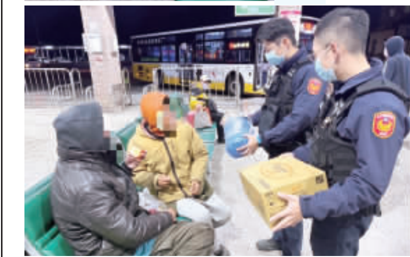
金湖鎮山外車站內一對母子相依坐在座椅上，湖警持續關懷並提供應急物品。

持聯繫，確保這對母子得到適當的安置。警方將持續關懷協助這對母子，以展現警警關懷弱勢之為民服務形象，以實際行動回饋社區，關懷弱勢群體。 金湖鎮公所特別邀請大家注意以下事項：每位民眾限領一張號碼牌，憑號碼牌兌換4副春聯。春聯送完為止，先到先得，領完為止。希望廣大民眾能夠遵守秩序，珍惜這次領取春聯的機會，共同維護好這個傳統文化的盛會。