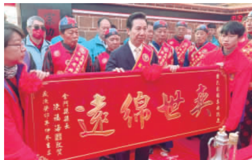
東蕭蕭氏家廟重建落成奠安，府會首長前往獻匾祝賀。

海内外蕭氏裔孫晉獻「將軍」、「博士」、「一門三傑」、「公忠體國」、「杏林春暖」等匾額