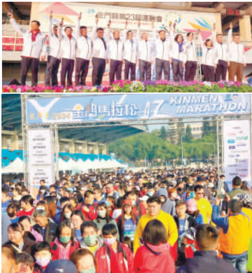
左：金門馬拉松開跑，民眾呼朋引伴，闖家一起開心參加；右：參加金門馬拉松完賽的民眾開心合影，右下、金防部派出部隊弟兄，全副武裝共襄盛舉。