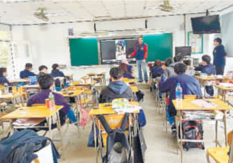
縣警局少年隊、金湖分局結合金門校外會入校、入班與高職生分享反詐騙觀念，強化學子自我保護觀念。

「遊戲點數」隱藏詐騙風險，縣警局少年隊、金湖分局結合金門校外會入校、入班與高職生分享反詐騙觀念，以「虛擬遊戲詐騙」遊戲點數的議題向學生們宣講，進一步強化學子自我保護觀念，避免被騙。 縣府112年最後一次縣務會議中，縣長陳福海主持「動政、親民」的施政理念，提示「為避免學生、民眾網路遊戲或遊戲點數消費爭議，...請教育處、消保官就相關主題加以宣導。也強調十分重視此問題，請教育處和警調局，增加巡查次數以及建立輔導機制...」 故縣警局除了例行性的入校、入班(112年度共計辦理了75場次、受眾28)人次)辦理校園法治教育、犯罪預防宣導工作外，對於陳縣長語重心長所重視及避免、防範年輕學子，因為不知而遭受詐騙、造成財物損失，教育局、金門校外會與金門高職服務單位聯繫，於本年(113)年1月3日就「虛擬遊戲詐騙-遊戲點數」的議題向學生們宣講，以強化自我保護觀念，避免被騙。 宣講過程中，說明「虛擬遊戲詐騙的手法」，是由歹徒於社群平台販售遊戲虛寶或帳號，要求轉帳匯款、購買遊戲點數到假冒的遊戲交易平台，稱操作錯誤導致帳號凍結需支付保證金的詐騙方式，因而造成財產的損失。其防範之道為： 1. 請透過(2)交易平臺(第三方支付)交易，切勿透過遊戲平臺交易及慎防假借遊戲交易平台。 2. 若涉及現金或遊戲點數在公共場所交易，其中必有詐。 3. 若發生以下行為請考慮再三，恐是危險交易：(1) 賣家要求購買遊戲點數、或遊戲點數卡序號取現金交易。(2) 原先答應面交，又臨時更改交易方式。(3) 提供的匯款帳號為銀行虛擬帳號，匯款後若為詐騙就不好追回款項的發達，原本電腦遊戲是一個人默默的玩家，演變到在網上與他玩遊戲對戰，而商家為了營利，乃推出遊戲點數卡讓玩家購買，只要輸入卡片上的帳號及密碼即可獲得等值的商品；也因此，讓詐騙集團有機可趁，將其作為網路交易詐騙工具使用。 縣警局表示，從未接觸或不熟悉網路遊戲點數的民眾，對於遊戲點數程序其實一無所知，只能依歹徒指示操作，加上帳號密碼均為亂數組成極難記憶，因此成為詐騙集團取得騙款之新興金流管道；因此，習慣於網路購物交易的民眾，千萬不要聽信任何人以「身分證認證」、「解除分期付款設定」等理由，要求前往購買遊戲點數，這些均為歹徒常用說詞，請民眾勿輕易上當，有任何與詐騙相關疑問請撥打165反詐騙諮詢專線查詢。