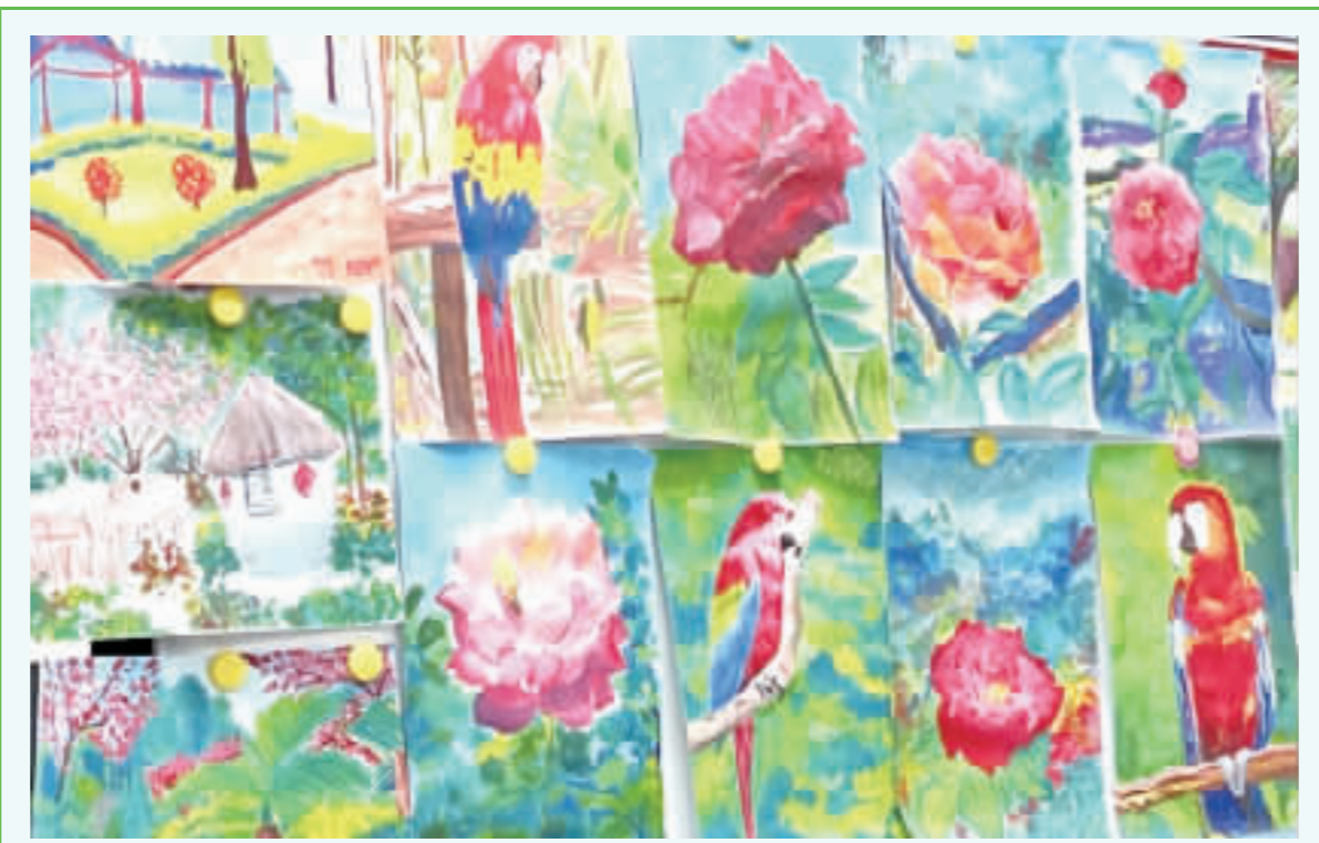
新進志工研習課程成果展示。