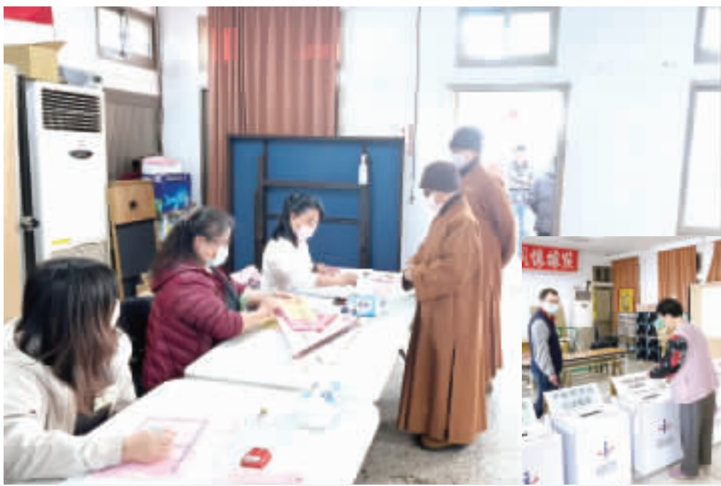
出家人投票；右下、長者投票。