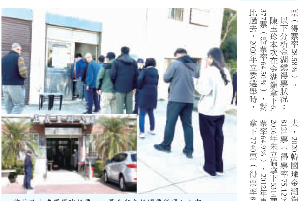
總統及立委選舉昨投票，一早金湖各投票所湧入人潮。

此次立法委員選舉，金城鎮的區域立委選舉總人數有三萬七千三百二十九人，統計最後的投票人數為一萬四千一百四十九人，其中有效票數為三千八百一十一張，投票率僅三成七左右。金門縣這屆的立委共有洪和成、陳玉珍、高文凱三人參選。金城鎮在投票方面，由陳玉珍得票數最高，有九千一百一十三票，高文凱獲得四千零一十六票，洪和成則是獲得三千五百五十五票。 在金城二十八個投票所，均由陳玉珍取得最高票數，其中以鳳翔社區活動中心得到三百九十二票為最多。高文凱在各投票所的得票數方面，則是以和平社區活動中心的兩百二十四票最多。 正副總統方面，金城鎮投票率也在三成七左右，以國民黨提名的侯友宜、趙少康的八千八百九十五票最多，囊括百分之六十二點八九的比例；其次為民進黨提名的柯文哲、吳欣盈的三千八百二十三票，獲得百分之二十七點零三；民進黨提名的賴清德、蕭美琴獲得一千四百二十五票，約一成左右。 政黨部分，投票數則有一萬四千四百四十五張票，無效票則有兩百五十九張。其中國民黨獲得票數最多，有九千零三十三張；其次則是台灣民眾黨的兩千九百二十四票，以及民進黨的一千一百一十七票。政黨票大致與總統票數差距不大。