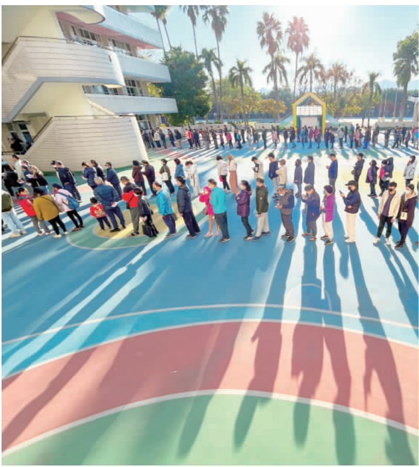
2024總統立委大選 民眾踴躍投票 2024總統大選及立委選舉13日登場，上午天氣晴朗，新北市板橋區溪洲國小投票所民眾大排長龍準備投下神聖的一票。(中央社)