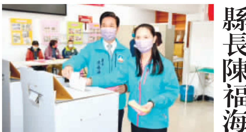
金門縣長陳福海偕夫人許美琴前往金湖鎮塔后社區活動中心投下神聖一票。

第11屆立法委員選舉，區域立法委員選舉金門縣選區選民12萬5321人，發出選票4萬5881票，有效票數4萬3612票，無效票數369票，投票率33.33%。各候選人得票數為：陳玉珍3777票(得票率8.65%)，向文凱1萬3177票(得票率30.2%)，洪和成2188票(得票率5.02%)，洪和成2188票(得票率5.02%)，洪和成2188票(得票率5.02%)。