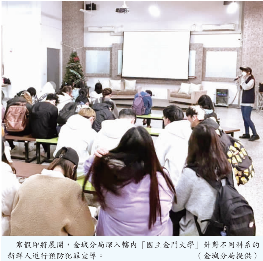
寒假即將展開，金城分局深入轄內「國立金門大學」針對不同科系的新鮮人進行預防犯罪宣導。

記者莊煥寧/綜合報導 寒假即將展開，金城分局深入轄內「國立金門大學」針對不同科系的新鮮人，在寒假開始前進行連串預防犯罪宣導，金城分局特別提醒同學們在寒假期間切勿聽信網路、簡訊或通訊軟體群組內號稱高獲利投資或是高報酬打工旅遊等各種詐騙手法，避免受騙而血本無歸。 金城分局指出，網路上各類號稱免經驗、高報酬之求職廣告，幾乎都是詐騙陷阱，千萬不要輕易受騙上當，以免成為詐騙集團眼中的肥羊。針對網路詐騙盛行，也提醒同學應特別注意勿相信各類社群平台上與市面定價顯不相符的商品，同時也要慎選合格賣家，避免受騙。 金城分局也分享許多防詐騙的知識，如：網路購物陷阱多，現在不只「假買家」，還有「假買家」！「假買家」下單時私訊買家伴稱「系統顯示商品無法結帳」，甚至還貼心傳「配合申請金融驗證的『連結』」，只要買家「點進去照著指示操作」，賣場就能避免被扣等、停權！對此，提醒民衆千萬要等一下，請先查證，不亂點陌生連結！不要依照對方指示操作！以減少被騙的機會。 「陌生連結不亂點，陌生帳號別被騙！」金城分局也提出「反詐五不一」包括：「不接」陌生來電、「不聽」投資明牌、「不點」未知連結、「不傳」個人資料、「不信」可疑資訊。另外，如在拍賣網站、社群平台看到遠低於市價或標示不明確的商品，想詢問賣家卻發現網站上「沒有客服電話」，也「沒有公司名稱」，聯絡方式只有LINE (LINE: hesssara) 或EMAIL，金城分局叮嚀同學對於這種要小心了，因為你可能遇到詐騙，要得網路購買遠低於市價的商品前，要多方查證才安心！而看到與賣家私下加(LINE: hesssara)交易可免手續費或領小贈品時，也要提高警覺！ 除此，像是網友要寄送禮物(包包)給你，但要先付關稅才能收到，對方要求你投資匯款(美金)，一起存結婚基金等等諸如這樣的騙術，那可能遇到愛情的騙子，千萬不要被騙。金城分局提醒，因為愛情的騙子，盜用帥哥美女頭像，透過交友軟體、理財群組等管道搭訕、噓寒問暖，卸下你的心防，讓你繳「錢」投降。對於這種虛假愛情假交友的騙術，千萬要仔細查證別昏頭！