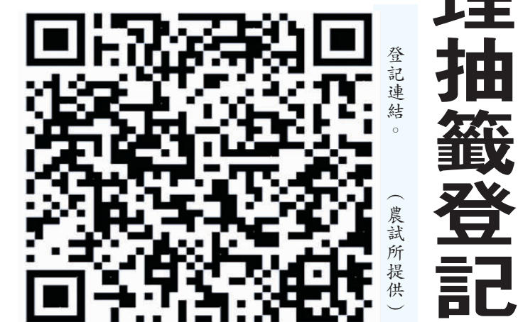
登記連結。

記者陳麗好/金沙報導 農曆春節何處去，金門農業試驗所推出一系列迎新活動，並配合活動於大年初一至初三(2月10日至12日)推出「闔家烤肉趣」親子烤肉體驗活動。活動自13年1月15日(星期一)至13年1月16日(星期二)每日抽籤登記，每日抽籤25組，共計75組，並預計於13年1月17日(星期三)上午10時公開抽籤登記，可上網登記 https://forms.gle/omv7jNHz12LW06 ，或掃描QRcode連結登記報名，若有疑問可電話洽詢。 農試所表示，為營造東昇島春節假期烤肉體驗，增進戶外親子遊憩空間，配合農曆春節推出一系列活動，其中，「闔家烤肉趣」親子烤肉體驗活動，自13年1月15日(星期一)至13年1月16日(星期二)每日抽籤登記，每日抽籤25組，共計75組，並預計於13年1月17日(星期三)上午10時，暫訂於13年1月17日(星期三)上午10時，暫訂於農試所辦理公開抽籤登記。 農試所指出，凡經抽籤錄取者每組收取(1,000)元(其中1,500元為代訂材料費；200元為場地租金；300元為環境清潔保證金，保證金將於抽籤後中籤者領取完畢後退還)。農試所也提醒，中籤者須於抽籤後2個工作日內繳交活動費用(2,000)元，如逾期未繳交者，其缺額依抽籤候補順序遞補。 而農試所今年春節活動熱鬧可期，農試所指出，新春活動期間共推出平安祈福袋來、農試所趣味DIY、過關斬將獲獎券、悠遊自行車風光、觀光茶園摘茶及磨小麥體驗等多項活動，歡迎地區民衆在春節期間前往遊園，欣賞金門的田園風光之美。