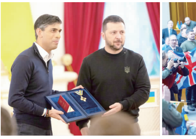
2024總統大選及立委選舉13日登場，上午天氣晴朗，新北市板橋區溪洲國小投票所民眾大排長龍準備投下神聖的一票。