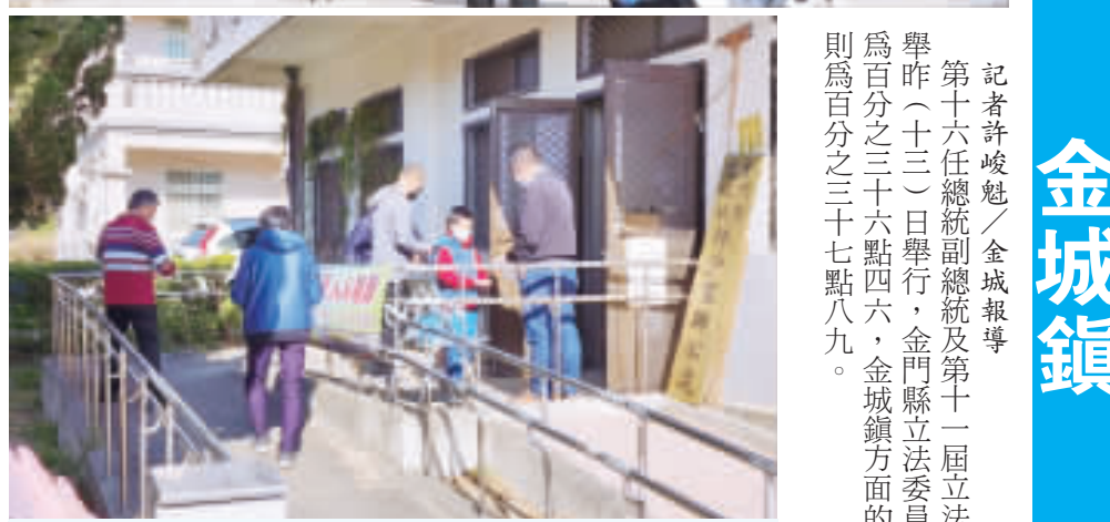
總統暨立委選舉，金城鎮投票率約三成七左右。