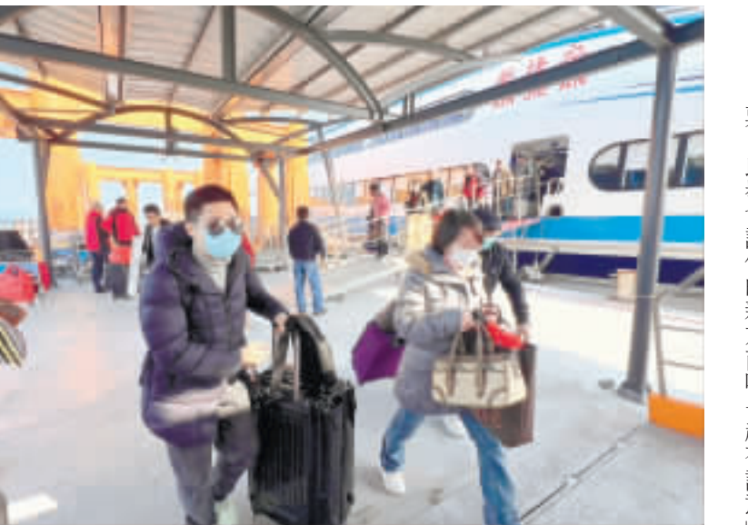
選舉當天，仍舊有不少人經由小三通返金投票。

記者許峻魁／金城報導 昨(13)日的投票日當天，一早從廈門或台灣前往金門的海陸交通仍舊是相當的忙碌，昨日上午小三通船班的載客率，大約有八成到九成。部分在廈門工作或是台商，都是利用星期五下午或昨日早上的船班返金來投票。 正副總統及立委選舉投票最後截止時間為昨日下午四時為止，因此昨日上午的小三通船班仍有不少民眾趕著自五通碼頭搭船前往水頭碼頭，以便可以順利趕上投票的時間。 就有民眾表示，自己是在廈門工作，因為距離很近，所以才會選擇搭乘昨日上午的船班返金，不過從廈門出發的船班目前幾乎快客滿了，感覺應該都是要回來投票的民眾。 有台商則是透過小三通返金投票，他說，從去年十二月就開始規劃，把假期請好，並且提前預定船票還有機票，而且一條龍的返台途徑相當方便。還有一些較為謹慎的民眾，甚至提前三個月就先訂好機票、船票，深怕當天候補不及，錯失投票的機會。 還有位姓陳的民眾因為苦等不到加班機返金，竟然選擇從桃園機場搭乘上午的兩岸直航班機到廈門，再轉小三通，從廈門、五通搭十二時三十分的新捷安輪客船回到金門，並準備搭當晚八時的班機返台，就只為了投下他神聖的一票。此舉也讓他親友直呼「超有誠意」。