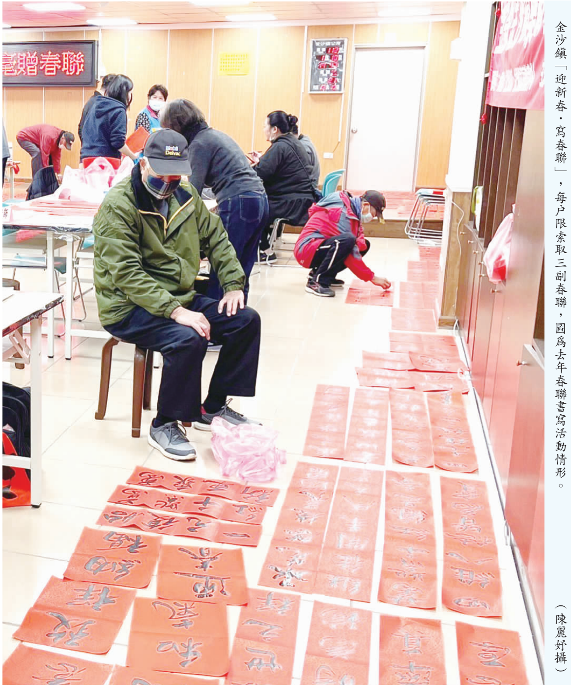
金沙鎮「迎新春、寫春聯」活動，每戶限索取三副春聯，圖為去年春聯書寫活動情形。