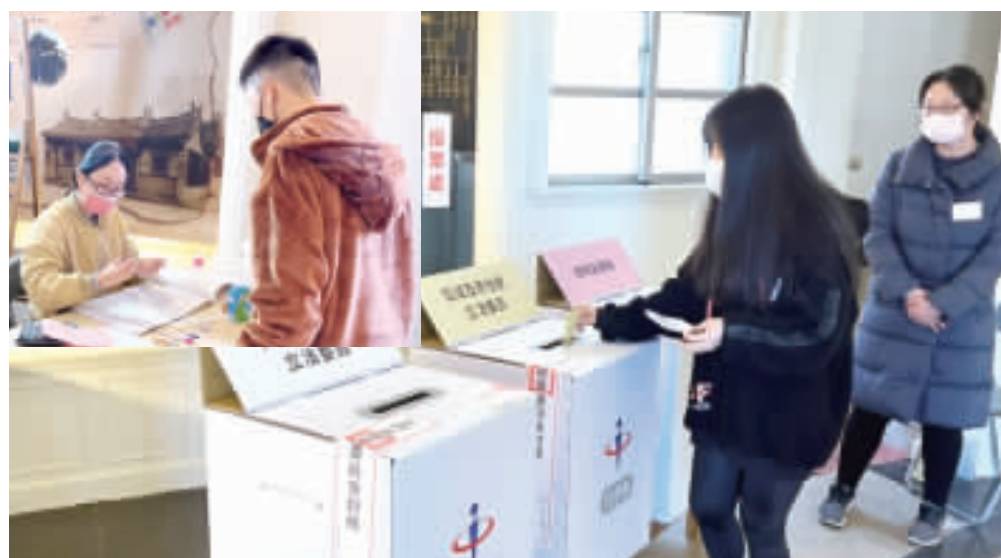
接近中午時刻，許多年輕人陸續出門完成投票。