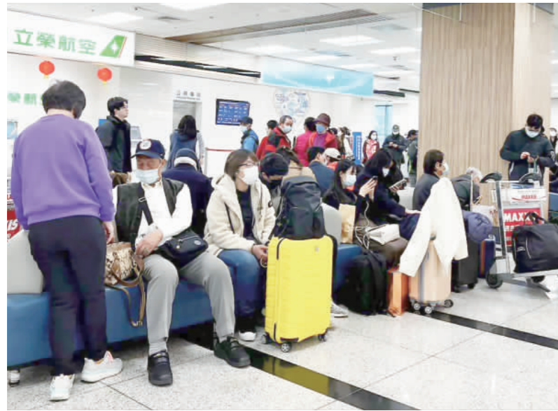
許多金門鄉親在松山機場等不到飛機回家鄉投票。

記者陳冠霖／綜合報導 昨天是大選投票日，但傳出有上百位金門鄉親在松山機場等搭軍機回金門投票，最後軍機卻沒開成，讓這些鄉親在機場怨氣「我要投票」。對此，國防部表示，相關人力調節，均以滿足戰備任務需求，兼顧官兵投票權益為原則，故無法支援民航局「臨時」提出之疏運任務需求。據了解，從頭到尾國防部都沒有同意要派機運任務需求。據了解，從頭到尾國防部都沒有同意要派機運任務需求。據了解，從頭到尾國防部都沒有同意要派機運任務需求。 據了解，從頭到尾國防部都沒有同意要派機運任務需求。據了解，從頭到尾國防部都沒有同意要派機運任務需求。據了解，從頭到尾國防部都沒有同意要派機運任務需求。