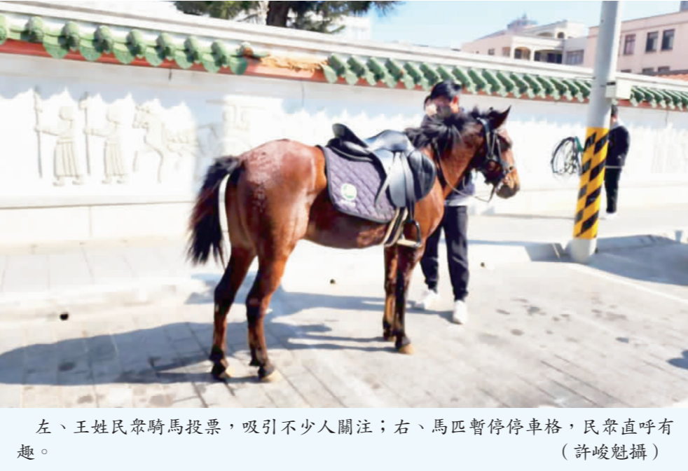
左、王姓民眾騎馬投票，吸引不少人關注；右、馬匹暫停停車格，民眾直呼有趣。