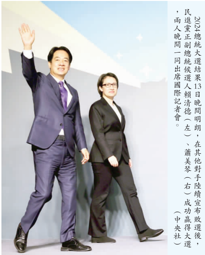
總統大選結果13日晚間明瞭，在其他對手陸續宣布敗選後，民進黨正副總統候選人賴清德(左)、蕭美琴(右)成功贏得大選，兩人晚間一同出席國際記者會。

【中央社台北13日電】民進黨總統候選人賴清德今晚8時30分與副總統候選人蕭美琴舉行國際記者會，自行宣布當選。賴清德說，已經接到對手恭賀的電話，也恭喜他們斬獲國會席次，未來盼能一起團結合作。