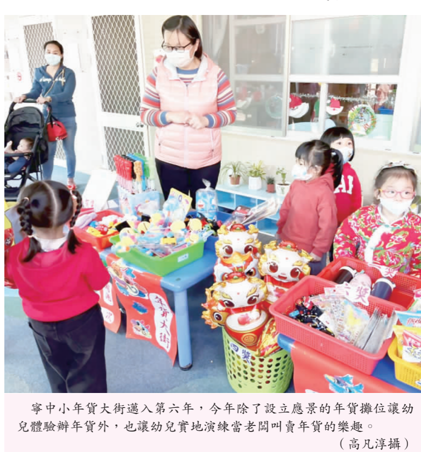
寧中小附幼年貨大街邁入第六年，今年除了設立應景的年貨攤位讓幼兒體驗辦年貨外，也讓幼兒實地演練當老闆叫賣年貨的樂趣。

金寧中小學表示，年貨大街邁入第六年，今年活動規劃，除了幼兒團體四個班級販售年貨外，還有國小組志工隊、年級家長手製餅乾及廣邀幼兒家長、教職員工、家長手製年貨，現場還有美觀的推車販售各種手工餅乾，甚至還有在地知名書法家唐敏達老師現場揮毫春節聯，年味滿滿、熱鬧非凡。為了達到教育宣導作用，特別邀請金門縣警察局、金門縣消防局、金門縣環保局、金門縣社會處暨育兒宣導、金湖社會福利服務中心、幼兒園除扣除幼兒小老關獎品後將全額捐出做公益，加上國小組志工隊及家長商家繳交200元公益金，將於1月16日捐助金門家扶中心。