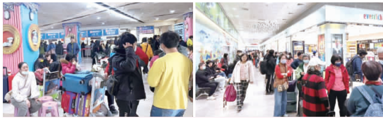
投票結束後第一個星期天，小三通人山人海，民衆趕著搭船回廈門。

責任編輯／翁維智 中央已全面開放公費肺炎鏈球菌疫苗接種，籲請符合資格之民衆踴躍進行接種。