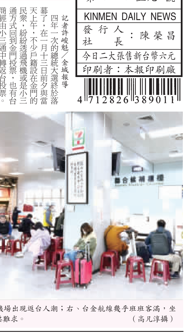
左、選舉結束，尚義機場出現返台人潮；右、台金航線幾乎班班客滿，坐在候補櫃檯前的旅客一票難求。

沒有機會補到更早的班機，這樣工作就不用請太多假，無奈廣播聲始終喊著「班機已全數報到，無候補機位」。大家表示不連續假期，機位竟然還一票難求，如晚點再等不到，只好放棄回家。 為預備今年選舉將迎來更多返鄉人潮，航空公司加開不少加班機，昨日有38班次從金門飛往台灣各地，最晚班機時間為晚上九時。根據金門航空提供的資料，13日投票日到站37班次，載客數2500人，載客率82.24%，離站37班次，載客數2000人，載客率59.5%，可見鄉親們對於選舉的極高參與感！