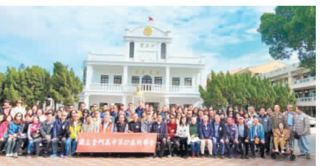
金門高中第27屆校友返校齊聚，在白宮前合影。

記者許峻魁／金城報導 第27屆畢業校友，利用選舉期間約從台灣各地再度齊聚，在選舉結束後隔天，一起回到母校金門高中，回娘