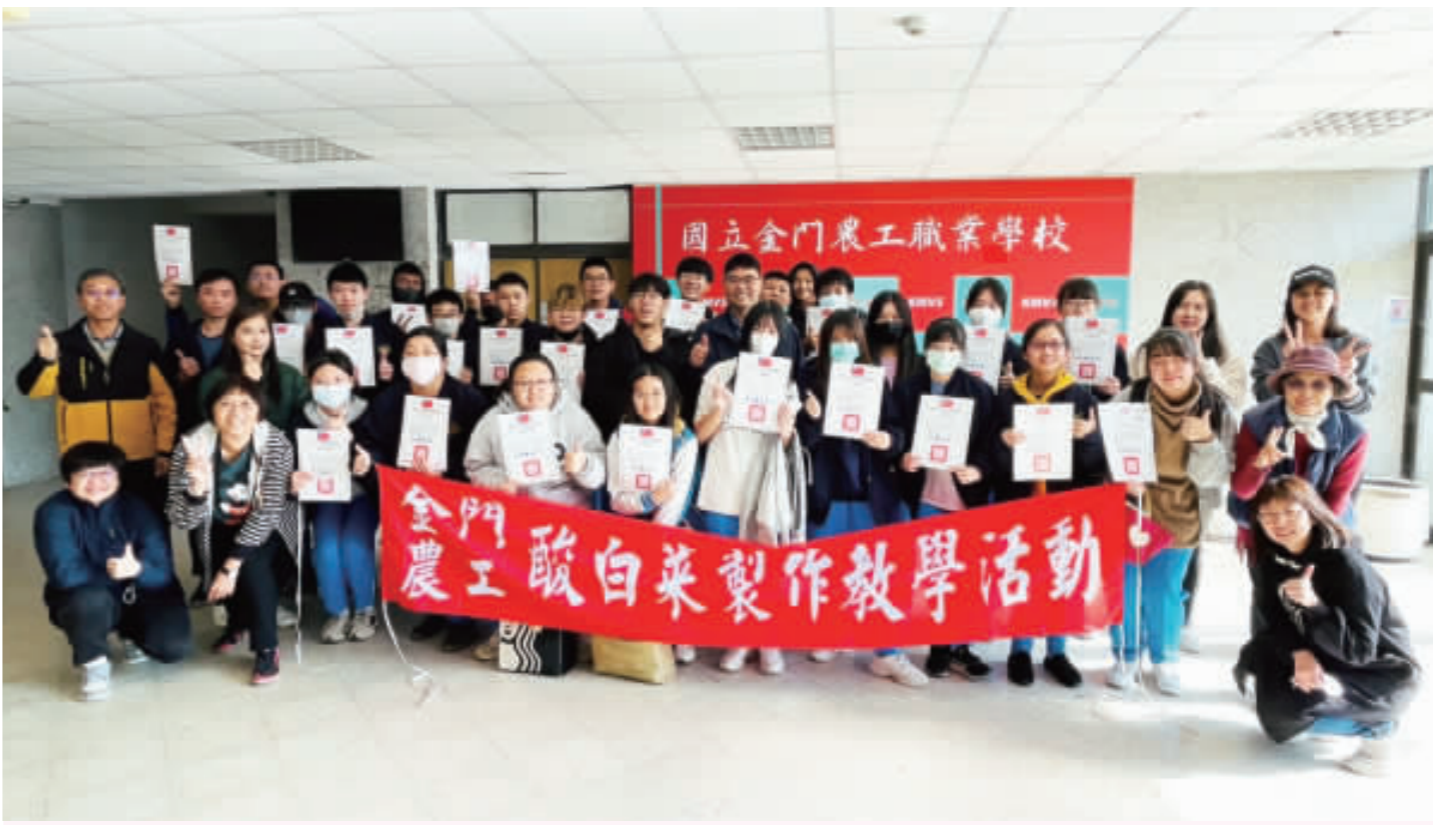
農工學子酸白菜，創意養生年味滿！金門農工112學年度特色實習產品跨域教學活動圓滿落幕。

記者辛亦斌／金湖報導 金門農工學校再度成功舉辦年度特色實習產品跨域教學活動。來自自科系的34位學生參與了這場結合產業實習與跨域教學的盛事，為這場傳統的實習活動增添了新的活力。 該活動由金門農工學校主辦，旨在培養學生的實際操作技能，並加深學生對農園產品、健康養生及通路行銷的理解。該傳統的實習活動已經逐漸發展成為金門農工的一項重要特色，吸引越來越多的學生積極參與。 據了解，在本次實習中，農工的學生們進行了酸白菜的製作。包括切菜、發酵、檢測pH值乃至真空包裝等環節，學生皆全程參與。值得一提的是，