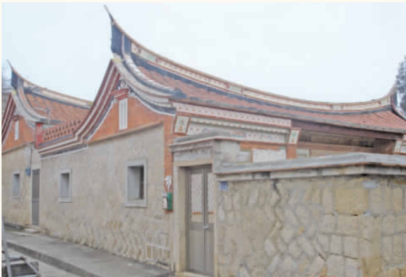
金門金湖鎮東村之百年古厝。