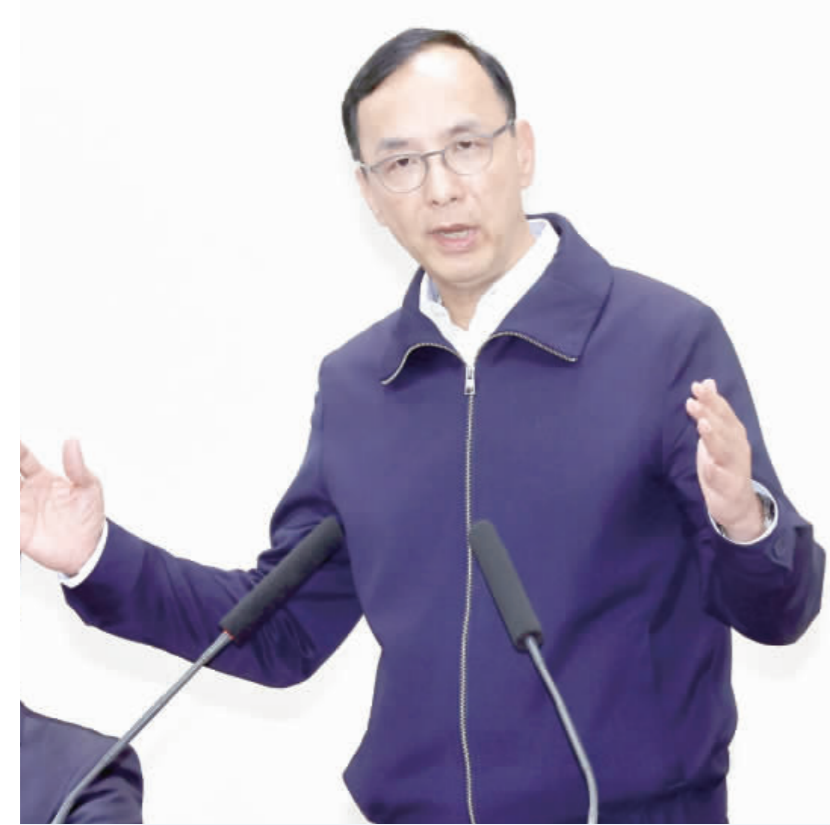
國民黨總統大選敗選，黨主席朱立倫17日下午在國民黨中常會上強調，所有責任他會一肩扛下，會繼續忍辱負重，堅定奮戰到任期結束。(中央社)

另外國泰永續高股息ETF、群益台灣精選高息ETF、合庫金、力積電、台積電、中鋼、玉山金、元大金、彰銀、緯創、英業達、華航、台企銀、華新、國泰台灣領袖50 ETF、華南金、台達電、永豐金、大同等，也均遭外資賣超逾萬張。 台股期指受外資賣超影響，台股期指收盤後，台股期指期貨淨空單減少1340口至13443口，其中外資空單減碼超過多單減碼，淨空單減少2716口至4532口。 台股期指受外資賣超影響，台股期指收盤後，台股期指期貨淨空單減少1340口至13443口，其中外資空單減碼超過多單減碼，淨空單減少2716口至4532口。