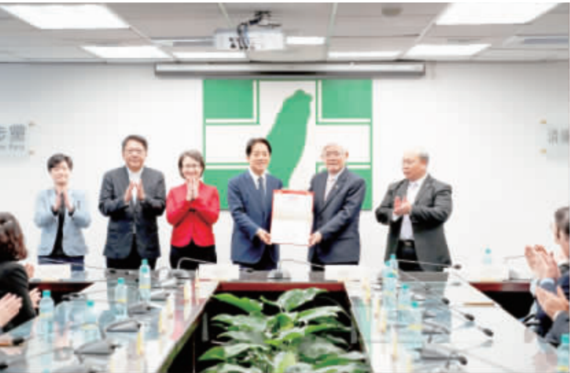
中選會公告：賴清德、蕭美琴當選第16任正副總統。

【中央社記者溫香台北19日電】中華民國第16任正副總統賴清德、蕭美琴今天接下中央選舉委員會頒發的選證書，賴清德表示，未來將與蕭美琴一定全力以赴，落實「清廉、勤政、愛鄉土」的精神，以及「愛、非暴力、和平」的核心價值，推動國家進步、團結台灣、造福人民。