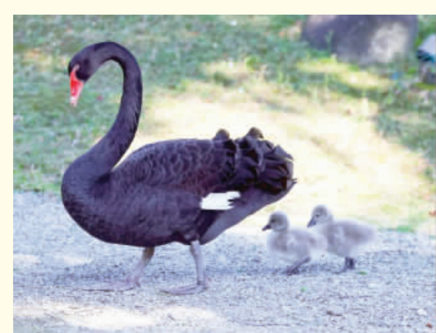
台北賓館的小天鵝誕生，台北賓館的黑天鵝家族14日迎來2隻新生的小黑天鵝，也是自民國103年2月黑天鵝家族產下小天鵝後，睽違10年再有小天鵝出生。

【中央社記者吳家豪台北19日電】台股電價漲破60元，台股今天終場漲43.73點，收17681.52點，外資及陸資買超新台幣801.69億元，創史上第2大，終止連4買，買超台股逾11萬張，股價漲停的緯創復買超逾6萬張、排名第2。