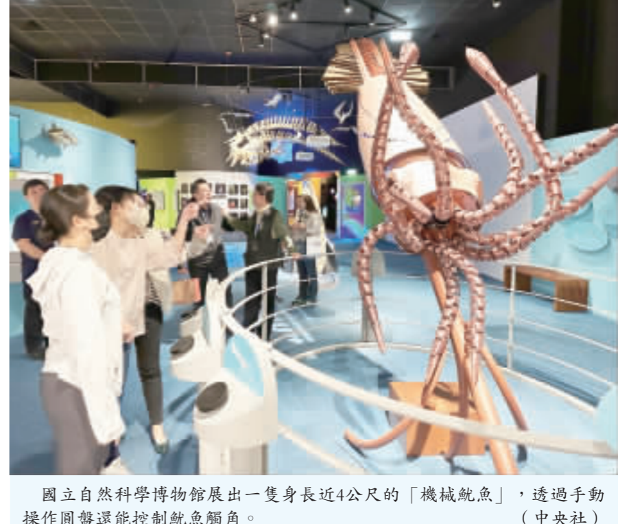
國立自然科學博物館展出一隻身長近4公尺的「機械魷魚」，透過手動操作圓盤還能控制魷魚觸角。

【中央社記者趙麗娟台中19日電】國立自然科學博物館全新開幕展「奇幻自然」今天開幕，5大主題區呈現自然界的規則與奧秘。