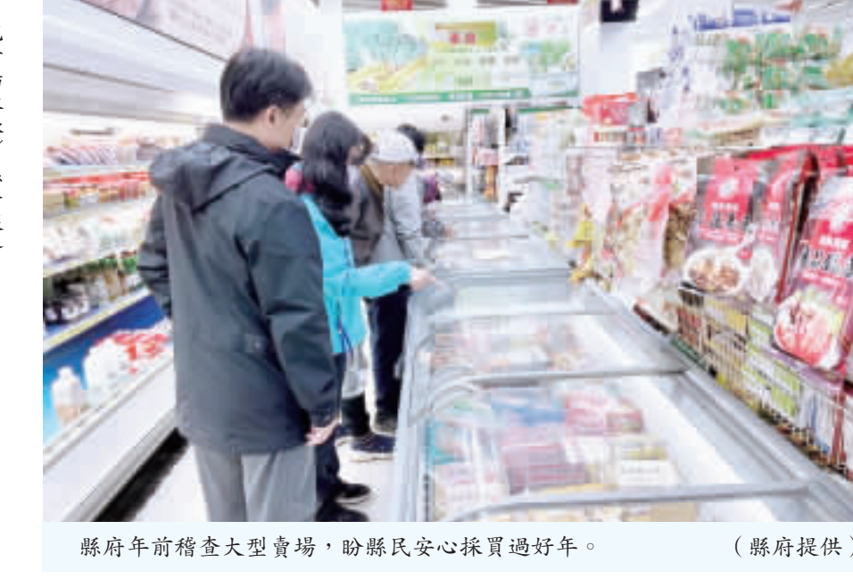
縣府年前稽查大型賣場，盼縣民安心採買過好年。

縣府稽查賣場公共安全 讓縣民安心採買 記者楊水冰／縣府報導 農曆甲辰年春節將至，地區大型賣場及量販店湧現採辦年貨人潮，金門縣政府日前由消防局、衛生局、稅務局、社會處及建設處等單位，針對大型賣場展開公共安全聯合檢查，要求賣場的公共安全及防火避難設施等能確實落實，讓縣民能安心採買迎新年。 縣府呼籲大型賣場及量販店等場所營業人對場所公共檢查認知的重要性，要求場所公共安全及防火避難設施確實落實，讓縣民能安心採買，並需定期辦理建築物防火避難設施及設備公共安全檢查申報，慎防疏失改善時機。 建設處指出，轄內五百平方公尺以上大型賣場及量販店共有13處，每年的農曆年前都會加強公共安全檢查，這些大型消費場所公共安全，以強化消費者消費環境安全。 建設處特別提醒場所業者，依建築法規規定，達申報條件之場所，未依期限完成申報及改善手續者，依法可處6萬元以上、30萬元以下罰鍰，並可連續處罰。同時，建設處表示在春節期間，各大賣場除提供縣民完善購物服務，也應隨時保持防火避難設施、逃生動線暢通及電梯正常運作，平時應對於各項防火避難設備、昇降設備等加強維護，且切勿於逃生動線堆置雜物或商品影響逃生，讓縣民擁有採辦年貨的安全環境，共同迎接新年。