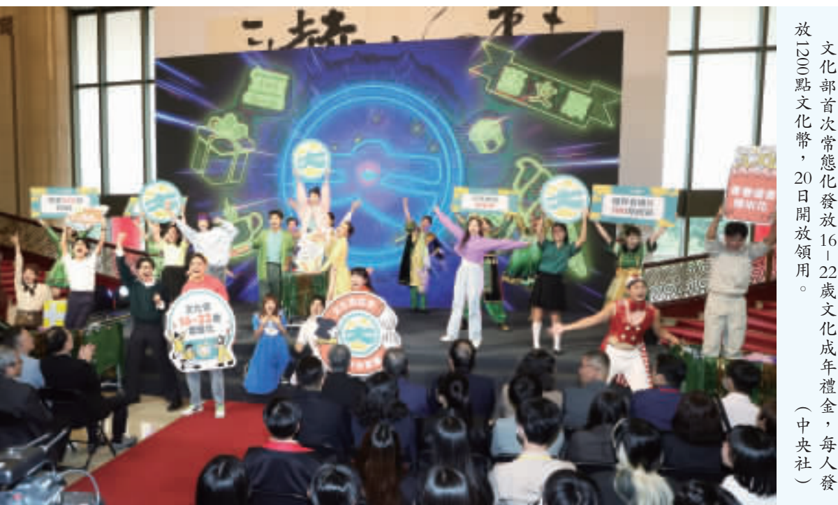
文化部首次常態化發放16-22歲文化成年禮金，每人發放1200點文化幣，20日開放領用。(中央社)

【中央社台北20日電】文化部開放發放16-22歲文化成年禮金，行政院長陳建仁說他的外孫女高二，「我會催她快點領。」他並幽默地表示，他也很想回到16歲。