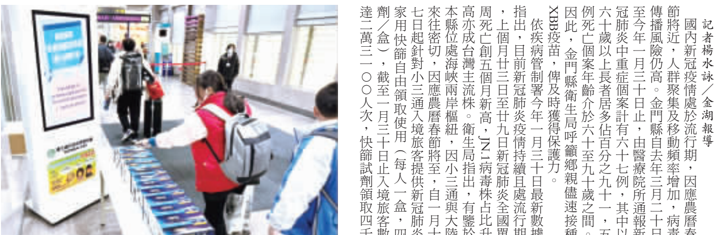
▲金門醫院一〇三三年春節期間門診表。 ▲因應農曆春節將至，自一月十七日起針對小三通入境旅客提供新冠防疫快篩自由領取使用。

記者楊水冰／金湖報導 國內新冠疫情處於流行期，因應農曆春節將近，人群聚集及移動頻率增加，病毒傳播風險仍高。金門縣自去三月二十日起至今年一月三十日止，由醫療院所通報新冠肺炎重症個案計有六十七例，其中以六十歲以上長者居多佔百分之九十一，五例死亡個案年齡介於六十至九十歲之間。因此，金門縣衛生局呼籲鄉親儘速接種XBB疫苗，俾及時獲得保護力。 依疾病管制署今年一月三十日最新數據指出，目前新冠感染疫情持續且處流行期，上個月廿三日至廿九日新冠感染全區國周死亡創五個月新高，Zeta病毒株占比升高亦成台灣主流。衛生局指出，有鑒於本縣位處海峽兩岸樞紐，因小三通與大陸來往密切，因應農曆春節將至，自一月十七日起針對小三通入境旅客提供新冠防疫快篩自由領取使用(每人一盒，四劑/盒)，截至一月三十日止入境旅客數達二萬三〇〇〇人次，快篩試劑領取四千一百三十六份。 金門醫院於農曆春節期間初一至初三(二月十日)至二月十二日(開設)呼吸道傳染病特別門診，提供有呼吸不適症狀之民眾就診服務(連結網址：衛生福利部金門醫院最新消息)。倘有就醫需求之民眾可多加利用。另，本縣備有足夠之公費COVID-19口服抗病毒藥物，春節期間合約機關開診時間表(連結網址：金門縣衛生局/嚴重特殊傳染性肺炎專區/「衛生局」嚴重特殊傳染性肺炎專區/金門縣113年春節期間公費COVID-19口服抗病毒藥物合約機關開診時間表)，供民眾查詢運用。 衛生局指出，防治新冠最有效之方法為每年接種一劑新冠疫苗，請尚未接種新冠XBB疫苗之民眾可在莫德納和Novartis兩種廠牌之XBB疫苗選擇一種接種即可。接種對象：莫德納適用於六個月以上幼兒，Zeta適用於十二歲以上兒童，呼籲鄉親把握機會，踴躍前往接種，以提升自我保護力，以免在此波疫情中保力不足而感染新冠病導致較嚴重併發症。另六十五歲以上長者，中央已全面開放公費肺炎鏈球菌疫苗接種，籲符合資格之民眾踴躍進行接種。