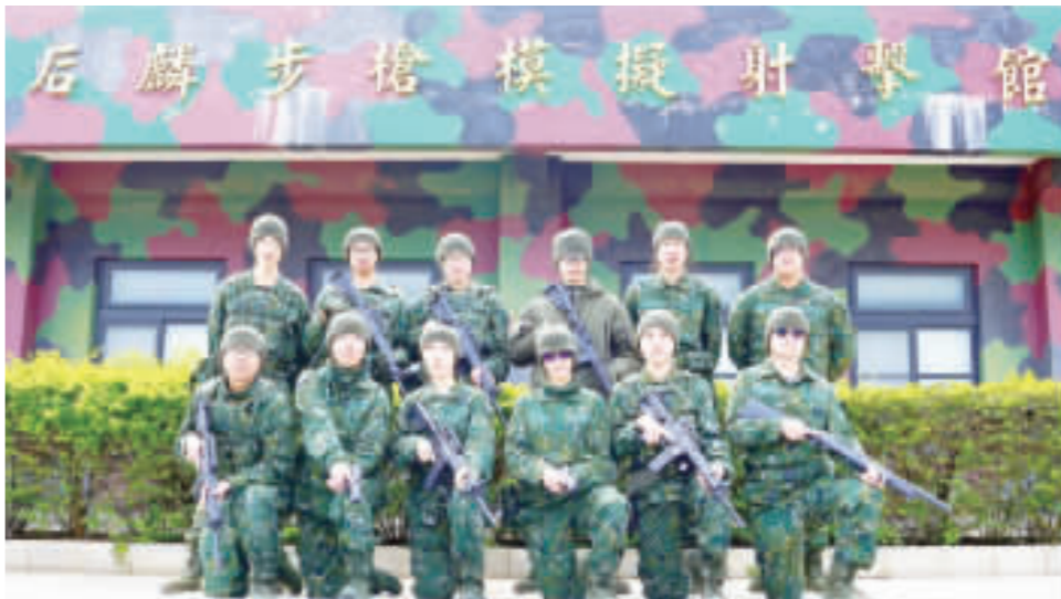
雲林縣全國防教育協會在金門圓滿成功舉辦了113年金門戰地觀光暨全國防教育之旅。