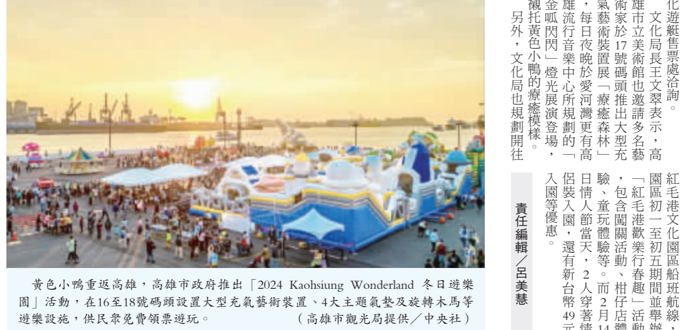
黃色小鴨重返高雄，高市府在16至18號碼頭設置大型充氣藝術裝置、4大主題氣墊及旋轉木馬等遊樂設施，供民眾免費領票遊玩。