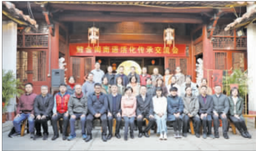
上、現場簽約儀式照片。