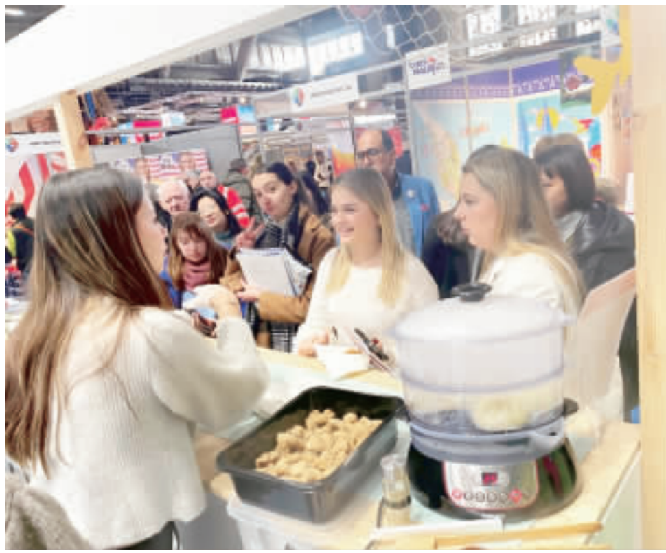
每年2月初，布魯塞爾博覽會場(Brussels Expo)占滿了各國觀光機構和大型旅行社的攤位，台灣館空間雖小卻總能留住人潮，靠的就是美食魔力。

【中央社記者田智如布魯塞爾一日專電】布魯塞爾國際觀光展今日起開幕，台灣館再度吸引潮排隊品嚐小吃美食。展前幕後有著一群台灣遊子、愛家眷出力相挺的動人身影，甚至能克服食材難題做出道地台灣味。 總辦白煙從堆滿刈包的透明蒸籠裡冒出一股熱氣，長壽龜造型的米糕口裡衝著一枚歐元討喜，還有鹽酥雞炸鍋掀開時的滋滋作響和濃烈香氣；「光是香味我就很有信心會吸引很多民眾靠近我們這邊」，駐歐盟兼駐比利時代表李淳在現場興奮的告訴中央社記者。 每年2月初，布魯塞爾博覽會場(Brussels Expo)占滿了各國觀光機構和大型旅行社的攤位，台灣館空間雖小卻總能留住人潮，靠的就是美食魔力。李淳說，「台灣的軟實力不只在于人，還有可以呈現許多台灣特色平常的事物和食物對歐洲人來說都很有趣。」 歐洲旅客向來占台灣觀光客比重低，但李淳指出，這兩年歐洲來台人數明顯增加，雖然總數仍無法與日本、東南亞相比，但成長率應數一數二。主要原因是亞太地區在歐洲新聞曝光度增加，尤其台灣議題受到凸顯，從國家領導人到半導體都被談論，讓歐洲人想看看台灣是什麼樣子。 「而且台灣本來就是很好玩的地方」，李淳說，台灣如短時間、文都與歐洲很不同，今年旅展時間就能到達高山大海。今年旅展便以「台灣海洋世界」概念設計展場，用小卷、海草、小琉球海龜等裝飾點綴。