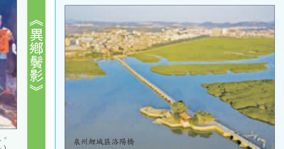
泉州鯉城區洛陽橋

【認識鯉城區】鯉城區，雅稱刺桐、瑞桐、溫陵，古稱晉江，是中華人民共和國福建省泉州市下轄的一個市轄區。鯉城區是泉州市中心城區之一，是古代泉州府城所在地，因古城形似鯉魚得名。