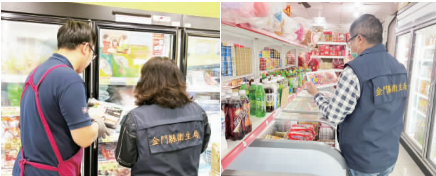
左、右：金門縣衛生局追查問題肉品，昨派員查察縣內三家食品販售業者，以維護消費者安全及權益。

記者楊水詠／金湖報導 台中市政府檢出白糖安心豚梅花肉片含有法規標準不得檢出的瘦肉精西布特羅（Cimbuterol），金門縣衛生局昨（3）日派員查察縣內三家食品販售業者，問題肉品未流入本縣，請民眾安心。 金門縣衛生局表示，台中市政府衛生局抽驗國產白糖安心豚梅花肉片（冷凍），有效日期為2024年6月10日，追溯號碼23121150490T52133的產品，檢出瘦肉精西布特羅（Cimbuterol）0.00ppm，違反食品衛生管理法規定，衛生局昨天即派員查察，以維護消費者安全及權益。 經金門縣衛生局昨日派員查察縣內三家全聯門市、家樂福、鈞統等食品販售業者，皆有進貨及販售該同批號產品，問題肉品未流入本縣，並請民眾安心，衛生局將持續追蹤查察市售產品。 西布特羅為β型受體素的一種，屬農業部禁用藥物，國內動物用藥殘留標準，西布特羅為不得檢出項目。此次，台中市府檢出瘦肉精西布特羅0.02ppm劑量很低，但如果人體大量食用瘦肉精含量超過標準值的食物，可能會出現噁心、頭暈、肌肉顫抖、心悸、血壓上升等中毒症狀。 金門縣衛生局表示，為維護本縣食用豬肉產品之衛生安全，衛生局110年1月至112年12月31日總計抽驗豬肉366件檢驗β型受體素（瘦肉精），皆未檢出，查核21009件豬肉原產地標示，皆符合規定。