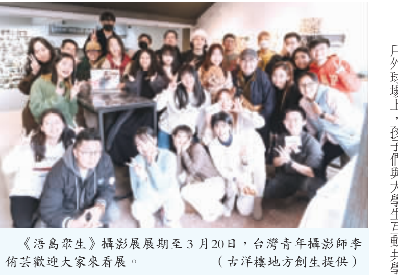
《浩島眾生》攝影展展期至3月20日，台灣青年攝影師李佑芸歡迎大家來看展。

縣長陳福海在昨天下午行程中，他聽聞黃祖耀主席離世的消息後，立即委請李文良副縣長、社會處黃雅芬處長同僑務辦公室同仁向黃主席家人、金門會館發出悼電，轉達縣長陳福海深切的哀悼之意。 縣長陳福海回想，57年，其在縣府團隊接任新加坡進行宣慰東南亞僑社之旅，以黃祖耀主席父親為名的「金門會館黃慶昌堂」接受僑領們的接待，更在大華銀行總部會見了黃祖耀主席。 黃祖耀是新加坡銀行界的併購高手，在大華銀行的發展史上，最為津津樂道的是黃祖耀在短短15年裡，運籌帷幄收購另外四家新加坡銀行，帶領大華銀行一躍成為新加坡數一數二的大型銀行集團。他策劃的最大收購是在2003年擊敗具有政府背景的星展銀行，「友善」控制了華聯銀行（OUB）。大華銀行也因此發展成新加坡三大銀行之一。多元化的業務跨越金融服務、普通保險、股票經紀、房地產開發、酒店管理及製藥業等。 縣長陳福海說，當年88歲的黃祖耀主席親切地迎接縣府參訪團，還記得會見的過程中黃主席娓娓道來他對金門的情感以及對於家鄉鄉情事業的期許，縣長陳福海也把握難得的難得時光向黃主席報告金門發展現況，並竭誠邀請主席能再回來金門走走。對於陳縣長的邀請，黃主席提及因為年歲已大，較少出遠門，不願再回故鄉走一趟，特別是有看看金門大學以及自己的故居村莊「金沙英坑」。 黃祖耀在新加坡及東南亞國家聯盟深受推崇和尊敬，也長期擔任新加坡華商、商社的領袖，如新加坡會館館長、總商會主席、新加坡中華總商會會長、華僑董事局主席、福建會館主席、金門會館主席等。他是華人的代表、僑社的象徵、新加坡銀行界的代表，也是金門人的象徵，他的地位，非常不一般，身兼許多商會、僑社的榮譽主席或總會長。 2009年，黃祖耀獲頒卡塔爾金融中心「亞洲銀行家終身成就獎」。他對造福桑梓，也是無比心誠，如資助學校的事蹟，在僑界、民辦教育界早已傳為佳話，更是金門人的驕傲。 黃祖耀的離世，對金門而言是一巨大損失。他不僅是金體海外華人的榮耀，亦是現代企業家經營事業的典範、國際金融界翹楚，誠為金門人之光，熱愛鄉土的情懷令人感佩。 縣長陳福海說，回顧黃祖耀主席充滿傳奇的一生，早年的奮鬥可說是體現了堅毅刻苦、積極進取的精神，在而立之年接下父親的企業重擔後，更利用靈活的經營策略運籌帷幄讓公司持續壯大，進而成為新加坡金融業最重要的銀行集團之一。 縣長陳福海表示，最讓他感佩的是：黃祖耀主席在企業界功成名就後，對於僑社與金門家鄉教育的付出。2005年金門大學升格，當年黃主席即捐助新台幣2千多萬元為金大添加學費動能。更由於黃主席長年來對於僑社的卓越貢獻，更獲頒新加坡政府頒發象徵最高榮譽的國慶勳章「殊勳勳章」。哲人漸逝，典範永存，祖耀主席為故鄉金門的奉獻與付出將永留於青史中。