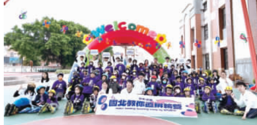
來自國立台北教育大學直排輪社的大學生，跨海至古寧國小展開一週五天的「直排輪冬令營」。

記者高凡洋／綜合報導 為提供偏鄉國小學童有一個豐富多元的冬令營活動，透過直排輪運動培養運動興趣及生活的態度，提升學生的自信心與自我價值感，今年寒冬20位來自國立台北教育大學直排輪社的大學生，啟動大專生服務計畫，秉持著一股對教育的熱愛，跨海至離島金門古寧國小展開一週五天活力四射的「直排輪冬令營」，希望透過專業知識與熱情，為偏鄉孩子帶來正能量。 古寧國小學童報名相當踴躍，共有53位學生積極參與為期一週的「國北教大直排輪營」小小飛輪偵探，精心設計多種多元的課程，包括直排輪技巧、藝術手作、文化體驗、數理科學、英語教學和團康團體遊戲等，啟發孩子們的興趣，激發他們的創造力，課程豐富精彩，孩童樂不思蜀。 此次直排輪營隊以健康與體育的課程做延伸，經由多元的課程，讓孩子們擺脫舒適圈，拓展視野，挑戰自我，從護具裝備、護膝、護掌、護肘、頭盔的使用指導，到基本技巧的教學，如：原地踏步、小步前行、V字前進、葫蘆前行、競速繞圈、煞車制動等，在平滑的半戶外球場上，孩子們與大學生互動共學。