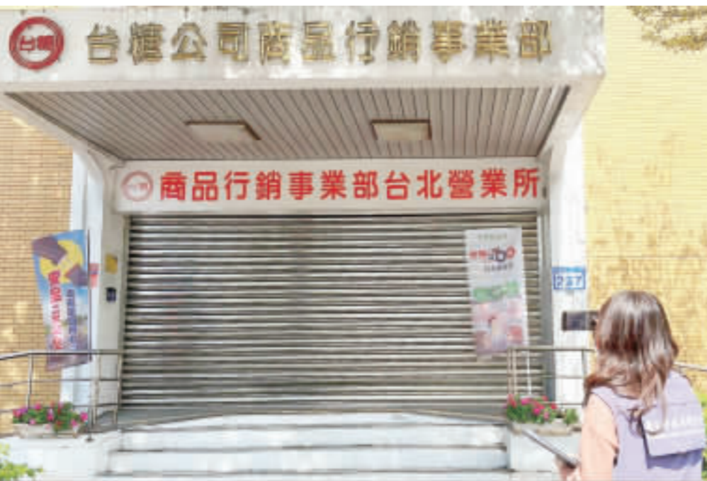
國產台糖安心豚梅花肉片日前檢出瘦肉精西布特羅數值超標。(圖·台北市衛生局提供/文·中央社)

【中央社記者沈佩瑤台北3日電】近10年來首起國產梅花肉片檢出瘦肉精案受關注，食藥署今天說，共2,730包、819公斤全數銷毀台糖健康易購網、億客成生鮮超市、全聯福利中心等，南部流通為主，實際流向待追。