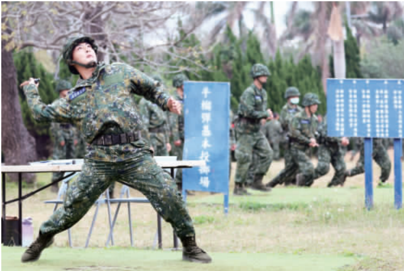
▲首梯一年期義務役1月入伍，總統蔡英文6日前往新竹視導陸軍206旅新兵營舍環境和訓練情況，並觀看護身術、擒拿術、立技，以及投擲手榴彈訓練等課程。

【中央社記者游凱翔新竹6日電】首梯一年期義務役新訓實況，肯定課程安排與訓練品質；蔡總統強調，守護國家安全，需要每一個人的力量，國防部要落實各項訓練，滾動檢討，確保品質及成效。 首梯一年期義務役男（陸軍206旅）共670名官兵，1月25日分別在北部206旅（新竹關西營區）、中部302旅（台中成功營區）、南部203旅（台南官田營區）入營，接受為期8週新兵入伍訓練。 蔡總統今天前往206旅視導一年期義務役新訓實況，並觀看護身術、擒拿術、立技，以及投擲手榴彈訓練等課程，國安會秘書長顧立雄、國防部部長嚴德勝、國防部副部長李喜嶽、國防部發言人李奇嶽等陪同。 蔡總統離開206旅時，向採訪媒體揮手比「讚」，對訓練課程與成效表示滿意。 蔡總統今天也前往位於楊梅、視導鮮少對外曝光的陸軍206旅（新竹關西營區）及位於新竹湖口營區的陸軍54旅（湖口營區）官兵，視察官兵在農曆春節前夕，特別來賓到第三作戰區（六軍區），代表民衆感謝國軍弟兄姊妹的努力和付出。 守護國家安全，需要每個人的力量，為持續強化全民國防體系，國軍今年起恢復一年期義務役，首批新兵已經在上個月入伍；她除前往了解北部地區防空部隊裝備現況，也到陸軍206旅步4營關心首梯一年期義務役新兵營舍環境、訓練情況。 蔡總統指出，國防部要落實執行各項訓練課程，並滾動檢討，確保訓練品質及成效，她期許國軍弟兄姊妹持續訓練，精進自我，陸軍54旅旅長1營反甲排，去年天馬操演獲「全軍第一」殊榮，對個人或部隊都是一大肯定。 蔡總統並提到，陸軍54旅「迅雷踏拳社」，3年多前首次組隊參加新竹縣縣長盃跆拳道錦標賽就全軍獲獎，部隊也有弟兄姊妹積極考取專業證照以及進修學位。 總統鼓勵國軍弟兄姊妹持續提升個人的學識和技能，讓軍旅生涯更豐富，也能在崗位上發揮各項專業，她感謝大家堅守崗位，讓民衆能過好年；休假的弟兄姊妹也要多陪伴家人、注意自身安全，並祝大家新年快樂。