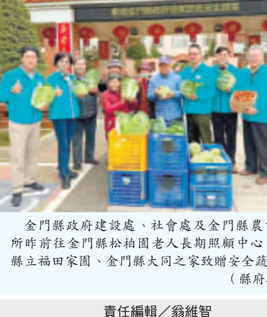
金門縣政府建設處、社會處及金門縣農試所昨日前往金門縣松柏園老人長期照顧中心、金門縣立福田家園、金門縣大同之家致贈安全蔬菜