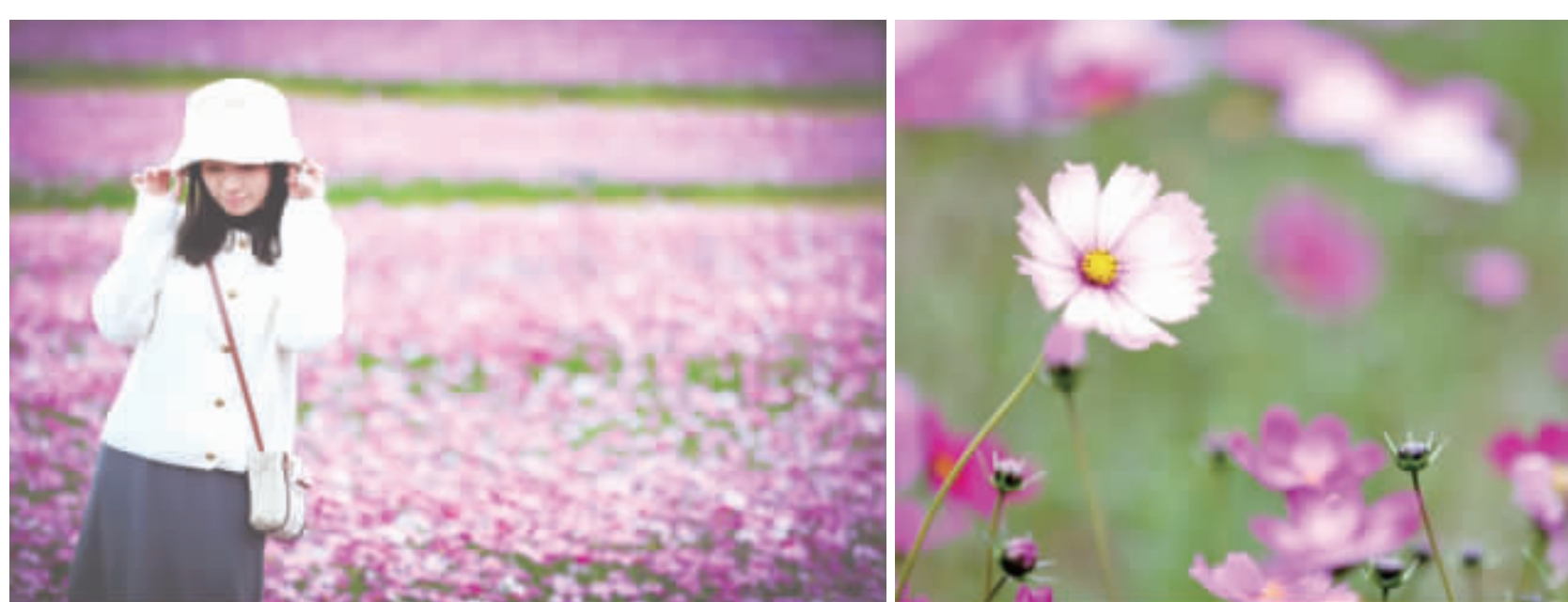
春節將至，農試所波斯菊花海已經滿滿盛開，吸引遊客到場。

記者陳冠霖/綜合報導 春節將至，農試所往年都會在這個時候種植一大片波斯菊花海，如今已經滿地盛開。這片波斯菊花海繽紛綻放，紫色、粉紅色、白色的花朵交織在一起，宛如一幅色彩斑斕的畫卷展現在眼前。在微風吹拂下，花海波動著，彷彿在向遊客們展示著她的優美舞姿，已經吸引許多遊客到場拍照。