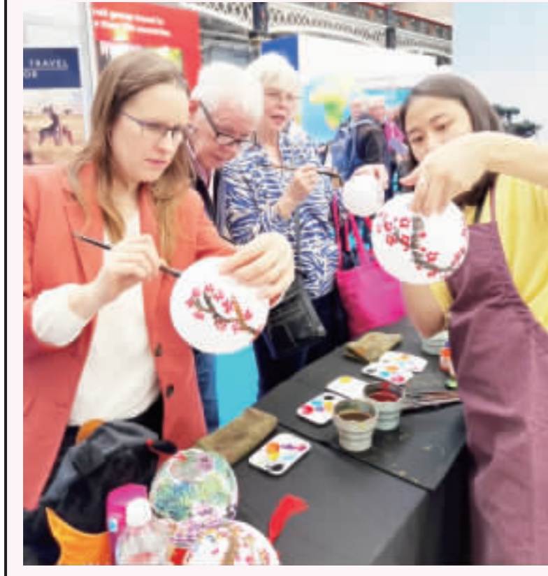
倫敦旅展台灣館燈籠彩繪 台灣館在2023倫敦旅展舉辦燈籠彩繪DIY活動，吸引民衆踴躍參加。

【中央社記者張環台北6日電】財政部關務署統計，2022年海關查獲豬肉及豬肉製品共1402件、2805公斤，由於疫後民衆報復性旅遊，入境旅客攜帶件數增加50件，增加二二倍最多；隨春節將至，關務署再次強調，勿攜帶任何豬肉製品入境，以免遭罰。 根據關務署最新統計，2023年查獲豬肉及豬肉製品共1402件、2805公斤，均呈年增。其中，以入境旅客行李查獲為大宗，達847件、1784公斤，再來是國際郵包查獲465件、362.1公斤，空運快遞70件、133.4公斤，海運快遞20件、30.1公斤。 關務署表示，2023年查獲旅客攜帶豬肉及豬肉製品入境的件數，較2022年的37件，大幅增50件，即增加二二倍。 隨農曆春節將近，年節送禮旺季向來是防堵非洲豬瘟關鍵時刻，面對返鄉人潮及國外包裹高潮，關務署指出，海關將持續加強查緝旅客攜帶未經驗疫的豬肉製品，一旦查獲，將移由農業部動植物防疫檢疫署依法裁處，呼籲民衆勿心存僥倖。 關務署進一步表示，自非洲豬瘟疫區攜帶豬肉製品入境，初次違規處罰新台幣20萬元，再犯則重罰100萬元。 關務署重申，民衆切勿在網路購買國外肉品及其製品寄送至台灣，並提醒海外親友切勿寄送含豬肉的禮品來台，以免受罰；私自進口未經檢疫合格的豬肉製品，依法規定，可處7年以下有期徒刑，得併科300萬元以下罰金。