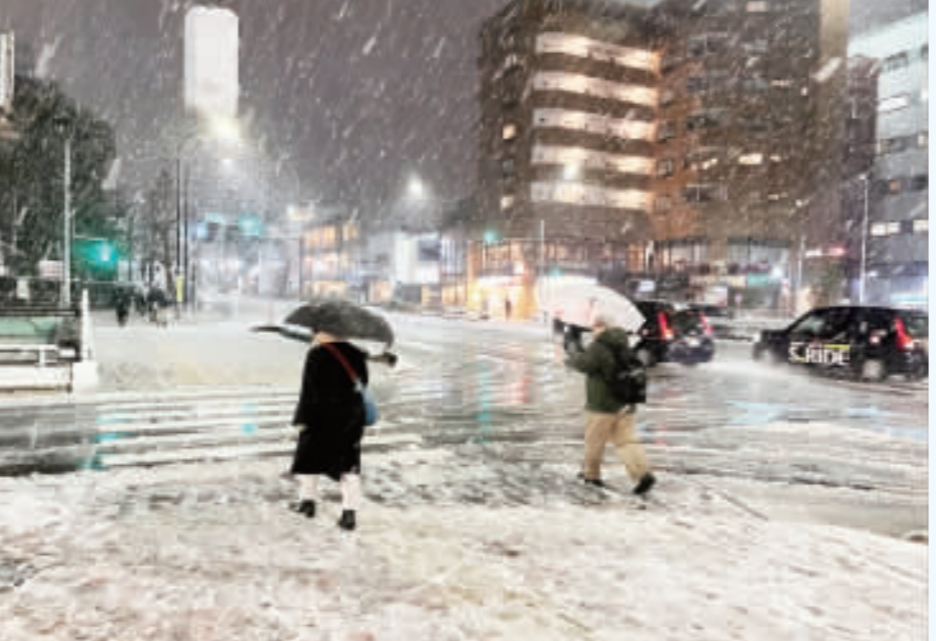
日本東京5日下午開始降下大雪，路上隨處可見積雪、雪泥和冰塊。

【中央社記者戴雅真東京6日專電】日本氣象廳5日對東京發布3公分以上大雪警報，市內多處有3公分以上積雪。台灣許多遊客趁春節假期赴東京旅遊，但許多人可能不熟悉如何雪中行走，最好做法是學企鵝走路小步伐挪動會更加安全。 日媒報導，首都圈降下大雪的高峯期可出現在5日晚間，到6日早晨晨減緩，但交通依舊受到影響。6日白天仍可能出現降雪，但時間較短。推估截至6日傍晚的降雪量，關東山區為40公分，甲信地區30公分，關東平地15公分，東京23區則有8公分。 媒體特別宣導，在雪地上行走最好選擇背包、空出兩手，步伐不要太大，確保每一步確實踩在地上。雖然天氣寒冷，但雙手插在口袋裡，或是拿著手機邊走邊看都 非常危險，最好是兩手都空出來，以防萬一。 如果手插口袋，滑倒時沒辦法即時應變，很可能會受重傷。也建議穿厚一點，不僅能夠保暖，若摔倒還能起到緩衝作用。最好選擇防水材質衣服，即使濕了也不容易著涼。 人行天橋等地方由於不熱且地面難傳導，即使結冰也很難融化，因此下雪後走天橋要特別留意。此外，像是民衆上公車或搭計程車的地方，由於積雪被反覆踐踏和車輪碾過壓實，這些地方反而很滑。還有建築物出入口，由於鞋子上的雪通常會被蹭在出入口，都要特別注意。 根據東京消防廳，受降雪與道路結冰影響，截至5日晚間9時，有40人在路上滑倒，緊急送往醫院，所幸沒有人受重傷。受傷者年齡最小4歲，最高92歲，幼童與長者者在積雪道路上行走要特別注意。 東京2年前也曾降下大雪，當時積雪厚達10公分。不過相較降雪當天，路滑摔倒送醫人數在降雪兩天更多，因此即使降雪高峰已過，民衆仍不能掉以輕心。 2019年1月6日，關東地區南岸低氣壓影響降下大雪，東京都心積雪厚達10公分。到了隔天，天氣完全好轉，但經過一夜低溫，路上仍有許多積雪。根據統計，6日當天有112人因為滑倒送醫，但7日卻爆增至361人，是3倍以上。 這次降雪可能持續一整夜，因此推斷6日早上的道路情況會相當糟糕，到處都是積雪、雪泥和冰塊，行走時必須特別留心。