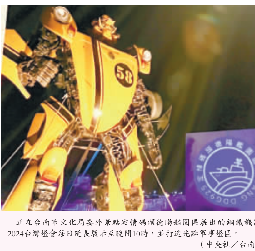
正在台南市文化局委外景點定情碼頭德陽艦園區展出的鋼鐵機器人特展，配合2024台灣燈會每日延長展示至晚間10時，並打造光點軍事燈區。

【中央社記者楊思瑞台南12日電】響應2024台灣燈會在台南，正在台南市文化局委外景點「定情碼頭德陽艦園區」展出的鋼鐵機器人特展，每日延長展示至晚間10時，並打造光點軍事燈區，增添燈會景緻。 台南市政府文化局今天新聞稿指出，「艦燈奇蹟」鋼鐵機器人「創作特展2023年首次在定情碼頭德陽艦園區展出，吸引大批民眾參觀，此次為迎接台南400、園區營運單位特別規劃「艦燈奇蹟II-鋼鐵機器人」創作特展。 台南市文化局指出，此次特展是由一群酷愛運用廢棄鐵件及大型機械進行創作的泰國藝術家，以電影「變形金剛」為原型發想出一系列鋼鐵角色，設計師利用汽車引擎、汽缸作為身體軀幹，再搭載發動機渦輪設計成四肢。 最後利用分屬不同機具零組件，構建成鋼鐵機器人。 文化局指出，堪稱集工藝與藝術一身的精湛作品，將德陽艦化身酷炫電影場景，並於軍艦甲板上以各種造型鋼鐵機器人，引領每名登艦遊客熱氣沸騰，2月3日至3月10日台灣燈會期間，特別延長展示至晚間10時，並打造光點軍事燈區，遊客可把握機會觀展。 文化局指出，德陽艦原為美軍基靈級驅逐艦，1971年由美國移交海軍，在台服役長達28年，曾為國執行海峽偵巡、外島運補護航、護漁及各項演訓等多重任務，2009年正式除役，2009年由高雄左營軍港拖移至安平港安置進行修復工程，現已成為全國首座除役軍艦再利用為博物館景點。