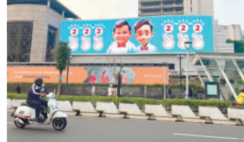
雅加達街頭的競選廣告 印尼14日舉行大選，許多候選人發布貼近年輕人的競選短片，圖為雅加達街頭的總統候選人普拉博沃和其副手吉伯朗的卡通版競選廣告。

【中央社記者楊思瑞台南12日電】響應2024台灣燈會在台南，正在台南市文化局委外景點「定情碼頭德陽艦園區」展出的鋼鐵機器人特展，每日延長展示至晚間10時，並打造光點軍事燈區，增添燈會景緻。 台南市政府文化局今天新聞稿指出，「艦燈奇蹟」鋼鐵機器人「創作特展2023年首次在定情碼頭德陽艦園區展出，吸引大批民眾參觀，此次為迎接台南400、園區營運單位特別規劃「艦燈奇蹟II-鋼鐵機器人」創作特展。 台南市文化局指出，此次特展是由一群酷愛運用廢棄鐵件及大型機械進行創作的泰國藝術家，以電影「變形金剛」為原型發想出一系列鋼鐵角色，設計師利用汽車引擎、汽缸作為身體軀幹，再搭載發動機渦輪設計成四肢。 最後利用分屬不同機具零組件，構建成鋼鐵機器人。 文化局指出，堪稱集工藝與藝術一身的精湛作品，將德陽艦化身酷炫電影場景，並於軍艦甲板上以各種造型鋼鐵機器人，引領每名登艦遊客熱氣沸騰，2月3日至3月10日台灣燈會期間，特別延長展示至晚間10時，並打造光點軍事燈區，遊客可把握機會觀展。 文化局指出，德陽艦原為美軍基靈級驅逐艦，1971年由美國移交海軍，在台服役長達28年，曾為國執行海峽偵巡、外島運補護航、護漁及各項演訓等多重任務，2009年正式除役，2009年由高雄左營軍港拖移至安平港安置進行修復工程，現已成為全國首座除役軍艦再利用為博物館景點。