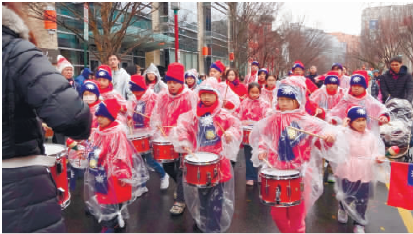
▲華府中國城舉行春節遊行，孩童們披上國旗圍巾，敲鑼打鼓迎龍年。

【中央社華盛頓11日電】華府華埠今天舉行春節遊行，熱鬧歡迎龍年到來。駐美代表俞大鴻表示，在美國政府與人民的堅定支持下，台美堅若磐石的關係將在龍年持續快速發展。 華府農曆春節遊行今天在華府中國城登場。華府市長鮑賽（Munir Bawaz）與俞大鴻領銜，帶領遊行隊伍，在綿綿細雨中迎接龍年到來。 去年12月上任的俞大鴻第一次參加華埠春節遊行，屬龍的他以中英文向現場民眾祝賀新年快樂，「好運龍來」。他在致詞中表示，