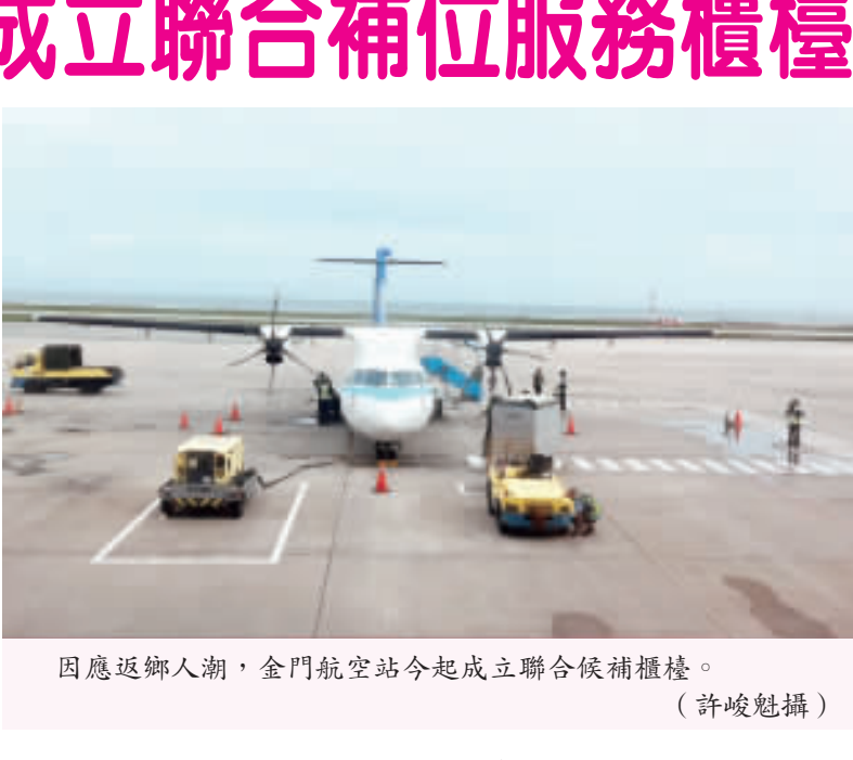
因應返鄉人潮，金門航空站今起成立聯合候補櫃檯。

記者許峻魁／綜合報導 農曆年開始，再過幾日返鄉過年的民眾也將回到工作崗位，金門航空站為紓解春節期間返鄉旅客人潮，將從今日（13）日上午六時三十分起至十五日為止，為期三天成立「聯合補位服務櫃檯」，以提供旅客迅速便捷之補位資訊服務，達到公平公正公開之原則，減少無謂紛爭並維護機場秩序，同時協助臨時加班機以加速疏運旅客，讓每位鄉親都可以安心迅速返回工作崗位。 金門航空站表示，春節聯合補位即時補位資訊（含臨時加班機資訊）諮詢專線為（082）22381、（082）313694，旅客也能透過地區有線電視第3台收看候機叫號狀況及臨時加班機資訊跑馬燈，或利用手機及電腦上網查詢即時補位查詢網站（或可上航站官網查詢進入）： http://standby.kma.gov.tw 。此外，金門航空站於一〇六年七月正式啟用「線上會員候補系統」，已成為會員註冊的旅客，可透過電腦網路、手機APP、QR Code等管道，在家也可以輕鬆候補登記候補，免後續號碼依序遞補。