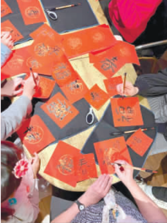
▲羅馬僑界寫春聯說吉祥話。

▲羅馬僑界寫春聯說吉祥話 【中央社台北12日電】羅馬中文學校10日合辦春節餐會，近五百位僑胞、留學生和義大利來賓出席，讓旅義的僑胞和學生感受團圓幸福與家鄉溫暖，現場有寫春聯、說吉祥話、猜謎等春節文化活動。 駐義大利代表蔡允中致詞時感謝羅馬同鄉會等策劃新年餐會，說明龍年象徵「充滿朝氣及活力」，祝願與僑胞在新的一年吉祥如意、闔家歡樂、平安順遂。 這次「龍年吉祥」春節活動設置許多攤位，包括書法寫春聯、馬馬台灣同鄉會紀念品義賣及古早味遊戲區等，讓參與者感受台灣民俗風情和節慶氣氛。 10日是龍年正月初一，羅馬中文學校安排放歌新年快樂歌、說吉祥話、猜謎遊戲，以及享用新年美食，如水餃（元寶）、年糕（步步高升）與蘿蔔糕（好彩頭），將傳統春節文化傳給僑界二代。 在書籤與春聯書法活動中，可見創意，首次拿毛筆的義大利學子對書法運筆驚嘆不已，為新年增添藝術氛圍。僑校老師介紹歷歲錢的意涵及習俗，駐義代表也發給兒童龍年紅包，收到的小孩很開心，用中文說出龍年新春祝福的吉祥話，場面溫馨有意義。