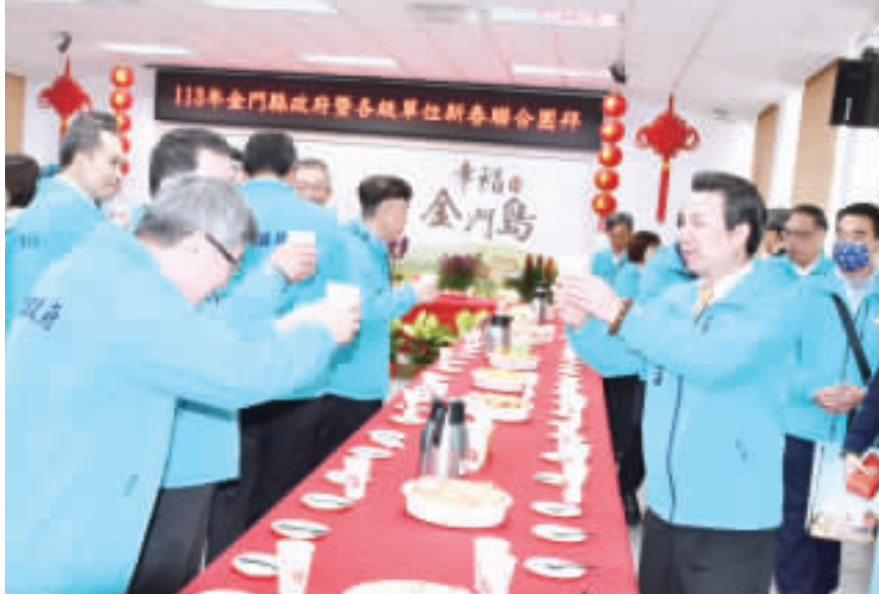
上左、下左：金門縣長陳福海昨主持縣府暨各級單位一一三三新春聯合團拜活動；上右、縣長陳福海發福袋及祝福；下右、縣長陳福海舉杯與縣府同仁互祝新年快樂。