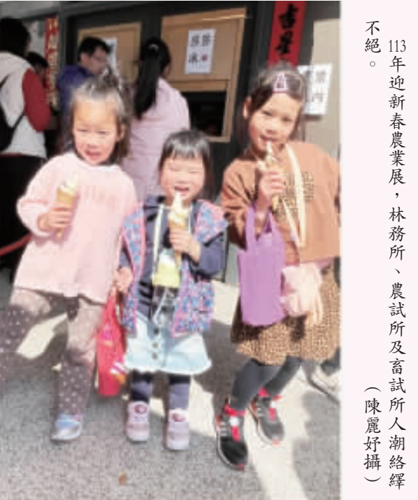
113年迎新春農業展，林務所、農試所及畜試所人潮絡繹不絕。

記者陳麗好／金沙報導 金門縣政府每年都會辦理迎新春農業展，而今年活動期間天公做美，林務所、農試所及畜試所人氣強強滾，民眾絡繹不絕，不論是青草地冰乳品品嚐、充氣龍龍競賽、烤肉煙燻及園遊券等皆大受歡迎。系列活動告一段落，後續各所園內之應景春節佈置仍歡迎鄉親遊覽迎新年。 春節是地區傳統節慶，家家戶戶慶團圓，旅外遊子、學子返鄉(家)過年。逢農曆生肖龍年，林務所、農試所、畜試所分別以「幸福龍媽家」、「龍歡喜」、「龍農年味過佳節」爲主題規劃迎新春農業展活動，讓民眾、遊客能於春節期間闔家或三五好友攜手同遊走春迎新年。 其中，林務所除了有酒香藝文大道、公益無敵小火車、旋轉櫻花樹，以及所內橡果遊具，應景恐龍紙箱、紙滑梯等，宛如兒童樂園；而充氣恐龍競賽讓大人小孩爭相排隊參與。林務所特別於每日活動結束前致贈風信子、鬱金香、金盞花等盆栽，同樣大排長龍。爲期三日活動圓滿落幕，林務所初估約有2萬人次到訪，後續森林公園內酒香藝文大道、橡果遊具、木育館以及植物園區仍對外開放，歡迎鄉親前往參觀。 而農試所於迎新春農業展期間推出園家烤肉煙燻、觀光採果摘菜、親子DIY體驗、悠遊風光自行車賞花遊園、農業展覽館參觀、免費磨麥體驗等，讓鄉親在傳統的體驗中共度新年。其中，