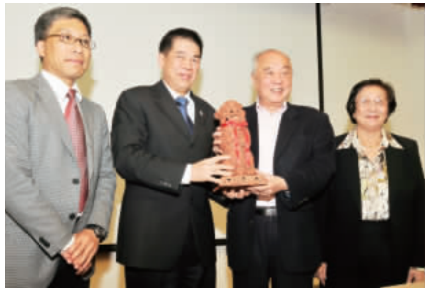
旅星僑領黃祖耀(右二)偕夫人於113年走訪金大，受到校方的熱烈歡迎。

新加坡金門會館永久榮譽主席、世界知名銀行家黃祖耀於本月三日凌晨以95歲高齡安詳辭世，帶著在國際金融界叱咤風雲一生，精彩打拚的斐然成果溘然謝幕。但他縱橫捭闔的勁拔身影，仍將是金門鄉親和海外百萬僑親崇拜的標竿。 1937年中日戰爭爆發，日軍即將佔領廈門的風雨飄搖時刻，年僅7歲的黃祖耀隨著母親離鄉南渡馬來亞沙撈越與父親團圓，隨後再徙居新加坡，從進入家族事業土產貿易做起，靠著個人的努力奮進，逐漸