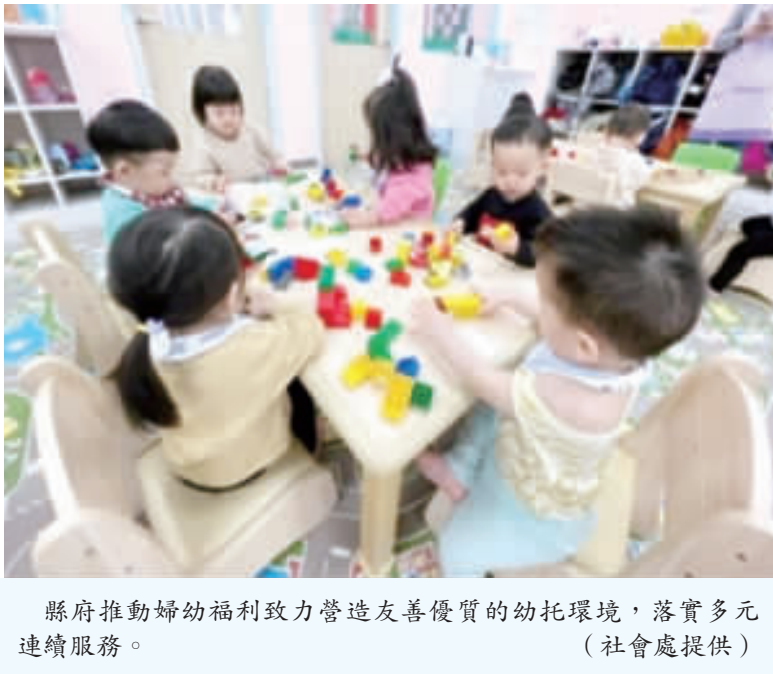
縣府推動幼托福利致力營造友善優質的幼托環境，落實多元連續服務。