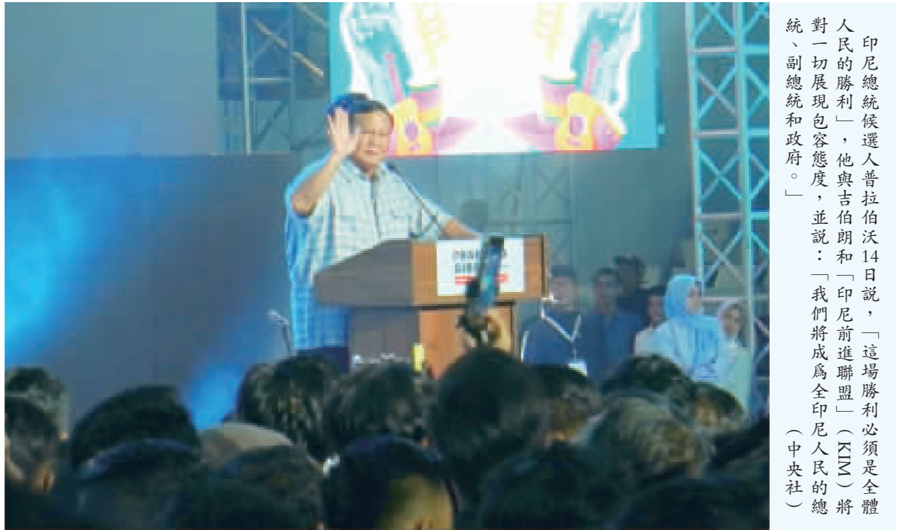
印尼總統候選人普拉伯沃14日說，「這場勝利必須是全體人民的勝利」，他與吉伯朗和「印尼前進聯盟」(PKU)將對一切展現包容態度，並說：「我們將成為全印尼人民的總統、副總統和政府。」(中央社)

投票站，在和平氣氛中進行2024年大選。普拉伯沃表示：「民調機構的快速計票結果顯示，我與吉伯朗在首輪投票中獲勝，其中也包括了我們競爭對手的民調機構。」但他強調，他們對這次快速計票結果表示感恩，但絕不能傲慢或欣喜若狂，仍必須保持謙虛。普拉伯沃指出，這場勝利必須是全體人民的勝利，他與吉伯朗和「印尼前進聯盟」(PKU)將對一切展現包容態度，並說：「我們將成為全印尼人民的總統、副總統和政府。」