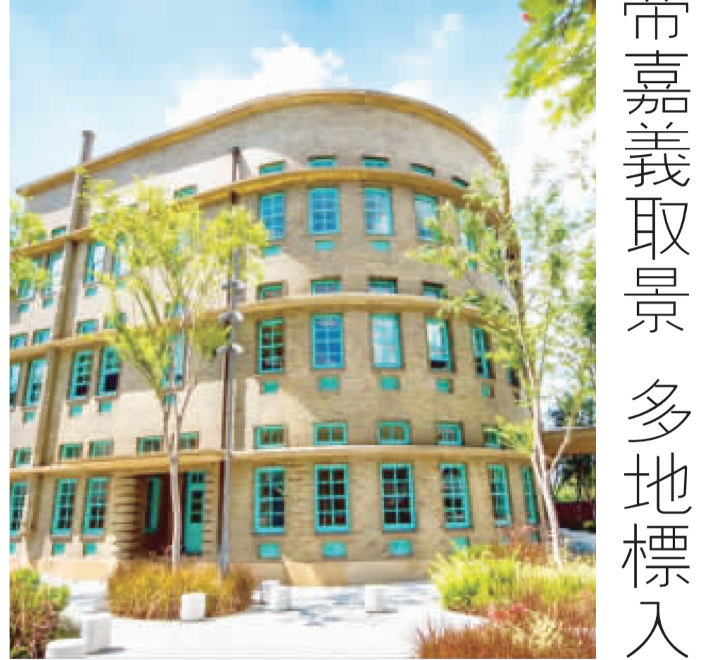
電影「車頂上的玄天上帝」主要在嘉義市取景，圖為場景之一嘉義市立美術館，自2020年開幕以來，一直是遊客必訪打卡熱點。

電影「車頂上的玄天上帝」在嘉義市取景，運用了嘉義公園、東市場、嘉義城隍廟、市立美術館與中央噴水池等地標。如果春節無暇返鄉的嘉義游子，可從電影中回味嘉義美食。嘉義市政府表示，「車頂上的玄天上帝」描述嘉義家族故事，35場景在嘉義市拍攝。此外，電影與超過10家品牌聯名合作，有新台灣餅舖百年羊羹、嘉義林聰明沙鍋魚頭、昭和11咖啡館及嘉義市史蹟資料館等。