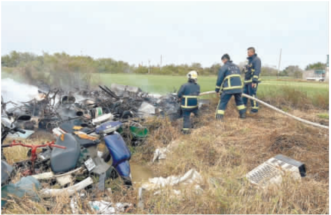
金沙鎮一處農莊外昨發生火警，五十餘輛機車被燒毀，所幸無人傷亡情事。

記者楊水冰／綜合報導 金沙鎮一處農莊外昨日發生火警，大量黑煙冒出，且靠近民宅，金沙分隊人員抵達火災現場搶救，計五十餘輛機車被燒毀，所幸並未波及附近民宅及無人傷亡情事，詳細起火原因及財物損失由火調人員進行調查。 這起機車火警發生於昨天中午十二時許，因位置鄰近民宅，又冒出大量黑煙，現場情況危急，金沙分隊人員抵達現場後，發現住宅旁空地停放約五十餘部機車起火，立即佈置二條水線周界防護防止延燒至民宅，並以大量水源搶救，火勢於十二時十五分控制，在十二時三十分撲滅火勢。