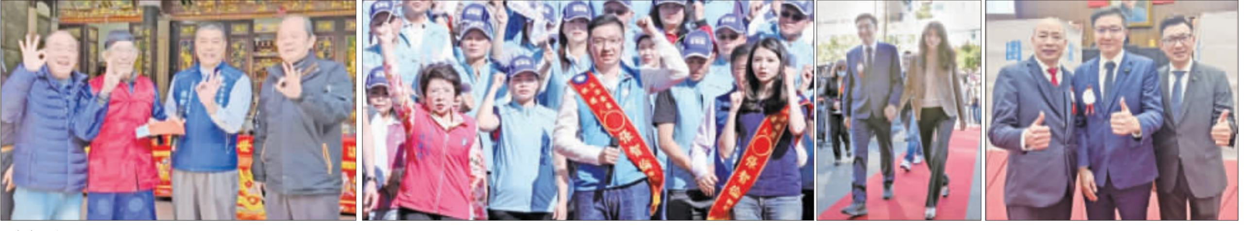
由左至右： 1、中間穿藍色背心為前立委張慶忠先生，他在去年冬至青嶼張家祭祖時與宗長們的合影。 2、張智倫初選參選初期的團隊合照。(中間穿藍色衣服為張智倫委員) 3、今年二月一日新任立委上任，張智倫牽著妻子的手一起進入立法院。 4、張智倫立委與韓國瑜院長及江啓臣副院長一起合影。