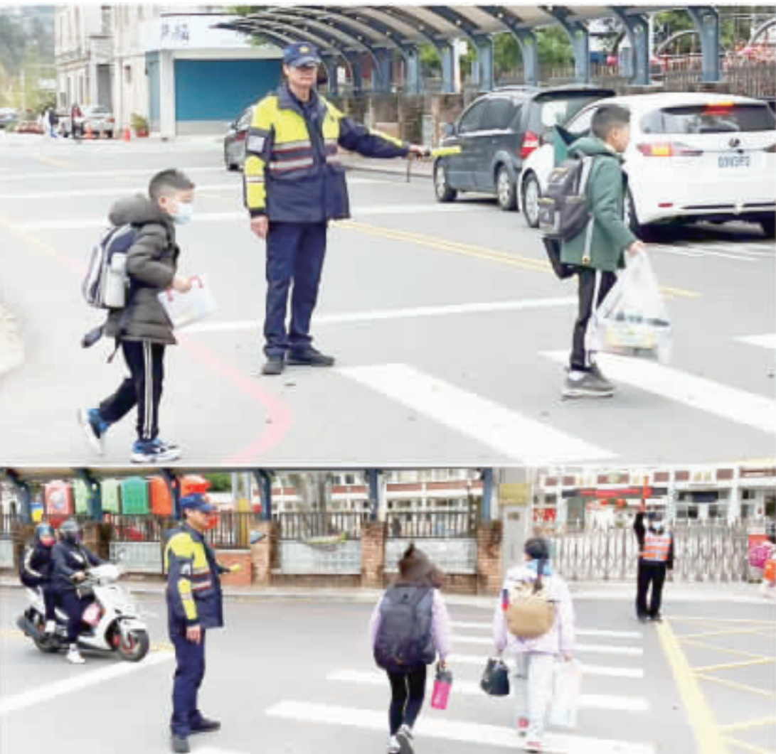
開學首日，縣警局同步啟動「護童專案」勤務，在轄區內交通流量較大之幼兒園、國小等處所上學時段加強交通安全維護。

記者莊煥寧／綜合報導 昨(16)日為各國中、國小開學首日，縣警局為落實縣長陳福海全面加強學生交通安全之指示，同步啟動「護童專案」勤務，在轄區內交通流量較大之幼兒園、國小等處所上學時段，編排警力加強交通安全維護，並針對學校附近加強巡邏、守望，及對於落單的學童，適時暖心提供協助與導引，溫馨柔性保護學童交通安全工作，獲得師生及家長稱讚。 配合學校開學日，縣警局規劃「護童專案」，昨日上午編排警力在轄區內交通流量較大之金城幼兒園、中正國小、金湖國小、金寧中小學、金沙國小、金鼎國小等處所學童上學時段，加強交通安全維護，保護學童安全。縣警局指出，在加強校園周邊交通疏導，維護學童安全執行「護童專案」勤務中，較常見危險狀況有：一、新入學低年級學童穿馬路緩慢步行或慌張的進退退；二、未能等待紅綠燈而任意穿越馬路，造成獨自站立於路中不知所措；三、護學生上下學安全。