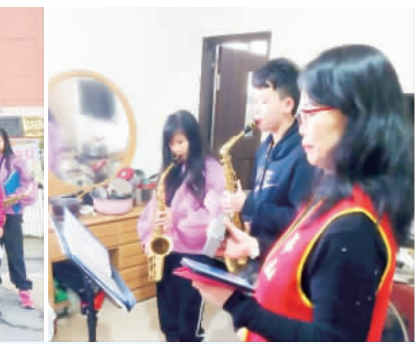
胡建基金會與金門高中行義童軍團共同舉辦「探索金門童軍育樂成長營」。

記者高凡洋／綜合報導 胡建基金會與金門高中行義童軍團共同舉辦的「探索金門童軍育樂成長營」活動於陽明二營區正式展開。為期三天的營隊吸引了來自金門各地的39位童軍參加，希望透過精彩活動，培養孩子們的領導才能與團隊合作精神，為金門地區的童軍帶來一場難忘的成長之旅。 此次活動開放金門地區的國、高中生報名，讓孩子們在寒假能多一項選擇，藉由這個機會跳脫3C產品，和同齡的孩子們一起在大自然中互動，感受周遭環境 胡建基金會與金門高中行義童軍團共同舉辦的「探索金門童軍育樂成長營」活動於陽明二營區正式展開。為期三天的營隊吸引了來自金門各地的39位童軍參加，希望透過精彩活動，培養孩子們的領導才能與團隊合作精神，為金門地區的童軍帶來一場難忘的成長之旅。 此次活動開放金門地區的國、高中生報名，讓孩子們在寒假能多一項選擇，藉由這個機會跳脫3C產品，和同齡的孩子們一起在大自然中互動，感受周遭環境