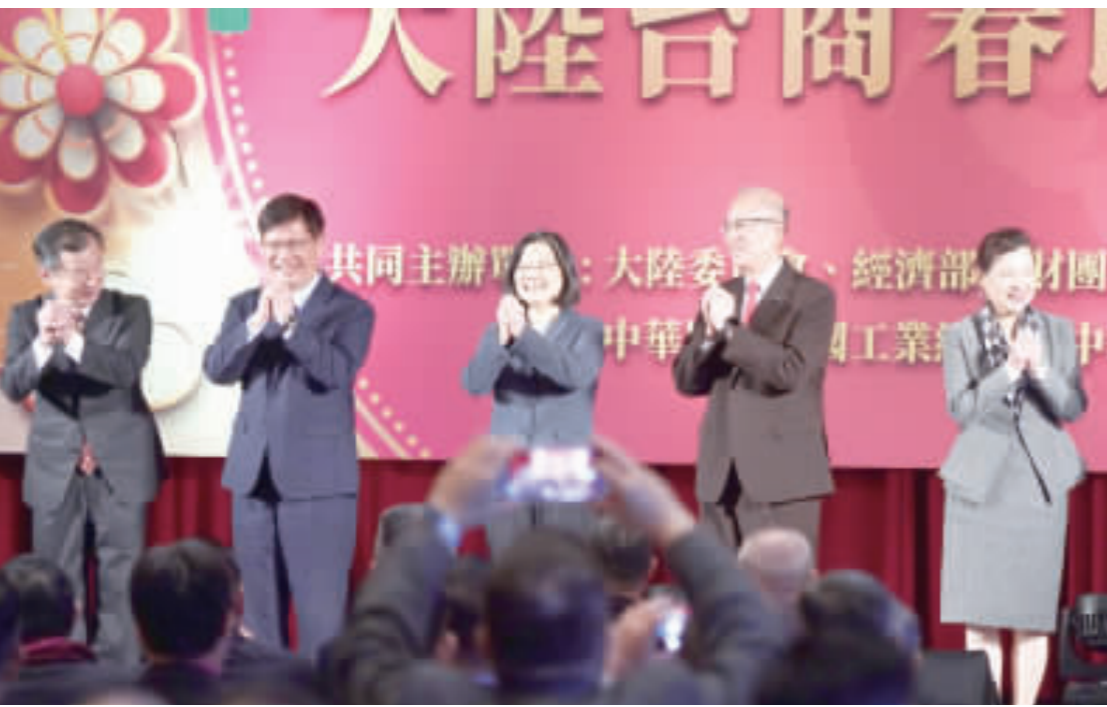
總統蔡英文與總統府秘書長林佳龍、陸委會主委邱太三、海基會董事長李大維、經濟部部長王美花等人出席「2024大陸台商春節活動」。

【中央社台北十七日電】總統蔡英文今天表示，在對等尊嚴的前提下，「我們從未停下腳步」，持續地尋求兩岸對話的可能。她指出，兩岸關係的改善，是建立在互信、互諒、互利的基礎上，而對話是建立互信、互諒、互利的唯一途徑。 蔡總統在致詞時指出，台灣一直是台灣經濟發展的關鍵力量，也是兩岸共同責任的承擔者。她呼籲兩岸雙方在對話中尋求共識，共同推動兩岸關係的和平發展。