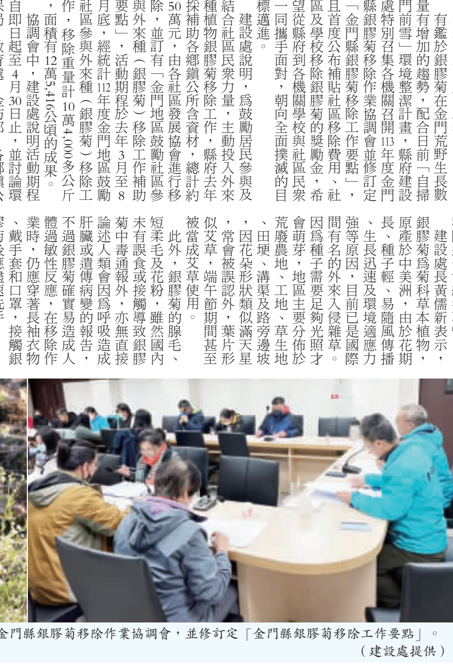
右、建設處召開113年度金門縣銀膠菊清除作業協調會，並修訂「金門縣銀膠菊清除工作要點」。左、銀膠菊植株開花。