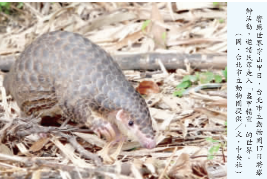
響應世界穿山甲日，台北市立動物園17日將舉辦活動，邀請民眾走入「瀕危」的世界。(文·中央社)

【中央社台北十七日電】明天是世界穿山甲日，台北市立動物園將與國際共同響應，舉辦教育、抽獎活動，並由保育員、獸醫師及專家開講，盼喚起社會對這個瀕危物種的關注。 世界穿山甲日訂在每年2月的第3個週六，台北市立動物園將在明天下午1時至4時舉辦「翻轉瀕危！Save the Pangolin」活動，邀請民眾一同走入「瀕危」的世界，認識穿山甲並理解牠們的困境。