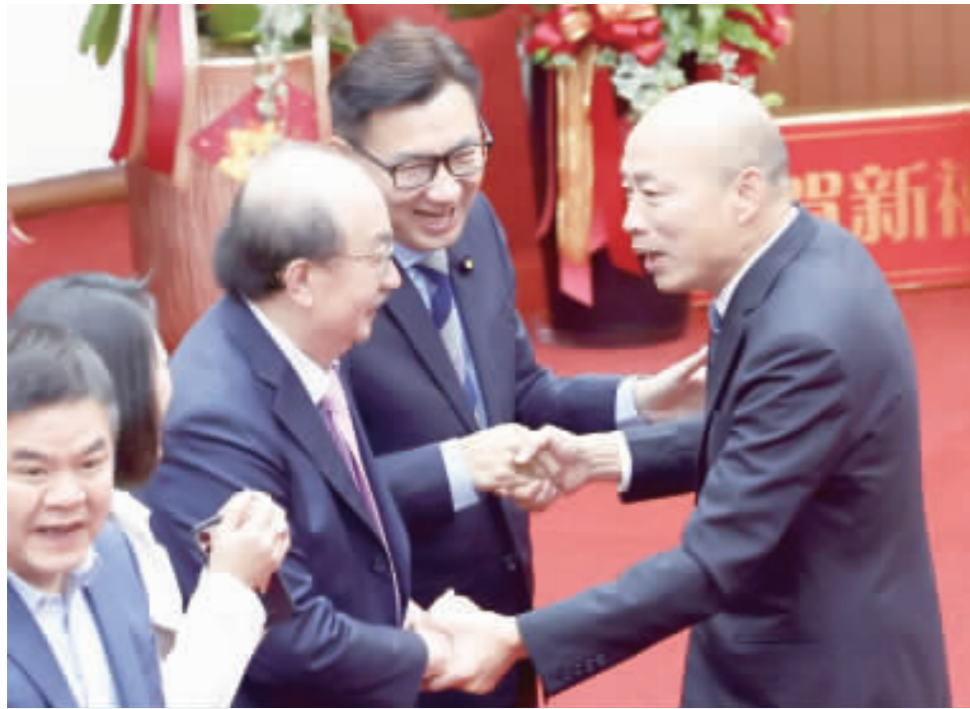
立法院長韓國瑜(右)19日出席立法院113年新春團拜，圖為韓國瑜與立法院副院長江啓臣(右2)、民進黨立法院黨團總召柯建銘(右3)握手致意。

【中央社記者范正祥台北19日電】立法院今天舉行新春團拜，立法院長韓國瑜致詞時表示，立法院是國家的火車頭，不僅要為引導國家動力，同時也要引導國家迎向更美好的未來。 立法院上午舉行新春團拜，韓國瑜與朝野黨團幹部、立委及立法院各單位職員，互相祝賀新年快樂。 韓國瑜致詞時表示，第一次以立法院院長身分參加立法院新春團拜，感到非常開心，他日前趁著農曆春節期間走訪弱勢團體和族群，多年來和許多立委一樣秉持這樣的信念，關心社會各角落比較辛苦的民眾。 他說，新春團拜象徵除舊布新，立下嶄新希望與目標，期盼新一屆的立法院所有工作順利展開。