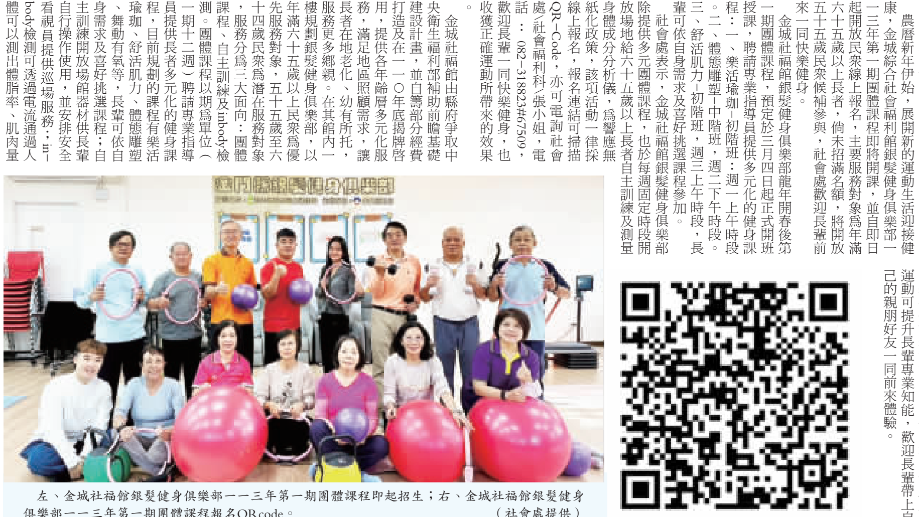
左、金城社福館銀髮健身俱樂部一三年第一期團體課程即起招生；右、金城社福館銀髮健身俱樂部一三年第一期團體課程報名QRcode。