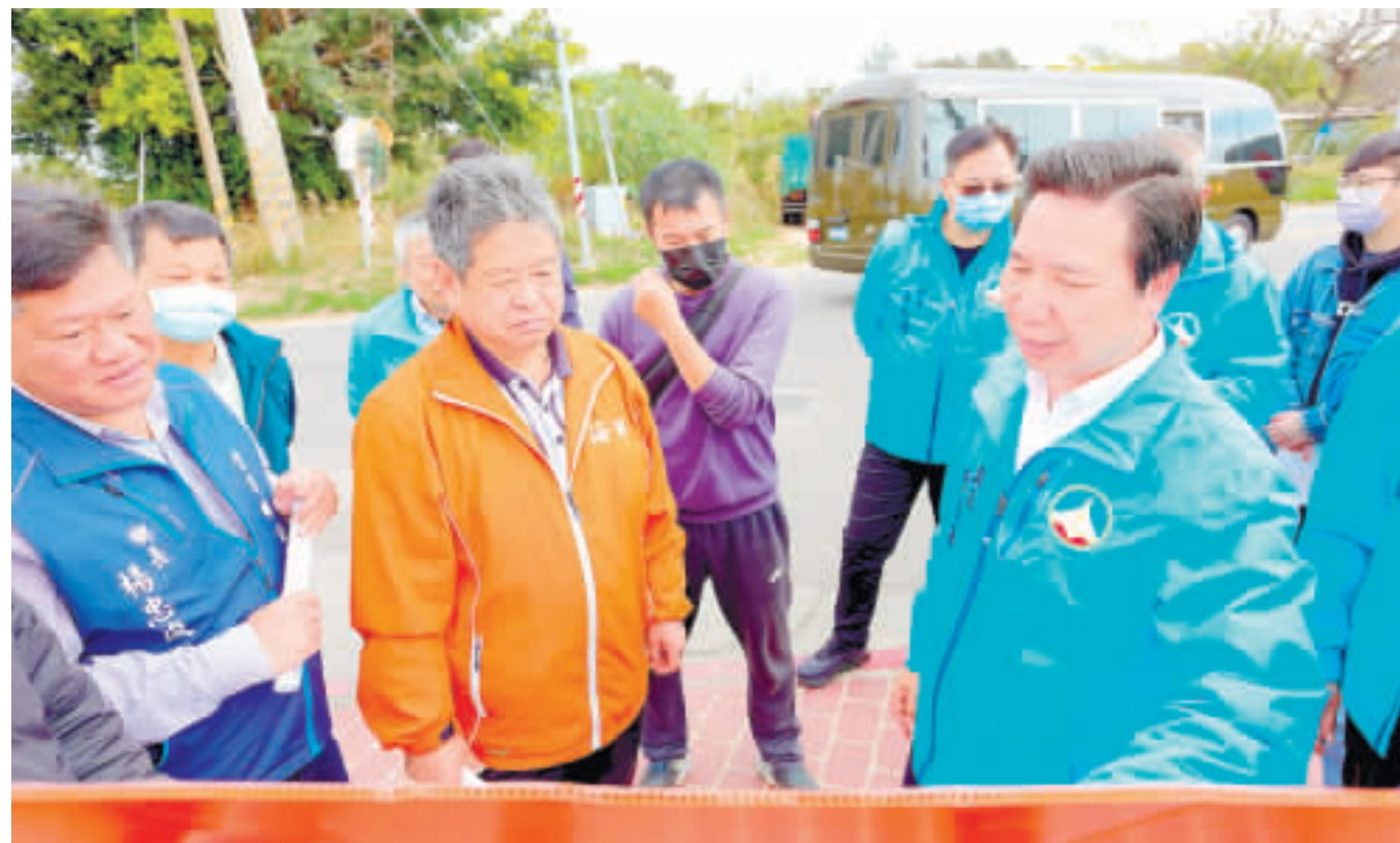
縣長陳福海昨日會同金寧鄉長楊忠俊等人會勘瓊安路道路改善工程。

縣府工務處表示，為因應金門大橋開通後路網之暢通性及加強金門東西半島之銜接，縣府及金寧鄉公所規劃瓊安路拓寬工程(第一期)一安岐聚落至瓊口聚落拓寬工程，工程經由金寧鄉公所完成規劃設計。 縣長陳福海表示，規劃設計團隊要做好道路工程之整體規劃，除著重於道路安全及品質外，路口的人文環境也需要更著墨用心，並指示工務處及鄉公所與林務所合作進行道路植栽綠美化及周邊延伸景觀設計等重點，另對於鄰近聚落整地規劃也要傾聽審視民眾需求，作好相關資源盤整及與地方溝通協調。