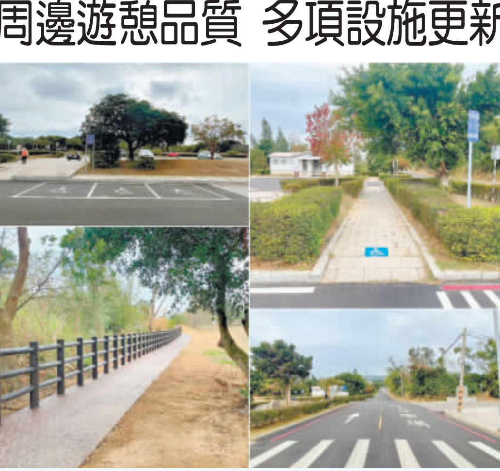
左上、停車場鋪面更新及無障礙機車格劃設；左下、停車場聯外步道更新；右上、步道增設無障礙標誌；右下、鄰近道路鋪面更新。

記者高凡洋/綜合報導 內政部國家公園署金門國家公園管理處為提升榕園周邊遊憩品質，已完成鋪面(鄰近道路、停車場、園區)更新、無障礙設施改善及停車場聯外步道更新，讓遊客體驗自停車場到榕園內展館或大湖更舒適、便捷的行走空間。