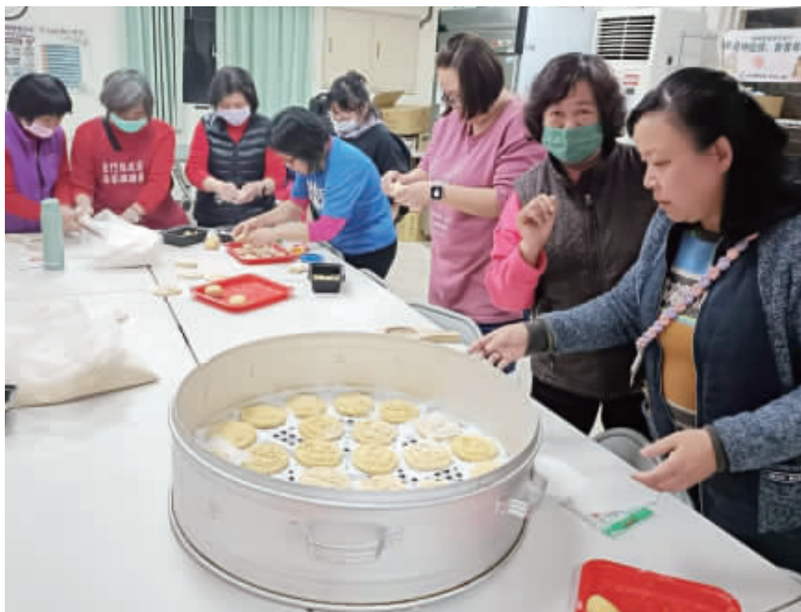
左、右：金門縣長照服務關懷協會私立仁愛居服員參與金沙鎮斗門社區的風獅爺紅龜粿體驗活動，享受傳統糕點的文化體驗。