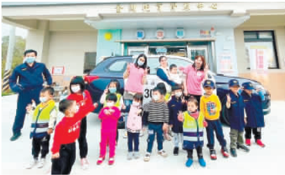
金湖托育資源中心「醫遊館親子參與小警察玩遊戲素養課程活動。」