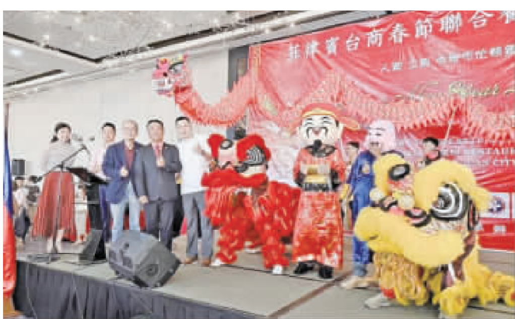
新春聯歡晚宴，現場邀請舞龍醒獅鼓樂歡騰熱鬧滾滾。