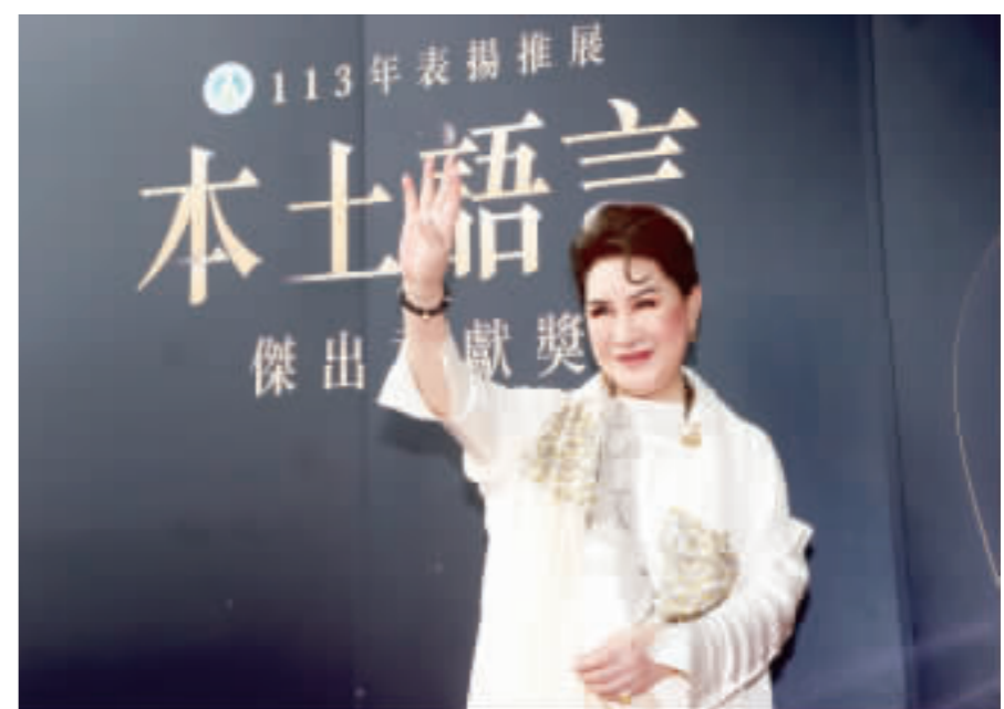
楊麗花獲本土語言終身奉獻獎。教育部113年表揚推展本土語言傑出貢獻獎頒獎典禮21日在台大醫學院國際會議中心舉行，歌仔戲大師楊麗花獲終身奉獻獎肯定。

【中央社記者張雄風台北21日電】氣象署今天表示，明天東北季風增強，雙北局部地區因深坑大火造成的異味可望緩解；明天北部高溫降至攝氏22度，低溫約15、16度；26日又一波冷空氣增強，北部高溫15、16度，低溫約11度。 中央氣象署預報員黃恩鴻告訴中央社記者，明天鋒面通過，接著東北季風增強，北台灣南部地區及恆春半島有局部短暫陣雨；23至25日水氣減少，基隆北海岸、東半部地區及恆春半島有局部短暫雨，桃園以北地區則是零星短暫雨。 氣溫方面，黃恩鴻指出，明天北台灣高溫降至22度左右，低溫約15、16度；26日低溫約15、16度，23至25日北台灣低溫變化不大，23日高溫約18度，24、25日略回升至20、21度。 黃恩鴻表示，26日起東北季風再增強或大陸冷氣團南下，27日影響，北部、東部及東部地區，各地降至11到14度，局部可能有不到10度的低溫；預計28日白天空氣減弱，各地清晨偏冷，白天起回溫。 黃恩鴻指出，29日可能仍有另一波冷空氣再增強、影響，但後期溫度變化仍有不確定性，需要再觀察。黃恩鴻提醒，明天馬祖、金門及夜間至清晨北部地區易有局部霧或低雲影響能見度；今晚至明天台南以北、恆春半島、各離島要留意8至9級強陣風。