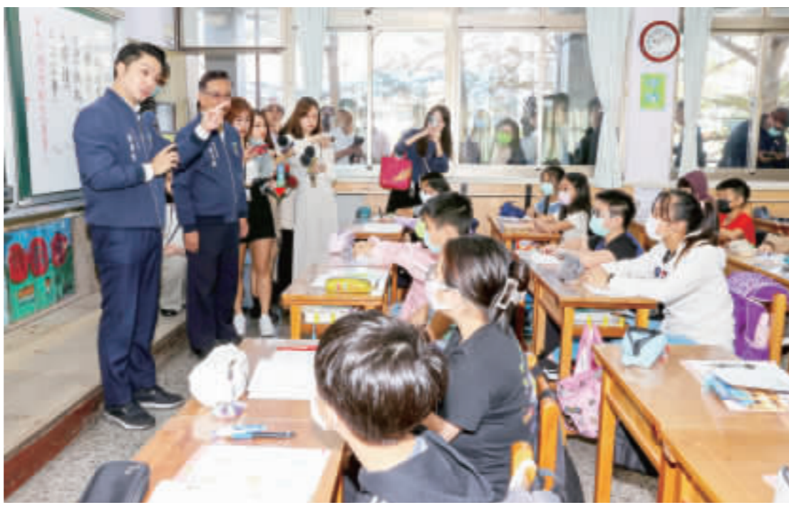
深坑火警導致異味瀰漫雙北地區，台北市長蔣萬安21日上午前往文山區木柵國小視察學生上課情形，關心學生的學習環境。(中央社)

【中央社記者黃旭昇新北21日電】新北深坑大火引發強烈惡臭，在深坑、民權、刺鼻臭味擴散至雙北，民眾強烈抱怨，住在北北北、大板、空氣臭到睡不著，連呼吸都困難。市府今天表示，持續殘火處理，監測空品品質，鄰近2所學校正常上課。 新北市深坑區北深路3段14巷內，東南科對面的建物地下室20日發生火警，濃煙密佈、瀰漫惡臭；臭味引發新北市新店區、永和區至