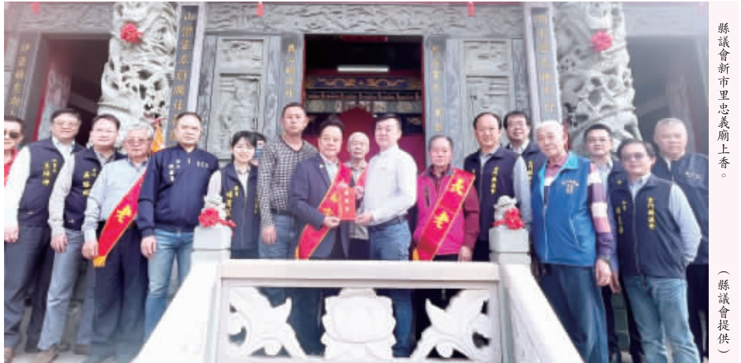
縣議會新市里忠義廟上香。