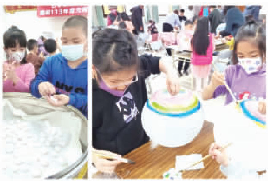
上左、小朋友提湯圓。上右、彩畫花燈。下左、居民夜遊雙鯉湖。下右、親子展示的花燈作品。

記者許峻魁/金湖報導 一年一度的元宵節即將來臨，近日地方各社區陸續舉辦歡慶元宵的相關活動，金寧鄉古寧頭社區發展協會也在日前舉辦「古寧頭社區元宵節提燈遊湖品嘗湯圓活動」，邀請居民手持自行彩繪的傳統燈籠，在燭光的引導之下，一起來趟夜遊雙鯉湖，體驗湖光夜色的美景。 為了慶祝一三年元宵節，古寧頭社區發展協會於日前的晚間六時左右