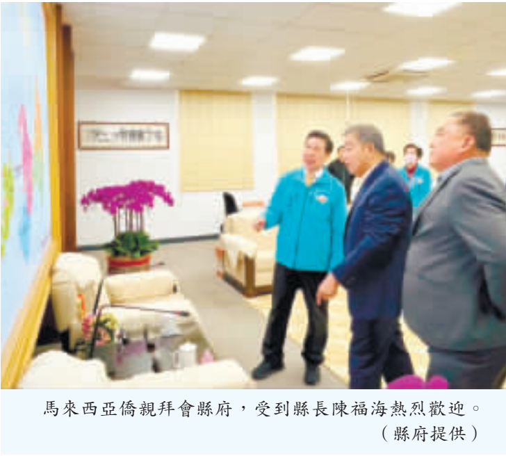
馬來西亞僑親拜會縣府，受到縣長陳福海熱烈歡迎。

有助於交流活動的擴大與延續，因此縣府也積極爭取中央政府的補助，將中央政府的補助與地方政府的預算結合，將有助於交流活動的擴大與延續。陳福海表示，自己重返縣府後當務之急是希望讓縣政更為穩健的運行，財政問題、金酒銷售都是重中之重，不過縣府對於遠在南洋的僑親也不會忘記，若有機會將在這一兩年安排僑親訪問團到南洋探親。對於南洋僑親以及三忠宮的盛情邀約，縣長陳福海表示，自己重返縣府後當務之急是希望讓縣政更為穩健的運行，財政問題、金酒銷售都是重中之重，不過縣府對於遠在南洋的僑親也不會忘記，若有機會將在這一兩年安排僑親訪問團到南洋探親。對於南洋僑親以及三忠宮的盛情邀約，縣長陳福海表示，自己重返縣府後當務之急是希望讓縣政更為穩健的運行，財政問題、金酒銷售都是重中之重，不過縣府對於遠在南洋的僑親也不會忘記，若有機會將在這一兩年安排僑親訪問團到南洋探親。