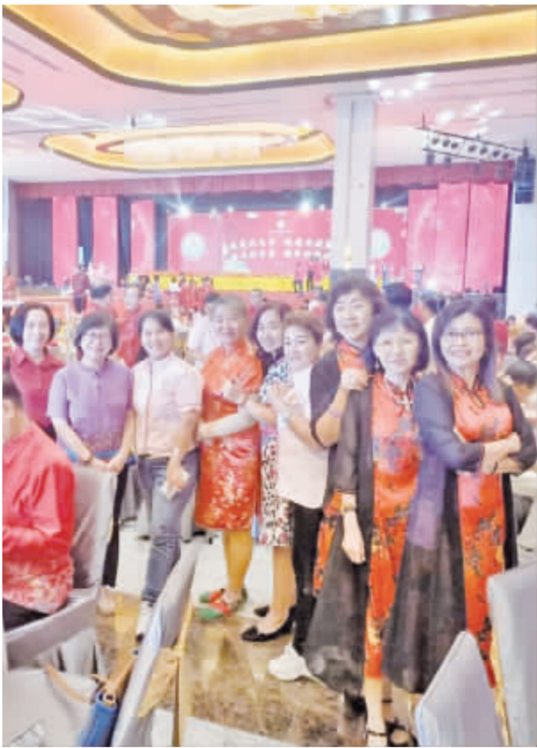
當天活動花絮

〔整理撰稿：僑訊小組〕 2024年2月25日，馬來西亞福建社團聯合會主辦「2024甲辰年全國福建鄉親新春大團拜」活動，總會婦女組的代表們出席了這一盛大的慶祝活動。此次活動旨在加強全國各地福建鄉親之間的聯繫和團結，慶祝新春佳節。 活動中，各界代表共聚一堂，透過各種文化表演和交流活動，展示了福建文化的獨特魅力和豐富多彩的傳統。參與者們不僅享受了一系列精彩的文藝演出，還藉此機會加深了相互之間的了解和友誼。 值得關注的是，下一屆的新春大團拜，即2025年的活動，將由馬來西亞同安金門廈門聯合總會主辦。總會婦女組也將繼續參與籌委事項，致力於使下一屆活動更加豐富多彩，進一步促進社區的團結和文化交流。 這一系列活動不僅強化了福建社群在馬來西亞的凝聚力，也為促進文化多樣性和包容性做出了重要貢獻。透過這樣的交流和慶祝活動，福建鄉親們展現了他們對傳統文化的深厚感情和對未來的共同期望。