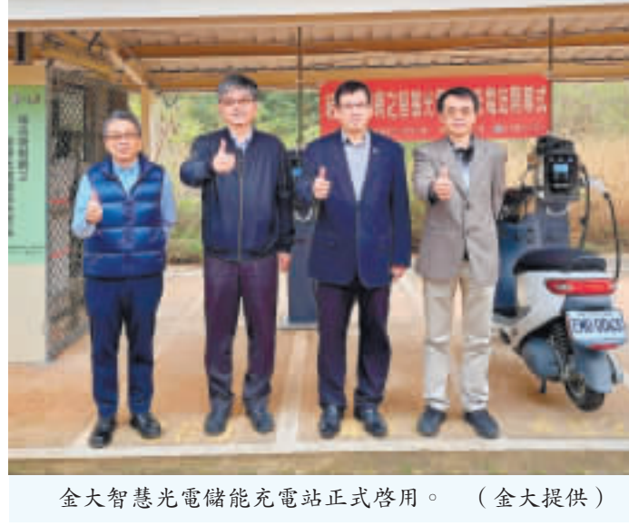
金大智慧光電儲能充電站正式啟用。