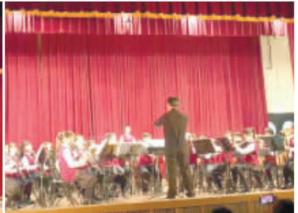
明日之星——全國學生音樂比賽之前，金門縣昨日下午辦理西洋音樂類組賽前觀摩音樂會。

記者李增汪／綜合報導 明日之星——全國學生音樂比賽之前，金門縣昨日下午辦理西洋音樂類組賽前觀摩音樂會。