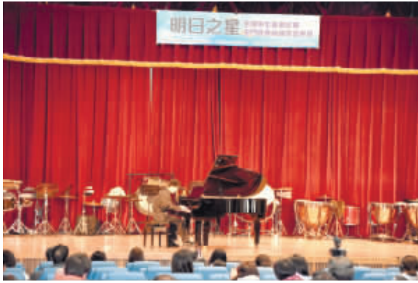
明日之星——全國學生音樂比賽之前，金門縣昨日下午辦理西洋音樂類組賽前觀摩音樂會。

和家長及學生的努力和付出，並強調努力不一定不會白費，預祝參加同學爭取好成績，抱回大獎，爲個人和團體寫下美麗篇章。