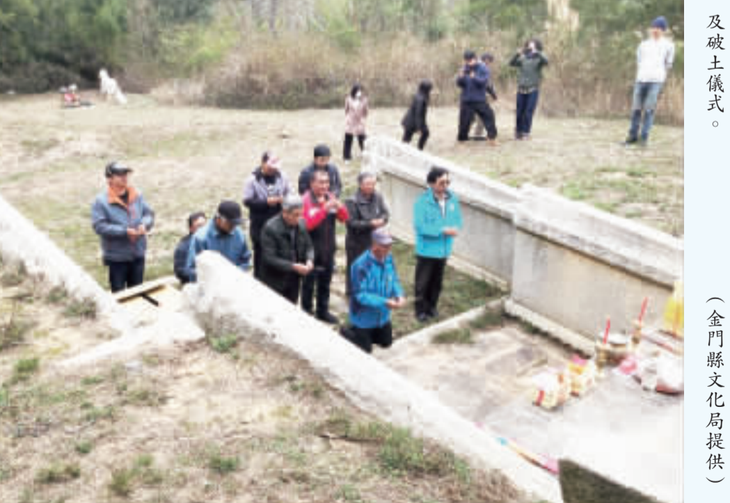
金門縣定古蹟黃汴墓修復工程，辦理施工前說明會及破土儀式。

記者李增汪／綜合報導 金門縣文化局於2月27日在金沙鎮公所三樓會議室舉辦金門縣定古蹟英坑黃汴墓修復工程說明會，相關後代及英坑社區發展協會理事長皆到場聽取修復工程報告。過程中，金門縣文化局局長呂坤和及施工廠商易陽營造有限公司，仔細的向與會民眾說明修復歷程及修復工法。本案預計於今年9月27日竣工，開工後部分區域以透地雷達掃描及人力開挖，預期能找到部分遺失構件。 文化局長呂坤和表示：「本案在我12年上任後，立即向中央（文化部文資局）申請修復經費補助，獲得中央113年度補助37萬5千元（約工程費用55%）。我們很認真在做，並且督促廠商仔細的修復。尤其本案施工廠商是去年金質獎得主，相信在大家的共同努力下，修復成果值得令人期待。」 黃汴墓建於明朝嘉靖年間，造型宏偉，中央以浮雕刻有單開間重檐屋頂牌樓，牌樓雙柱內刻著「文水黃公呂氏墓」。 黃汴墓俗稱馬仔墓，為黃偉之父。黃汴，字梁輔，號東郊，明涇州汶水人，為紫雲四安派下開汶水四房四世，妻呂氏，生三子，長子為一品節完人「美稱之黃偉。黃偉辭官前之官職為松江府知府，從四品，故其父黃汴應有從四品之品秩，根據明代墓制，埕地可六十步、墳高十二尺，圍牆高六尺，並有石羊、石馬、石望柱各一對，現場又留有墓坊立柱構件，說明此墓應為有墓坊之明墓。 此墓外觀特徵為典型明代墓埕，依中軸線由外至內分別為外埕、前埕、內埕、供桌、墓碑、墓龜，外埕兩側分別設有一組石馬及石羊，內埕左右分別設有石獅側立、二曲首及頭曲手，墓碑兩側立有護牆、墓龜左右為護牆、後側亦立有護牆，曲手為護牆及筒瓦造型、護牆兩端作龍首。除前埕材料以三合土構築，其餘皆由花崗岩組砌而成。 墓碑外形成階梯狀，以中央對稱左右共降兩階，中央浮雕單開間重檐屋頂牌樓，內刻「文水黃公呂氏墓」。