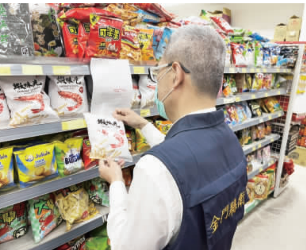
金門縣衛生局表示，有關蝦味先香辣口味、菜脯餅等含蘇丹紅色素產品，本縣通路均已下架，消費者可至原購買地點退貨。

記者李增汪／綜合報導 金門縣衛生局表示，有關蝦味先香辣口味、菜脯餅等含蘇丹紅色素產品，本縣通路均已下架，消費者可至原購買地點退貨。 金門縣衛生局接獲各縣市衛生局通知，有關濟生股份有限公司六廠製售之辣椒粉檢出蘇丹紅色素一案，衛生局日前已針對蝦味先香辣口味、菜脯餅及白胡椒餅等產品，稽查本縣之販售通路（全聯、家樂福、零售商號、地區超商及大型賣場），並透過通路商掌握問題食品批號，詳查問題批號食品是否流入金門。 經查本縣並未進貨白胡椒餅，其他有問題的各項產品批號包括：蝦味先香辣口味（規格為40g、80g、115g、300g，批號有效期間之日期區間為2024.9.8至2024.10.2）、菜脯餅（規格為30g、65g、110g，有效期間分別為：2024.8.2、2024.8.15及2024.8.22），經查本縣並未進貨。至於菜脯餅110g，金門縣衛生局日前派員前往全聯福利中心稽查，三家全聯福利中心已依公司通知下架回收產品總計50包。若消費者有疑慮，可憑原交易的完整發票，全聯將協助辦理退貨。 另外縣市通報苗栗縣鑫鑫食品股份有限公司之脫水辣椒粉也用到蘇丹紅辣椒粉，且製成菜脯餅及白胡椒餅產品。經查本縣並未進貨白胡椒餅，至於有問題之菜脯餅（規格為30g、65g、110g，有效期間分別為：2024.8.2、2024.8.15及2024.8.22），經查本縣並未進貨。至於菜脯餅110g，金門縣衛生局日前派員前往全聯福利中心稽查，三家全聯福利中心已依公司通知下架回收產品總計50包。若消費者有疑慮，可憑原交易的完整發票，全聯將協助辦理退貨。 本縣食品中盤商，經查並未進貨「白胡椒餅」及有問題批號日期之菜脯餅。 衛生局將持續進行販售通路之稽查及監督經銷商回收退回作業，防止問題產品流入市面，以確保鄉親之消費安全。