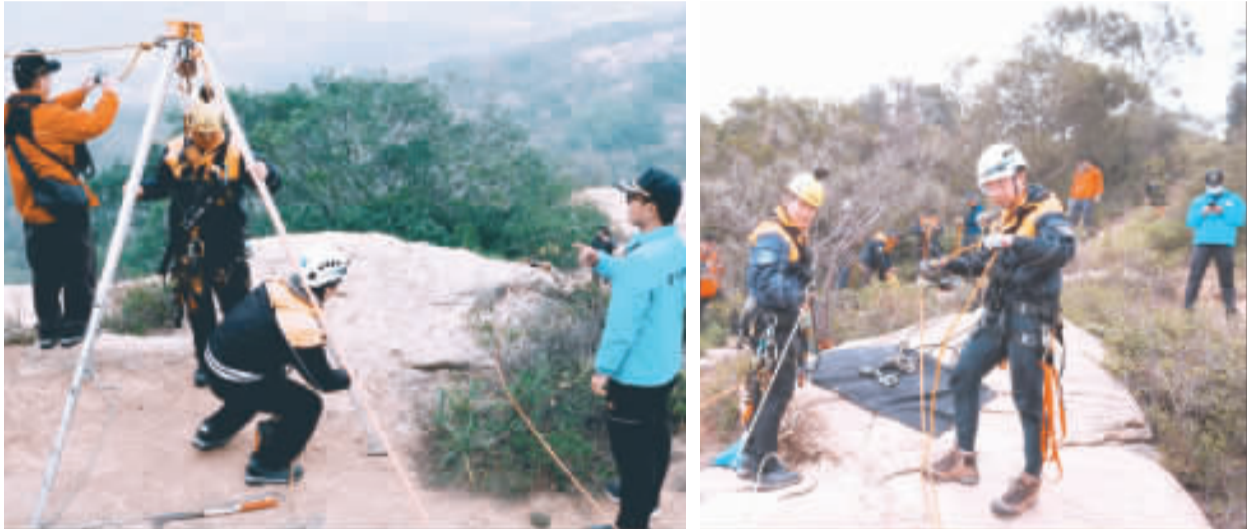
消防局第二大隊金沙、金湖分隊在太武山百二階大岩壁舉行大隊組合訓練。

記者楊水球／金湖報導 太武山是金門的熱門景點之一，有許多秘境與陡峭的山壁，吸引登山愛好者前來挑戰。但山上意外時有發生，能否在第一時間有效救援，是消防隊面臨的重要考驗。金門縣消防局第二大隊、金湖分隊於29日在太武山百二階大岩壁進行大隊組合訓練，由消防局長觀摩演練，提高救援應變能力，與橫向單位金門國家公園管理處、陸軍金門防衛指揮部、保安警察第七總隊第四大隊金門分隊配合演練。總計出動車輛十餘次，各單位人員合計三十餘人，成功展現單位間專業能力協作默契。