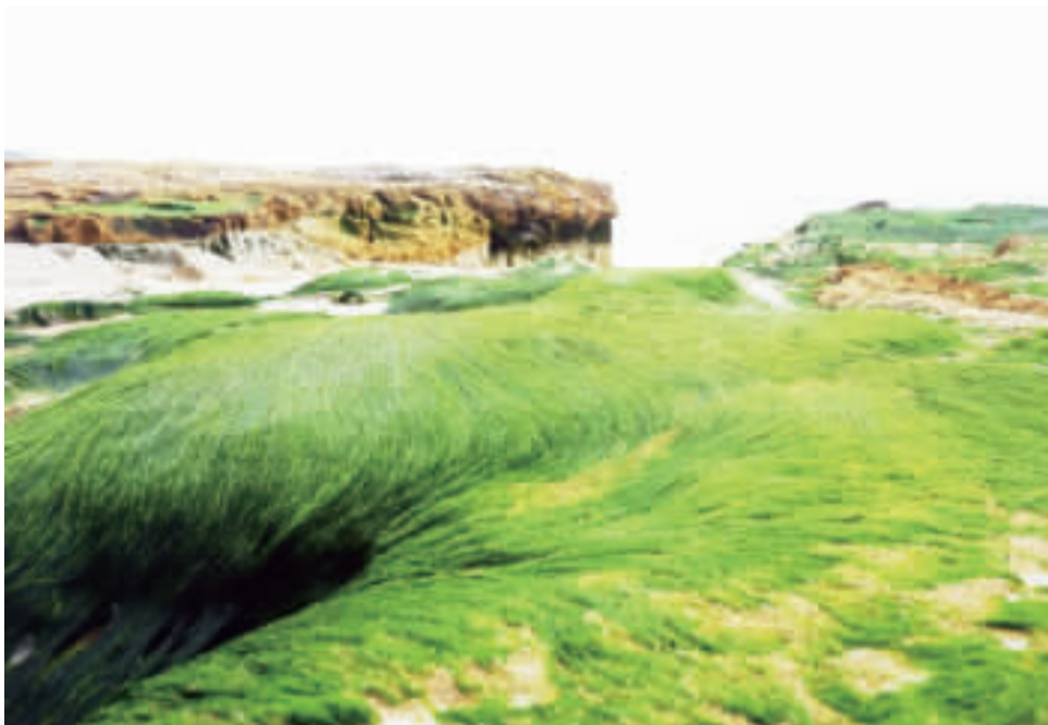
烈嶼鄉公所「2024綠色岐蹟·烈嶼綠石槽」系列活動開跑：左、電瓶車暢遊烈嶼景點；中、右、烈嶼限定綠石槽海岸景觀。