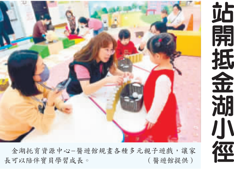
金湖托育資源中心-醫遊館規畫各種多元親子遊戲，讓家長可以陪伴寶貝學習成長。

改版啓事 金門日報社爲體貼廣大讀者，同時考量高齡化社會內各大報排版格式，3月1日起試辦調整字體並加寬新聞版面行距，讓讀報更不費力。 各項電子醫療設備驗證的業者，使機艙得以加裝葉克膜、嬰兒保溫箱及主動脈氣球幫浦（IABP）等設備，確保有急需用藥的民衆都能安捷後送的行列。 安捷不僅是唯一符合時間規定的廠商，同時也是目前三離島中唯一有提供備用機的廠商，使得金門的緊急醫療後送防護網更健全。安捷去年採購全新同款式飛機，一旦駐地專機遇上例行性或突發性檢修，則可安排第二架飛機前往支援，大幅降低無機可用的情況發生。 針對先有人士質疑疑機沒有防冰及艙壓裝置，安捷也進一步說明。臺灣冬日水氣重、遇低溫容易結冰，專機自然裝有防冰裝置，至於D402飛行高度較低，反而無艙壓變化問題，病患及家屬可以更放心。 高健祐表示，安捷進駐金門以來，從來不敢掉以輕心，都是用最高規格照顧每一個個案，用心做好每一個環節，盼能給予傷病患無微不至的照顧，金門縣政府每一趟任務也都全程高度參與及把關，相信服務品質只會愈來愈好。另外，爲感謝衛生福利部金門醫院的通力合作，安捷日前致贈院方2顆全新的轉運型保溫箱電池，預計使用時間可延長至3小時。 衛生福利部107年推動「金門、連江、澎湖三離島航空器駐地備勤及運送服務計畫」，交由航空業者於各離島派駐醫療專機，負責運送緊急傷病患至本島就醫，提供西部離島更周全的醫療照護服務，現已成爲離島居民重要的救命管道。該計畫11年因故改由各離島衛生機關重新招標，經各級政府機關及各離島專家學者共同評選，金門自112年1月正式委託安捷航空承攬服務計畫。