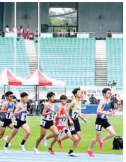
金城國中田徑隊參加2024年港都盃全國田徑錦標賽表現優異，兩人榮獲佳績，為個人爭取榮譽，也為學校爭光。

金城國中田徑隊參加在高雄市的2024年港都盃全國田徑錦標賽表現優異，兩人榮獲佳績，為個人爭取榮譽，也為學校爭光。