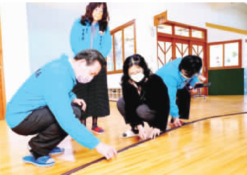
縣長陳福海推進幼兒教育政策，113學年度再增設5班2歲幼幼專班，倡導優質教育與校園綠美化，助力幼兒潛能發展。

記者李增汪／綜合報導 縣長陳福海推進幼兒教育政策，113學年度再增設5班2歲幼幼專班，倡導優質教育與校園綠美化，助力幼兒潛能發展。以「禮運大同篇」揭櫫「幸福、宜居、永續島」的縣政藍圖，縣長陳福海對於幼兒的照顧，尤為重視。2歲幼幼專班自108學年度陸續增設，原訂113學年度陸續增設，原訂113學年度陸續增設，原訂113學年度陸續增設。 在縣長陳福海推進幼兒教育政策，113學年度再增設5班2歲幼幼專班，倡導優質教育與校園綠美化，助力幼兒潛能發展。以「禮運大同篇」揭櫫「幸福、宜居、永續島」的縣政藍圖，縣長陳福海對於幼兒的照顧，尤為重視。2歲幼幼專班自108學年度陸續增設，原訂113學年度陸續增設，原訂113學年度陸續增設。