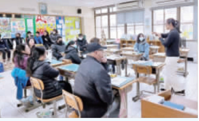
古城國小召開112學年度下學期國小部及幼兒園「班級家長會」。

為了加強學家長與學校的聯繫及關係，增進家長對校務發展與班級狀況的深入了解，古城國小於3月2日上午召開112學年度下學期國小部及幼兒園「班級家長會」，邀請各班級家長與班級老師、參與國小部與附設幼兒園班級的「與導師有約」活動，就學