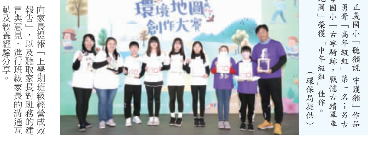
正義國小「聽懶說 守護懶」作品，勇奪「高年級組」第一名；另古寧國小「古寧騎跡，戰憶古蹟單車地圖」榮獲「中年級組」佳作。

繪製內容需於「環境倫理」、「永續發展」、「氣候變遷」、「災害防救」及「能源資源永續利用」等5大環境教育學習主題中，擇一主題進行繪製。另需撰寫地圖說明書1份，以呈現地圖創作的動機與意義、真實故事、對環境的反思與可能參與的行動等學習歷程。