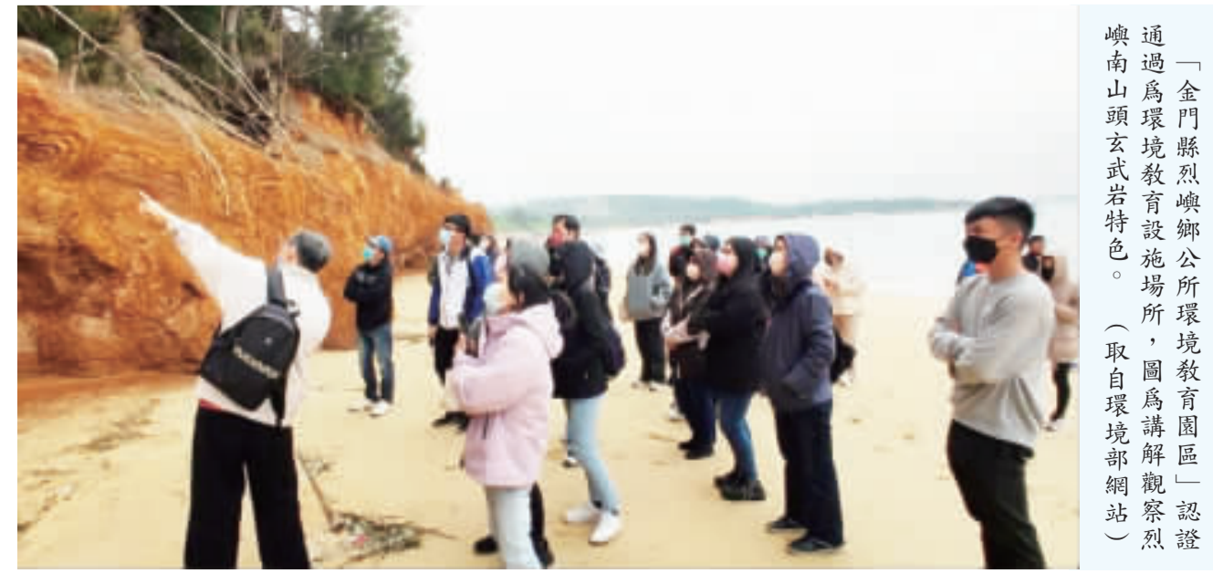
「金門烈嶼鄉公所環境教育園區」認證通過為環境教育設施場所，圖為講解觀察烈嶼南山頭玄武岩特色。

記者莊煥寧／綜合報導 「金門烈嶼鄉公所環境教育園區」以烈嶼（俗稱小金門）南山頭玄武岩海岸為推動環境教育的主軸，希望以增進來訪者對於岩石的基本認識，也要藉此解說全球暖化造成海平面上升的迫切問題，以期落實愛護自然及節能減碳的生活態度。該園區最終冀望透過環境教育，達到保護烈嶼地質景觀、生態環境的目的。 依據環境部的說明，「金門烈嶼鄉公所環境教育園區」以烈嶼（俗稱小金門）南山頭玄武岩海岸為推動環境教育的主軸，除了希望以增進來訪者對於岩石的基本認識，也要藉此解說全球暖化造成海平面上升的迫切問題，以期落實愛護自然及節能減碳的生活態度。該園區最終冀望透過環境教育，達到保護烈嶼地質景觀、生態環境的目的。 依照「環境教育設施場所認證及管理辦法」規定，辦法所稱環境教育設施場所，指整合環境教育專業人力、課程方案及經營管理，用以提供環境教育專業服務之具有豐富自然或人文特色之空間、場域、裝置或設備。而設施場所之設置，應尊重生命、維護生態、保護環境，並與在地環境資源及特色結合，避免興建不必要之人工裝置、鋪設或設備。申請設施場所認證，應檢具申請書、證明文件影本、計畫書、其他經中央主管機關指定之文件等向中央主管機關為之。