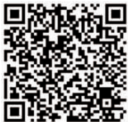
金門足球運動委員會臉書