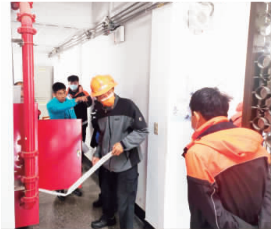
麒麟電廠執行室內消防栓演練。