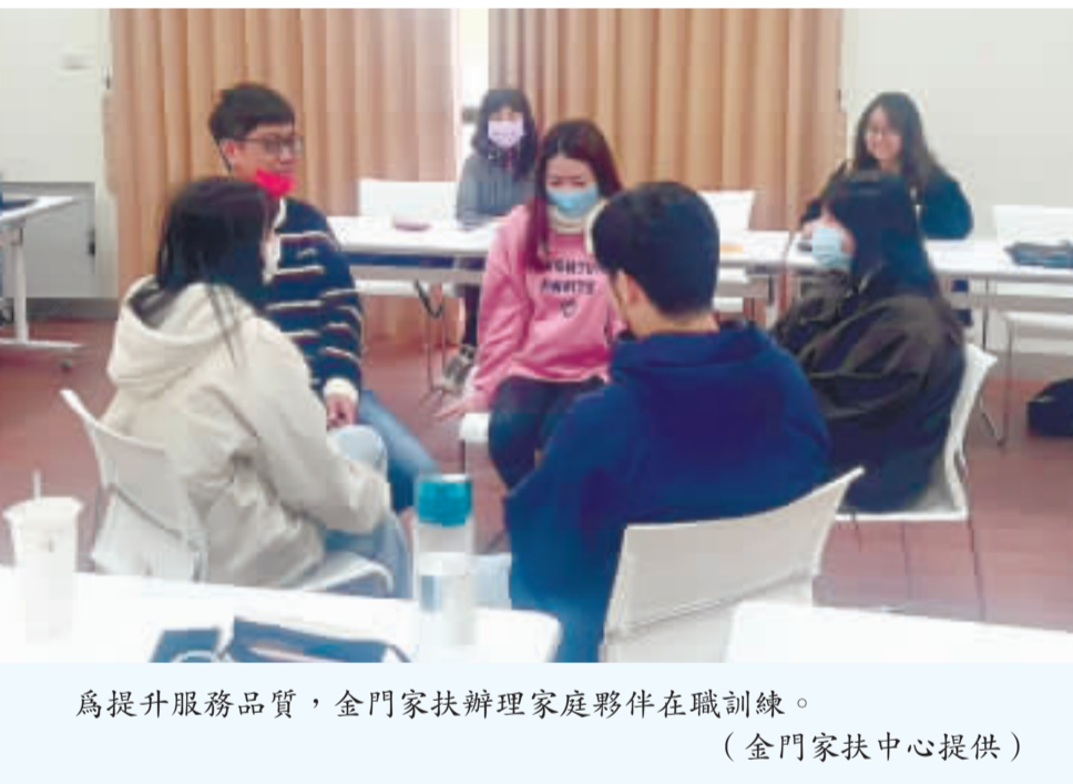
為提升服務品質，金門家扶辦理家庭夥伴在職訓練。

記者許峻魁／金湖報導 濃霧攪局，昨(5)日下午開始，金門尚義機場就被濃霧所籠罩，導致能見度不足，下午多架航班陸續取消，讓不少旅客的行程受到影響。 每年到了三至五月之間，金門就開始容易出現大霧，中央氣象署昨日下午一時三十分左右，針對金門跟馬祖發布濃霧特報指出「金門及馬祖易有局部霧或低雲影響能見度，金門已出現能見度不足兩百公尺的現象，請注意。」 從昨日下午開始，金門尚義機場能見度就因為濃霧持續下降，約在六百公尺至四百公尺左右來回擺盪，甚至在下午五時開始，能見度一度只剩下一百五十公尺到兩百公尺左右。 一位搭乘五時往台南班機的旅客受訪時表示，不希望因為濃霧而受到影響，不然會讓他後續行程延誤；而他也已經緊急候補往高雄的班機作為備案，如若真的都無法起降，他無奈地說只好在金門待一晚。 金門航空站主任洪念慈表示，昨日上午機場開關關，但到了四時多因為海霧造成能見度不足，導致起降的班機受到影響。洪念慈表示，由於這兩天屬於金門旅遊的淡季，因此受延誤的民眾有限，因此預計明日就可以把受影響旅客轉運完畢。 洪念慈提醒，由於金門已經進入霧季，中轉往來小三通或是往來台金的旅客，這段時間務必密切注意航空公司或是航空站的相關訊息，以免行程延誤，影響到自己的心情。