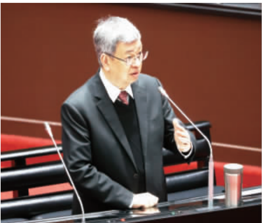
▲行政院長陳建仁(圖)5日率領各部會首長赴立法院進行施政報告並備質詢，他表示，現在的交點記點制確實有一些需要修改的地方，政府也聽到民間的聲音，行政院會預計7日針對交通交點記點制度提出修法。

【中央社記者林敬毅台北5日電】行政院預計7日針對交通交點記點制度提出修法，行政院長陳建仁表示，現在的交點記點制確實有一些需要修改的地方，政府也聽到民間的聲音，行政院會預計7日針對交通交點記點制度提出修法。 陳建仁今天率領各部會首長赴立法院進行施政報告並備質詢。 行政院預計7日提出修訂草案，提高部分交通違規罰鍰，罰鍰上限在新台幣1200元以下，輕微交通違規不記點。 民進黨立委林俊憲質詢時表示，行政院檢討交通交點記點制度，新國會開議後第一個月就應做這件事，等於是政府的第一項優先法案，造成很大的民怨。 陳建仁說，現在的交點記點制確實有一些需要修改的地方，有民間的聲音，也有職業駕駛人反映，輕的罰鍰不需要有記點，科技執法及民衆檢舉部分，也有很多需要修正。 林俊憲指出，政府應該採取平衡，既