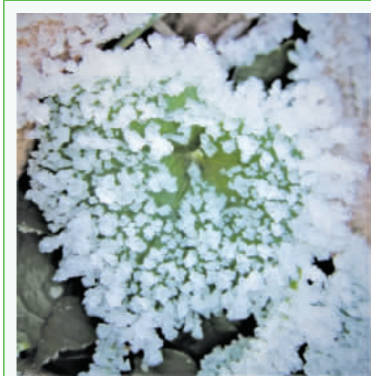
霜花彷彿藏著無限款款深情。