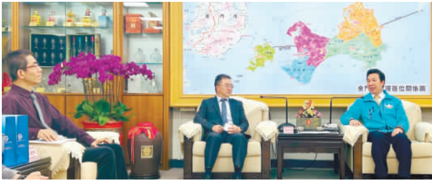
福建金門地方法院院長陳連發(左)率領法官、陳鴻樟官長(中)及縣府秘書長陳福海(右)拜會縣長陳福海。

【本報記者陳冠霖/金門報導】福建金門地方法院院長陳連發，率領法官、陳鴻樟官長、至縣府拜會縣長陳福海，並邀集民政處處長許慧婷、社會處處長黃雅芬及地政局局長呂清福共商法院與縣府跨單位合作。席間針對法院進駐社工人員議題進行研議，決議縣府社會處社