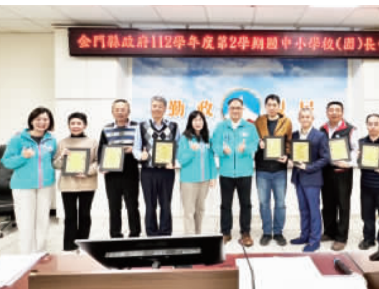
右、金門縣政府昨日召開112學年度第2學期中小學校長會議，由副縣長李文良主持；左、縣府頒發金門縣112年語文競賽縣賽團體獎。

副縣長李文良代表縣長陳福海向與會校長致謝，校長不好當，大家辛苦了，他感謝大家對於教育的奉獻。本身也是教育專業出身的李文良說，「教育」說難不難，說簡單不簡單，變化很多，但無論怎樣變化，團隊的領導十分重要。他表示，校長在職務上確實會反映到各校的氛圍，可能大家常在自己學校內沒有明顯感受，但外人一到學校，便可以明顯感受出來這個學校的氛圍，因此，他勉勵校長們，不要輕忽自己的影響力以及改變，希望大家秉持對教育的熱忱，莫忘當初從事教育的初衷。