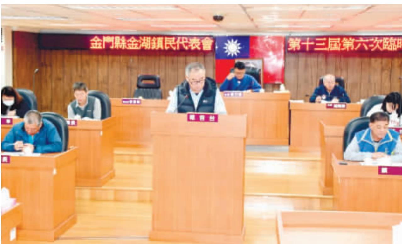
金湖鎮代會臨時會昨日進行2024金湖年貨大街活動成果報告，多位鎮民代表提出質詢。(楊水詠攝)

與經濟的繁榮。 在金湖鎮公所的二〇二四金湖年貨大街活動成果報告總結指出，年貨大街與金湖觀光市集兩者皆為試辦性質之市集，提供未來長期舉辦夜市之經驗，經兩次活動後，就目前人流與消費規模，難以長期支撐市集，需適當降低頻度、完成硬體設施建設、擴大規模舉辦，並加以廣告宣傳，希冀在未來創造出金湖鎮成為金