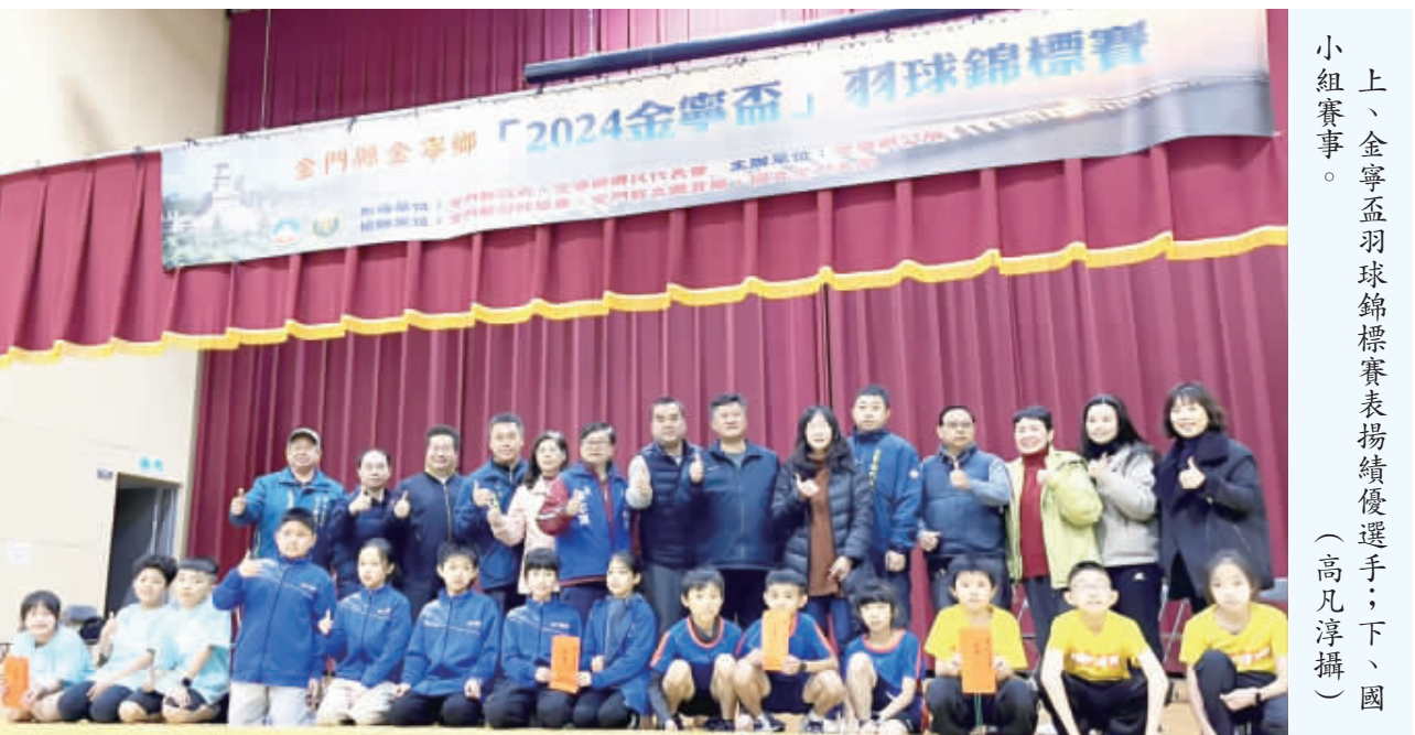
上、金寧盃羽球錦標賽表揚績優選手；下、國小組賽事。

由金門縣政府、金寧鄉代會指導，金門縣羽球協會、金門縣立體育場、國立金門大學協辦，金寧鄉公所主辦的「2024金寧盃羽球錦標賽」，9、10日在金門大學體育館進行一連兩天賽事，該項比賽有長青組、社會混合團體組（含高中）、國中混合團體組、國小六年級混合團體組、國小五年級混合團體組、國小四年級混合團體組、國小三年級混合團體組等七組，計有團體組48隊約384位選手參與角逐、揮拍競技。