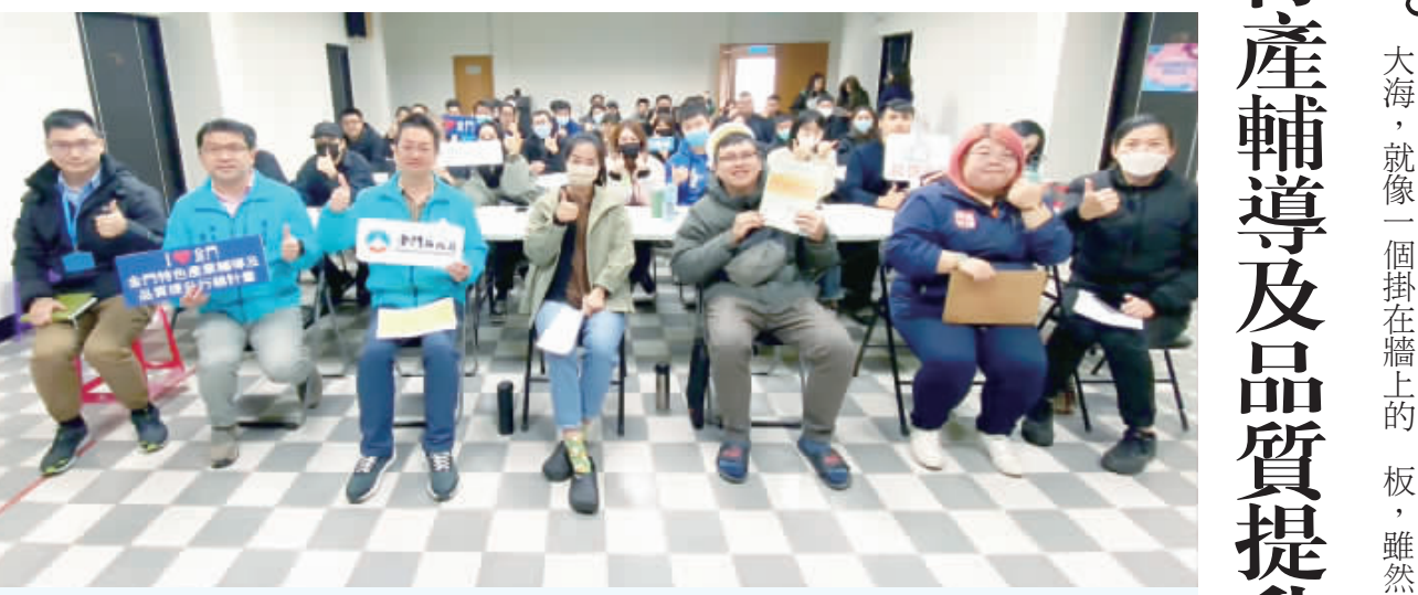
特色產業輔導及品質提升行銷計畫說明會吸引超過60位業者參加。

記者陳冠霖／縣府報導 金門特色產業輔導及品質提升行銷計畫現正受理報名，截止日期至3月30日止。本說明會吸引了超過60位來自金門地區的業者參加，展現地方對於產業發展的關注和渴望。縣府建設處表示，近年來一直積極推動美食業者的輔導及品質提升計畫，並獲得眾多業者積極參與和支持。本計畫針對縣內合法經營且願意接受輔導的業者，提供產業輔導升級的支援，透過顧問協助與指導，以進行輔導申請與改善，依營業需求針對營業環境提升、科技應用導入、包裝設計、品牌設計、故事行銷化輔導等，由專家顧問團隊協助提供客製化輔導。