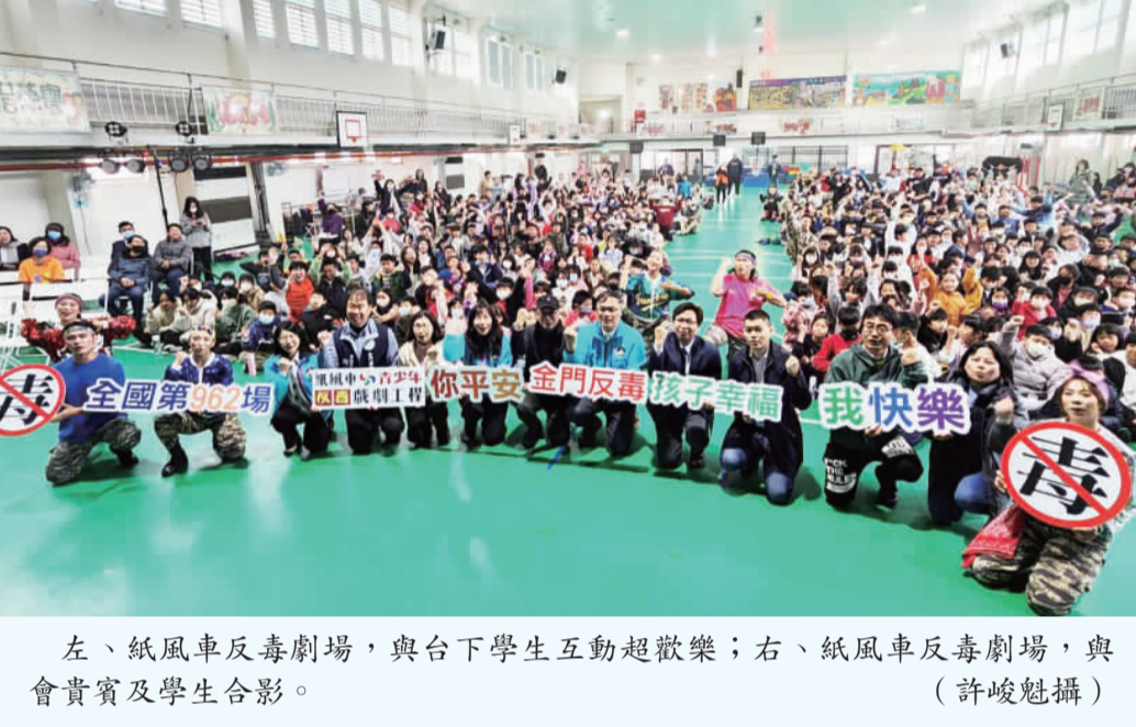
左、紙風車反毒劇場，與台下學生互動超歡樂；右、紙風車反毒劇場，與會貴賓及學生合影。