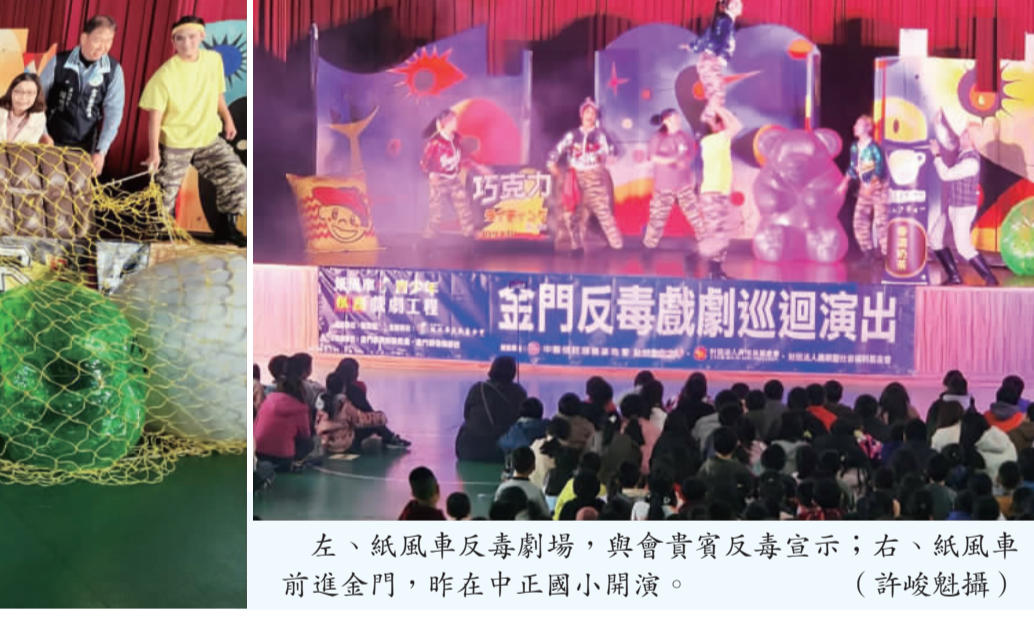
左、紙風車反毒劇場，與會貴賓反毒宣示；右、紙風車反毒劇場，昨在中正國小開演。