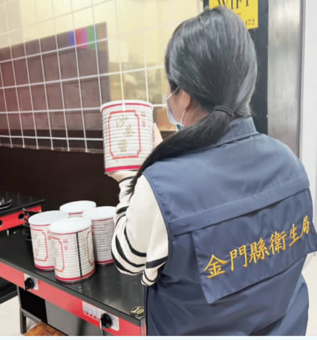
金門縣衛生局派員追查金福華食品「福寶牌沙茶醬2.7kg/罐」產品流向情形。

記者楊水泳／金湖報導 有關南投縣金福華食品貿易有限公司使用津棧國際貿易有限公司辣椒粉（檢出蘇丹紅色素）製售的「福寶牌沙茶醬」(2.7kg/罐)（批號20250910）一流入本縣，金門縣衛生局接獲南投縣衛生局通知，立即於昨（11）日派員追蹤產品流向，經查本縣地區有一家申商於去年十月三日進貨該批有問題沙茶醬計30罐（2.7kg/罐）販售。 ○媽媽臭鍋已立即下架庫存5罐及1罐已開封沙茶醬，並改用其他廠牌沙茶醬做為火鍋沾料使用；○索火鍋店已全數用完並改用其他廠牌沙茶醬。 本縣衛生局已辦理問題沙茶醬回收退貨作業，該批產品已全數下架，本縣衛生局將持續加強稽查，以維護民衆的安全。 衛生局表示，將持續追蹤問 題辣椒粉產品流向，監督業者下架回收作業，防止問題產品流入市場並針對有疑慮產品加強查核，以保障民衆飲食安全。同時，衛生局也提醒食品業者，依據食品安全衛生管理法第7條第5項規定，食品業者於發現產品有危害衛生安全之虞時，應立即主動停止製造、加工、販賣及辦理回收，並通報直轄市、縣（市）主管機關。違反以上規定者，依同法第47條處新臺幣3萬元至30萬元罰鍰；另違反食品衛生管理法第47條第11款及第12款規定，規避、妨礙、拒不提供資料可處新臺幣3萬元至30萬元。 由於近期辣椒粉檢出蘇丹紅色素產品繁多，衛生局表示相關資訊可至衛生福利部食品藥物管理署官網首頁「辣椒粉檢出蘇丹色素不合格專區」查詢。 責任編輯／呂美慧