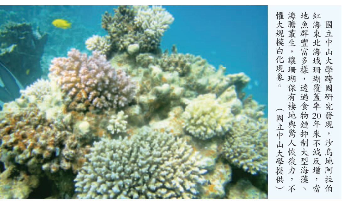
國立中山大學跨國研究發現，沙島地阿拉伯紅海東北海域珊瑚覆蓋率20年來不減反增，當地魚群豐富多樣，透過食物鏈抑制大型海藻、海膽叢生，讓珊瑚保有棲地與驚人恢復力，不懼大規模白化現象。