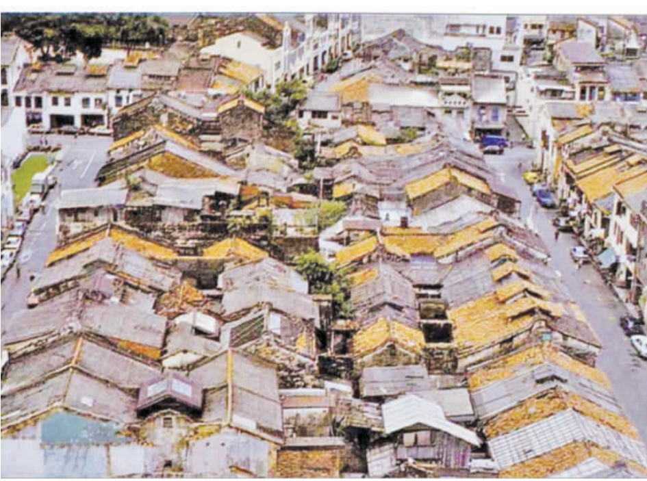
早年新加坡估俚間的房子，目前大都已經拆除了。

估俚間又稱苦力間：有點像大通舖，小小的房間放上木板，讓二、三十個估俚(都是男生)一起做一個睡覺休息的住所。