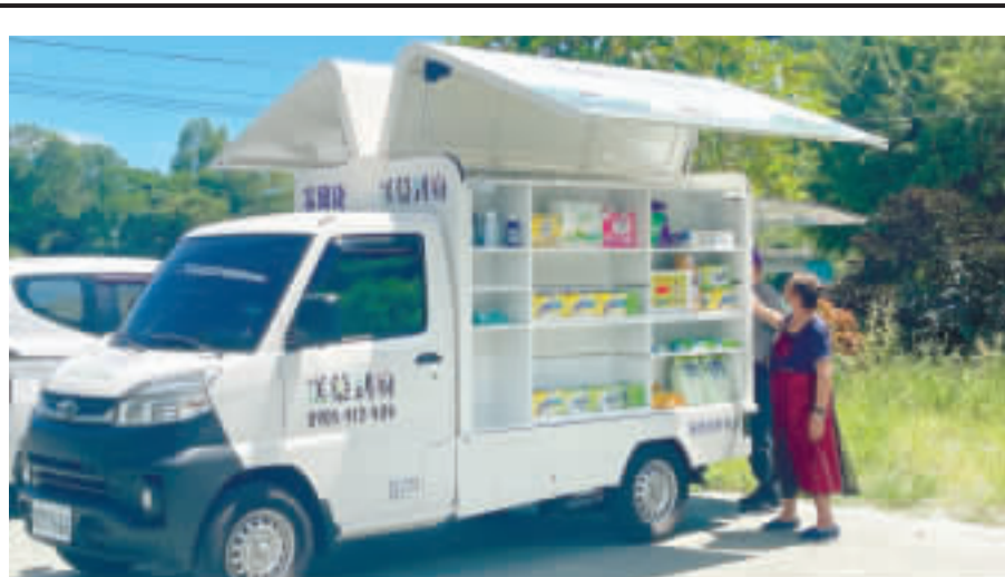
花蓮縣首輛由長照機構購置、專為偏鄉長者服務的行動式藥局專車，為需要的民眾提供長期送藥及藥物諮詢服務。 （文·中央社）

支持，還有對台海和平穩定的關注，在國際上為台灣發聲。 他說，因為2024年是國際的選舉年，台灣在2個月以前完成總統與立委的選舉，國際社會都非常關注這場選舉，國際社會關注的焦點是在中國攻勢下如何維護國際法與民主的價值，人民會做出何種選擇。 賴清德說，即便在中國國強地大介入下，台灣人民仍然堅定用手中神聖的選票支持，在民主的道路上與國際民主陣營共同合作，持續走入國際。 賴清德同時也是總統當選人，他表示，5月20日會與蕭美琴一起上任共同領導這個國家，非常期待能夠繼續得到大家的支持，兩人最重要的工作，在政治上就是維持台海和平現狀，帶來印太的和平與穩定，不論是G7領袖會議的結論，或是美國總統、國際社會的領袖都關注到台海的和平穩定是安全與繁榮的必要因素。 他說，台灣位處第一島鏈，直接面對中國的威脅，「我知道我們的責任，我們會盡我們所能維持印太的和平穩定」。 當然台灣也希望國際社會能夠持續關注台海的和平穩定，也必然在與國際社會共同合作之下，台灣才有辦法讓這個區域可以持續維持和平穩定下去。 在經濟產業上，他表示，台灣非常希望能夠持續加入國際的供應鏈，也希望能夠得到美國政府與國際社會的支持，讓台灣有機會加入區域經濟。因為中國政經局勢的不穩定，還有經商環境已經大不如前，現在有許多多的台商已經從中國撤出，到美國、日本、歐洲、印太區域，如果能夠跟個別國家加入區域經濟，對台灣產業發展、對台商本身事業的擴張，應該是非常重要的。