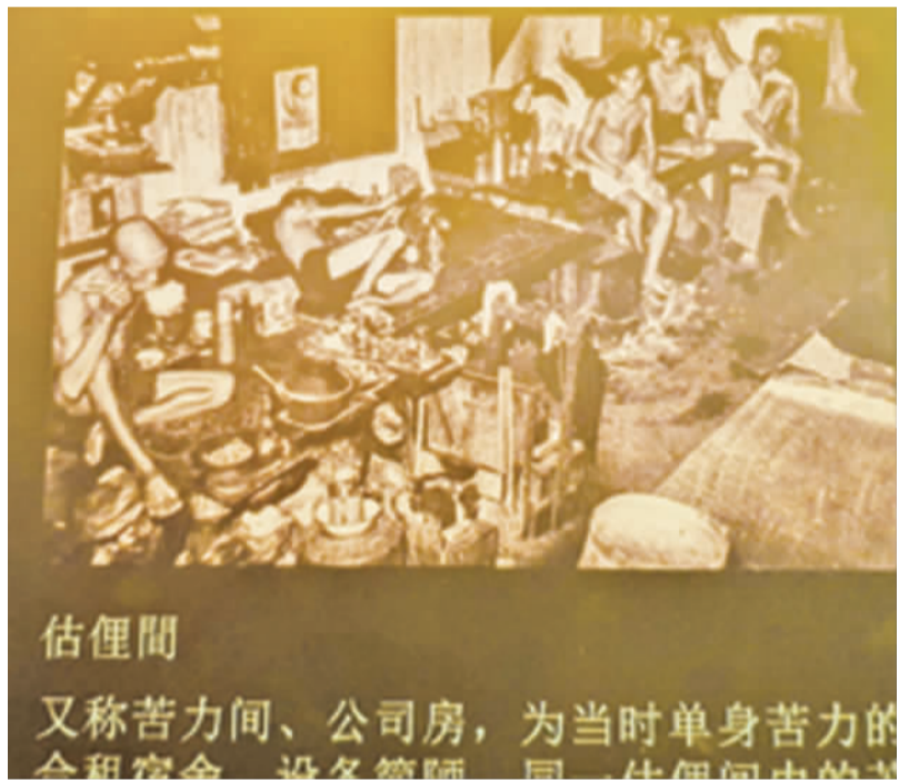
當年一片板就是估俚的家，食睡都在上面。

專有小名詞：估俚：「估俚」，和中文中的「苦力」意思相同，都為英文「Coolie (苦力、壯工)」的音譯，而且此一詞也用於對照馬來文中的「Kuli (苦力)」一詞。