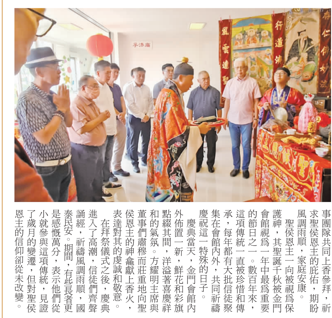
農曆二月二金甯會館慶祝聖侯恩主聖誕千秋(整理撰稿：僑訊小組)

控肉包、豬腳芋頭等家鄉美食，不僅是金門人的回憶和情感象徵，更是金門文化的一部分。這些美食蘊含著濃濃的家鄉情感和歷史文化，透過品嚐這些美食，金門人能夠重拾童年的回憶，感受到家鄉的溫暖和情誼。在異鄉生活的金門人，透過這些美食，不僅能夠保持著與家鄉的情感連結，也能夠延續和傳承金門的文化和傳統。