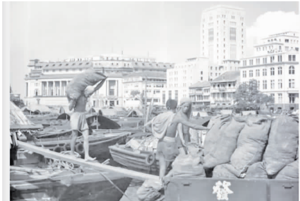
早年在新加坡港口的老照片，圖為1956年代估俚在新加坡港口卸貨的照片。