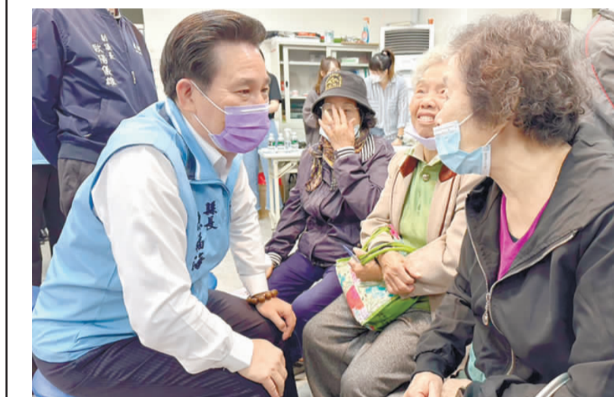
「縣長與鄉親有約」將於3月21日下午舉行，由縣長陳福海親自傾聽民意。

記者陳冠霖／縣府報導 為探索民情、解決鄉親心中的難題，金門縣政府訂於3月21日下午3時在縣府大禮堂，辦理「縣長與鄉親有約」，由縣長率相關局處首長，接受鄉親陳情及建言。 縣長陳福海表示，鄉親的問題「一刻不容緩」，同仁應以「同理心」協助民眾解決問題，透過各局處主管與鄉親第一線接觸，提供民眾陳情及縣府蒐集與情情的管道，藉以調整施政方向，並在不違反法律之前提下，應確實考量「公益」與「私益」之平衡性，研議可行之替代方案，藉此解決困擾鄉親許久、沉痾難解的問題。 縣府民政處表示，活動當日駐有工作人員接待鄉親，自當日下午3時起至5時止，請鄉親親填具服務摘要後，以報到時間，依序領取號碼牌，於初步了解案由後，依案件性質，引導鄉親至相關局處，由各該局處長親自向鄉親解說，鄉親所提各案件之需求及反映之與情，將製成紀錄，現場除交換意見初步回應外，會後將由各管管單位，以公文書正式函復陳情人，另為減少民眾排隊等待時間亦可事前於「金門縣政府民政處」業務專區「縣長與鄉親有約」服務摘要表件」下載使用。