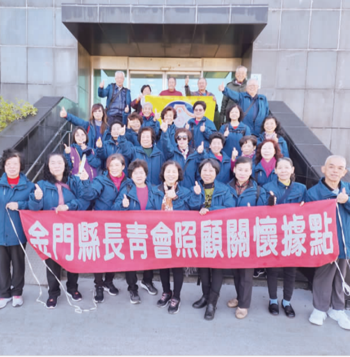
金門縣長青會赴陸交流，團員們在廈門合影。