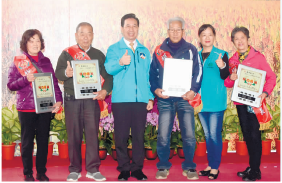
金門縣農會舉行金門地區慶祝農民節表揚大會，縣長陳福海與副議長歐陽儀雄、金馬聯合服務中心執行長楊上德以及到場的鄉鎮長、主席、公所秘書、金酒公司董事長吳昆璋頒發表揚模範農事小組長、模範農民、績優安全農業示範農戶、金牌農村縣內初賽等獎並合照。