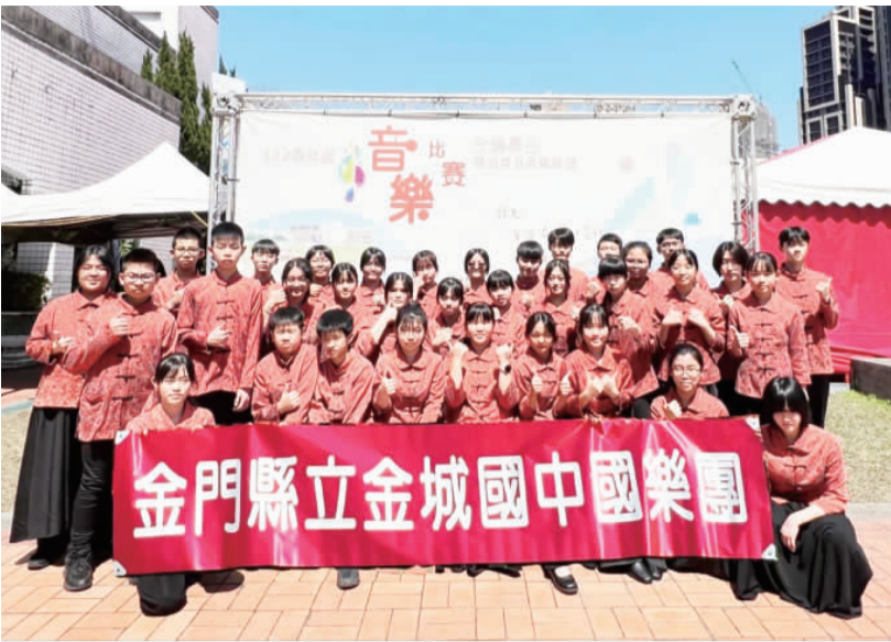
金門學子參加112全國學生音樂比賽，表現優異：左、112學年全國學生音樂比賽，城中國樂合奏奪得特優；右、中正國小管樂團參加全國音樂賽榮獲優等殊榮。