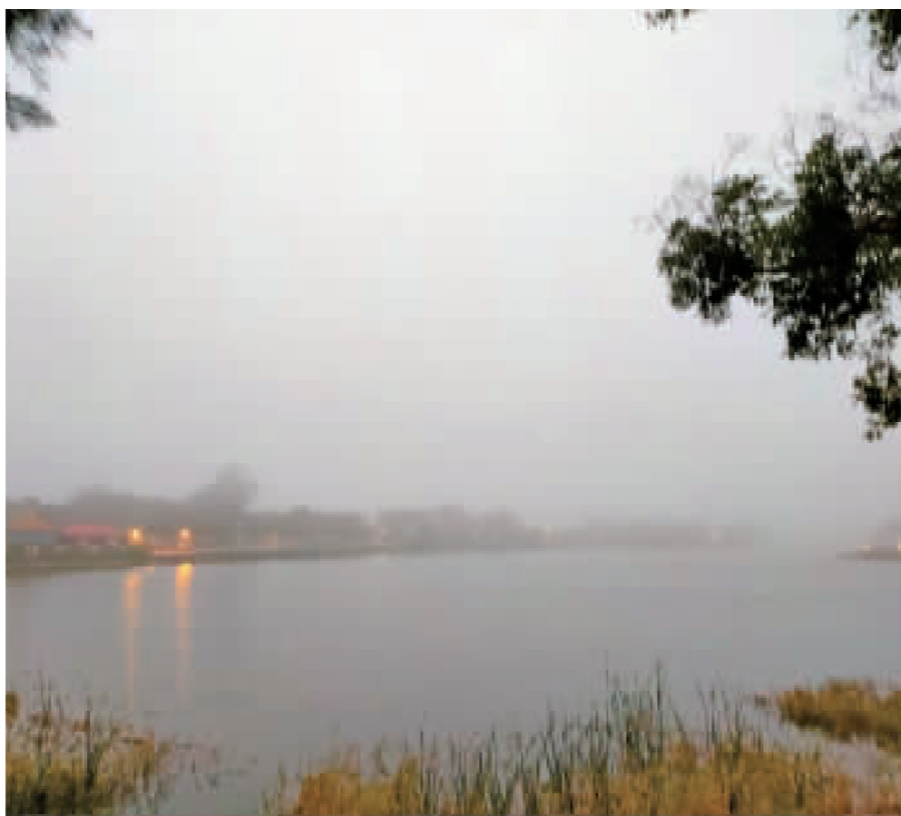
濛濛霧裡的雙鯉湖。

返家的路上看見靠海的村落籠罩著迷濛的霧氣，霧氣非常的重，厚厚的一層，回家後趕緊將晾著的衣服移到室內並緊閉門窗，望向遠方只見大地已罩上一層薄濛的霧，像一層絲帶擁抱著大地，也不意外的影響到班機的起降。 整個空氣裡濛濛地瀰漫著潮濕氣息，樓梯間的磚上也濛著水珠、牆壁上也滲出水珠，洗手間的地板、牆上、鏡子上都是水珠子，但是不似若從前會看到雲霧氣，反而是建築物們都像剛經歷過雨的洗禮似的潮濕氣滿滿，吸飽了滿滿的水氣般，就好像剛下過幾場大雨一般。 隔天一早只見門窗外也都滴著水或吸滿著水珠子，梯間的牆上冒著更多的水珠，整個大地滿滿的水氣，只是不一會下了一場大雨，冷風一起氣溫立馬降下，帶走了那些濕氣，轉瞬間變的有些不同，班機起飛正常了，只有屋內的潮濕感還需要一點時間。