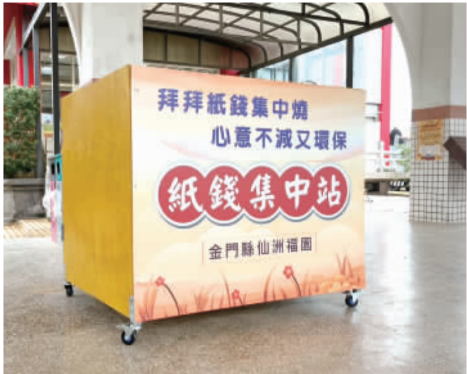
殯葬所於仙洲福園納骨堂及各公墓設服務台，置紙錢集中站。