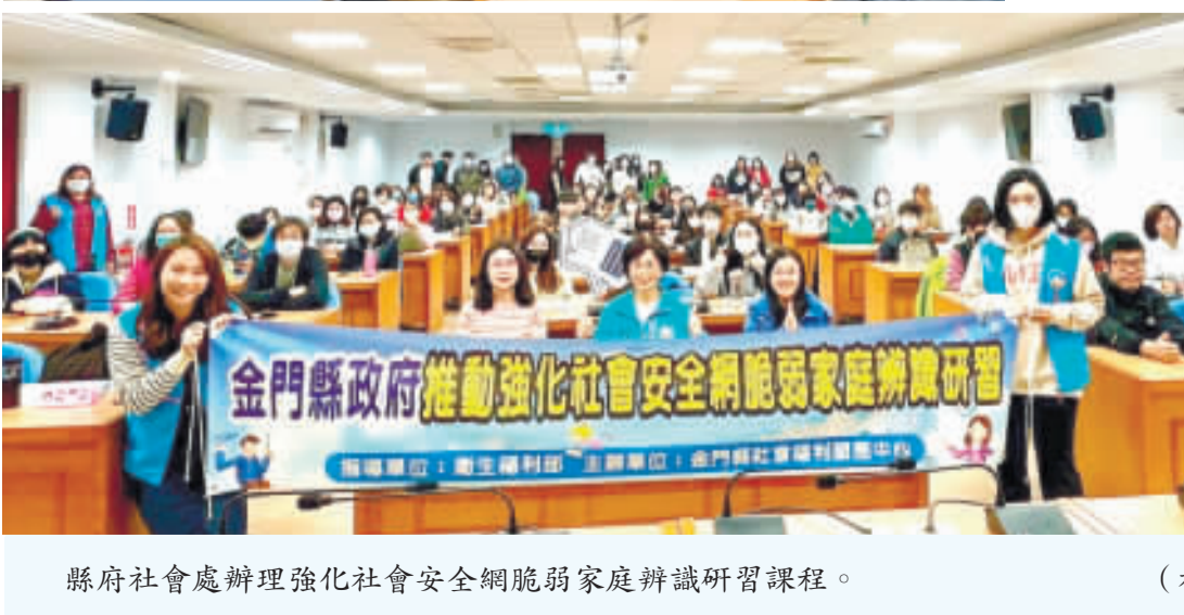
縣府社會處辦理強化社會安全網脆弱家庭辨識研習課程。

感情。榮服處表示，何志強一生的軍警生涯經歷及對文化研究奉獻故事，激勵著我們珍惜家鄉的文化，繼續傳承下去，也讓我們深深感受到他對家鄉的敬意和感激之情。 何志強出生於金沙鎮浦邊村，從小對這片土地充滿感情。年輕時，他投入軍旅服役，曾擔任鹿港中央廣播電台憲兵排副排長、憲兵203指揮部禁閉室室長等職務。在憲兵203指揮部服役時，連隊參加國軍體能戰技運動大會，榮獲戰鬥部隊手榴彈第一名、射擊第三名、刺槍術第四名，團體總成績第三名，個人亦曾獲「國防部參謀總長郝柏村」獎狀。 離開軍旅生涯後，何志強積極參與後備軍人工作，並在二一二年獲得後備軍人銅質榮譽勳章。之後，何志強考取警察，從警生涯近三十五年，曾在保安警察總隊、鐵路警察局、金門縣警察局及金門警光會館等單位服務，爲社會安全與穩定付出貢獻。 榮服處表示，何志強除在軍警生涯奉獻表現傑出，他熱愛攝影和歷史研究，利用相機記錄家鄉的風土民情，並深入研究聚落史蹟和歷史建築景觀，並經常擔任兩岸三地文化人士交流介紹金門的文化遺產，成爲文化交流的使者和引路人的角色，且保護和傳承金門傳統文化與貢獻。 何志強閒暇之餘，不忘充實自己，運用輔助