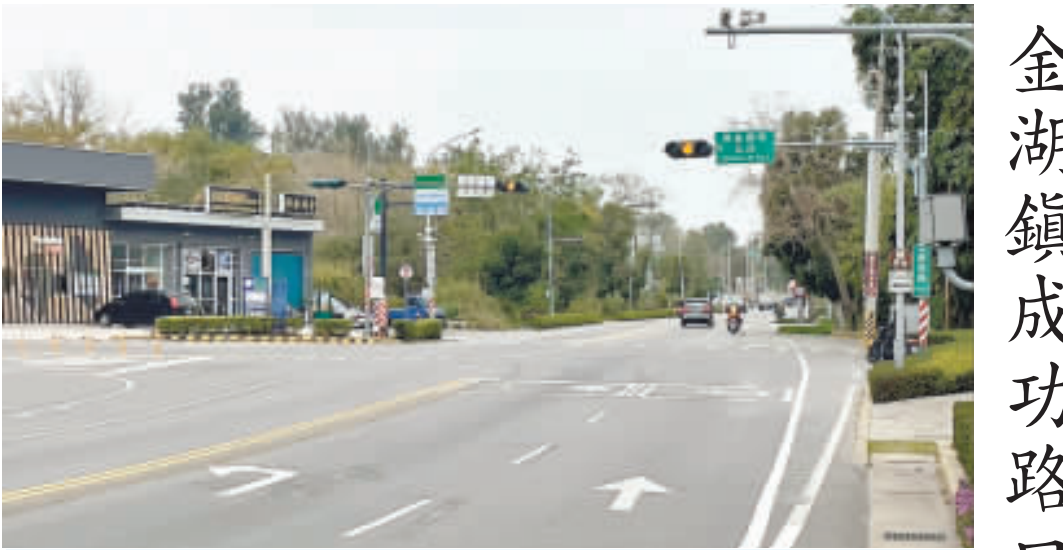
金湖鎮環島南路瓊徑路口，夏興往成功方向之車輛行駛動線，該路段增設左轉與直行車道分流，取消內側禁行機車及機車二段式左轉。

記者陳冠霖／綜合報導 縣府觀光處表示，為改善金湖鎮環島南路瓊徑路口，夏興往成功方向之車輛行駛動線，於該路段增設左轉與直行車道分流，取消內側禁行機車及機車二段式左轉，即日起並啟用路口綠燈早開時相，以改善行車交織之衝突。縣府表示，屢獲民意反映，該路段尖峰時段因左轉與直行同一車道，前方左轉車輛停車時造成後方車輛壅塞，進而降低道路之服務水準，參酌中央與各縣市，已有部分試取消機車兩段式左轉，爰邀集相關單位現勘並達成共識，環島南路成功路口於下坡路段實施車道分流，左轉車與直行車分道行駛，並取消機車二段式左轉，同時啟動綠燈早開時相，以緩解左轉與直行車輛之衝突。縣府呼籲駕駛人，行經該路段時，請確實遵循標誌、標線與號誌指示行駛，注意禮讓，共同維護行車安全。