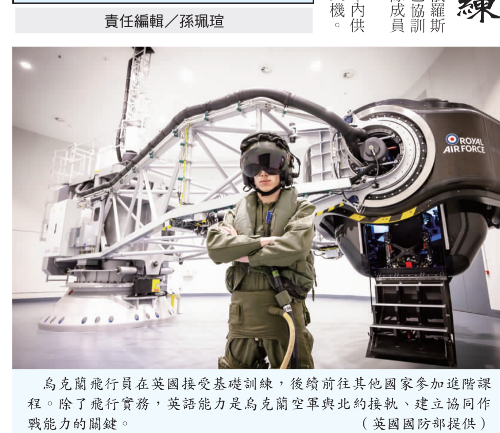
烏克蘭飛行員在英國接受基礎訓練，後續前往其他國家參加進階課程。除了飛行實務，英語能力是烏克蘭空軍與北約接軌、建立協同作戰能力的關鍵。