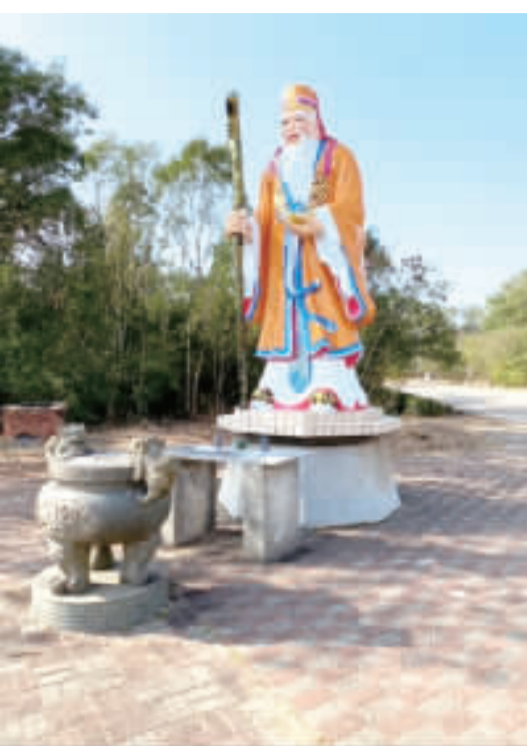
(金門縣殯葬管理所提供)

【本報記者高凡洋／綜合報導】金門縣殯葬管理處於113年3月17日，在殯葬管理所內，舉行新刷新外觀及土地公神像更新彩裝、進行重新粉飾、此舉旨在慎終追遠，尊重傳統美德，同時優化墓區整體環境。 殯葬管理所於民國86年，迄今已27年，外觀紅柱油漆已褪色，故進行重新粉飾，使納骨堂展現亮麗的新風貌，讓家屬得以在莊嚴、明亮的場所中憑弔先人。 殯葬管理處表示，此次重新刷新已經間隔20年有餘，過程中特別精選了符合傳統風格的顏色和材料，及專業的工匠，以確保神像的外觀與原本的形象相符，並注重細節，力求其煥發出新的光彩與神韻。 殯葬管理處所期透過工程完成，讓民眾減輕對墓地的環境的違和感，並藉能藉由粉妝修飾優化，親近環境，進而可以綿延親情，緬懷先人德澤。