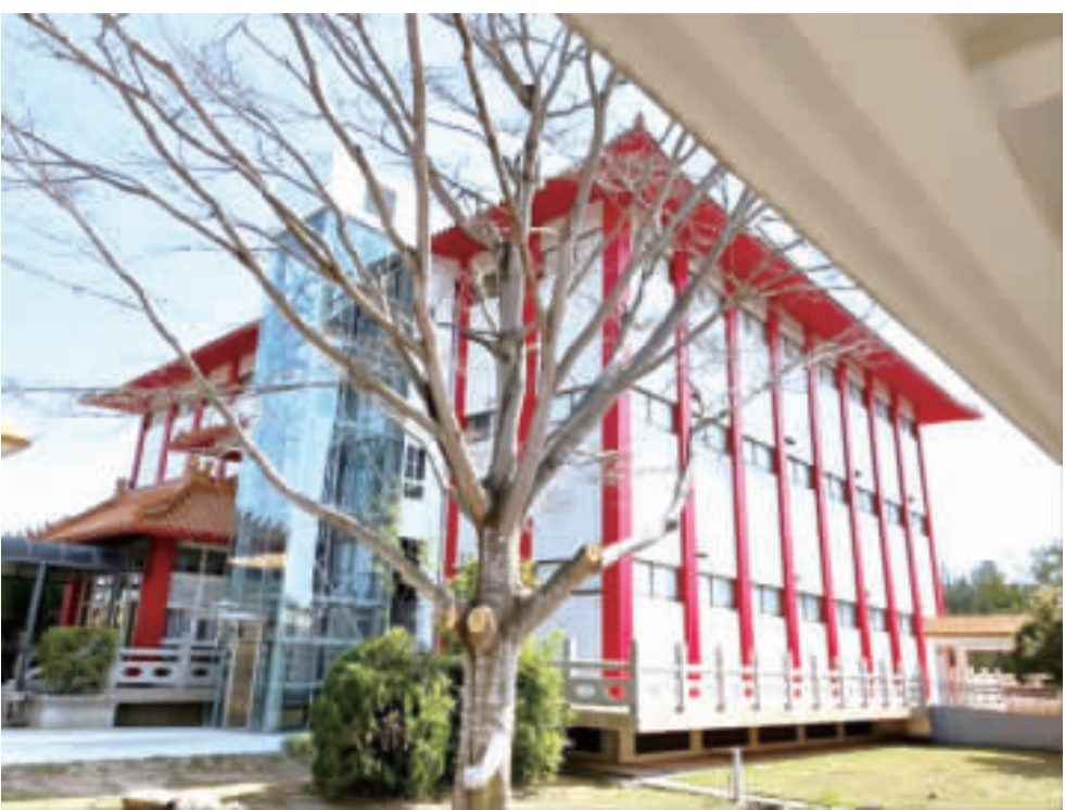
殯葬管理所進行重新粉刷。