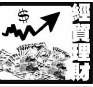
責任編輯 / 呂士昂

美國聯準會一如預期決議利率不變。即使年初通膨高於預期，官員仍預估今年將降息3碼（0.75個百分點），且上修經濟成長預測，投資人吃定心丸，刺激美股再創歷史新高。 聯邦準備理事會（FED）近日結束年度第2場決策會議，官員一致決議聯邦基金利率目標區間保持在5.25%至5.5%，符合市場預期。為壓制通貨膨脹，聯準會2年前開啓40年來最迅速加息循環，上次升息是去年7月，政策利率自此保持在23年新高點。 去年下半年美國通膨顯著緩和，投資人一度樂觀預期聯準會降息在即。結果今年初通膨僵固，聯準會是否會延後降息、減少今年降息次數，為近期華爾街關注焦點。 隨利率決策出爐的最新經濟預測顯示，官員預期年底政策利率為4.5%，意味今年將降息3碼，與去年12月上次預測雷同。與此同時，官員上修今年3年經濟成長預測，預期勞動市場保持旺盛，通膨持續朝聯準會長期目標2%回歸。 聯準會主席鮑爾（Jerome Powell）在會後記者會表示，官員認為政策利率可能處於循環頂點，經濟走勢如大致符合預期，今年某個時間點開始減少政策限制可能會是適當之舉。 美股午盤買氣旺盛，各大指數都攻上歷史新高點。道瓊工業指數終場收場401.37點，或1.03%，收在39512.13點；標準普爾500指數及那斯達克綜合指數漲幅分別達0.89%、1.25%。標普500指數首度衝破5200點大關。 負責制定利率的聯邦公開市場委員會（FOMC）會後聲明與1月底大同小異，重申官員認為在對通膨持續朝聯準會目標2%邁進「更有信心」前不宜降息。 在經濟強勁的背景，聯準會官員預期，今年底剔除波動較大食品、能源的核心個人消費支出（PCE （物價指數年增率為2.6%，低於1月的2.8%，但高於去年12月預測的2.4%。官員將今年國內生產毛額（GDP）成長預測從1.4%上修至2.1%，未來2年都是成長2%，高於去年12月的預估值。 如細看利率預測點陣圖，部分官員下修今年降息次數預測。未來2年的利率預估值上修，明年底為3.9%，2026年底為3.2%。 過去2年，美國物價漲勢一度衝上40年新高點，隨著聯準會積極升息壓抑需求，供應瓶頸疏通，通膨率逐漸朝聯準會目標回歸。官員思考何時開始降息之際展現耐心，不希望通膨威脅未完全消除時過早降息，但也不希望高利率維持太久，對經濟與勞動市場造成不必要的傷害。 鮑爾在記者會坦言，前2個月通膨確實比預期僵固，但官員早就預期通膨緩和過程可能顛簸不平。總之，現在不宜斷言去年下半年的通膨趨緩態勢已停滯，甚至逆轉。 鮑爾說：「真的不知道這是路面隆起還是別的東西，我們必須找出答案。」 聯準會下次集會是4月30日至5月1日。最新利率期貨市場行情顯示，多數投資人預期聯準會將在6月開始降息，到9月累計降息幅度將達2碼。由於美國11月將舉行總統大選，部分投資人認為聯準會將選擇提早降息，避免選戰最熱時外界認為政治干預央行運作。 （中央社）