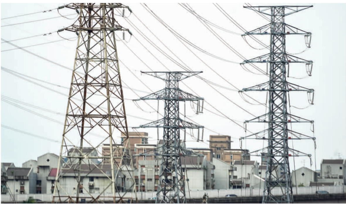
經濟部22日召開電價費率審議會並決議，4月起電價平均調幅約11%，每度電價格由新台幣3.11元升至3.45元。住宅分成4種調整級距，其中，每月用電330度以下住宅僅調漲3%、331至700度調漲5%，共約1250萬戶、占比93%。圖為台北市內湖區高壓電塔。

【中央社記者蘇思云台北22日電】經濟部電價調漲方案拍板，4月起平均電價調幅約11%。學者表示，這次針對民生用電、產業用電對不同調幅，調整方案蠻細，對通膨影響應比預期小，但預期今年全年物價仍會逾2%。 經濟部電價費率審議會今天決議，4月起電價平均調幅約11%，每度電價格由新台幣3.11元調升至3.45元。其中，住宅分成4種調整級距，每月用電330度以下僅漲3%、331至700度漲5%，共約1250萬戶、占比93%。產業用電方面，逾44萬家工業用戶調幅低於14%，並增設年用電量5億度以上「特大戶」與資料中心級距，調幅至多25%。 台經院景氣預測中心助理研究員方俊德告訴中央社記者，台經院1月估台灣今年消費者物價指數(CPI)年增率為1.9%，原本內部預估值若全面調漲1成，可能增加今年CPI年增率0.4個百分點，不過，觀察方案內容，電價調整是分成更多層、調漲狀況更細緻，預期對CPI影響會小於0.4個百分點。 方俊德指出，央行昨天則是以上修台灣今年CPI年增率到1.6%，目前看起來，也可能影響會小一點。 不過在外租屋、房東收取電費動輒每度電達5元到6元，是否可能仍會衝擊租屋族。方俊德指出，目前分租方式有不同作法，有些也會申請不同電表，還是要看個案。電價適度調漲，使用者比較有意願節電，可以讓資源配置更完善。 方俊德坦承，電價調漲對物價上漲還是有一定影響，但還是要看廠商競爭力與轉嫁幅度而定，若廠商具備高競爭力，也未必會轉嫁調漲影響。 中央大學經濟系教授吳大任受訪時表示，這次民生用電在住宅跟小商店部分，對多數人影響不會太大，工業用電也有因應不同產業狀況做調整，「這部分蠻好的」，預期對通膨影響應較為有限，但今年通膨應該還是會超過2%。 吳大任進一步分析，台灣物價除了電價影響外，也還有很多潛在因素，像是現在各國都推動淨零轉型，企業因處理碳排也會衍生其他成本，出現綠色通膨。央行總裁楊金龍日前也說，未來物價結構有可能改變，是否會從過去長期1%水準，提高到1.5%到2%區間，值得後續關注。 吳大任過去曾呼籲台電經營跟政府補貼應分開處理，讓台電經營正常一點，而非承擔這麼重的政策任務。他指出，如果政府針對弱勢族群、民生家戶，有需要補貼，再從相關部會去編預算較好，而非用現在朝回撥補台電虧損的方式進行。