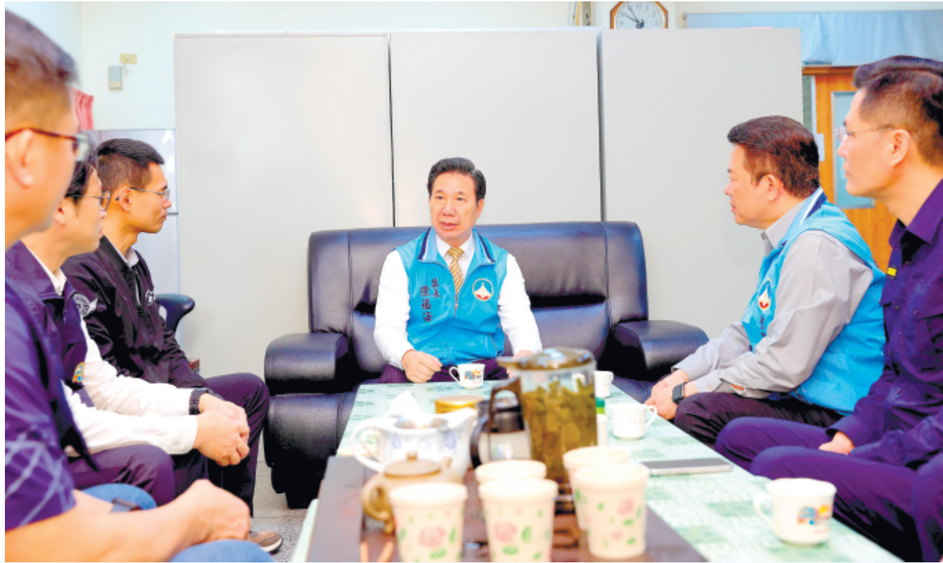
上、縣長陳福海昨前往金湖分局頒發便利商店搶奪破案獎金，表揚和慰勉有功員警辛勞；下、縣長陳福海與員警座談，期一同守護金門這塊淨土。

記者楊水詠／金湖報導 金湖地區日前發生一起便利商店搶奪案，警方在七小時內迅速破獲逮捕嫌犯移送法辦。金門縣長陳福海昨日在警察局長陳錦文陪同下，前往金湖分局頒發破案獎金，以表揚及慰勉有功員警辛勞，並肯定警方維護治安的決心，同時重申金門對暴力犯罪「零容忍」之態度，共同守護這塊淨土，讓老百姓過好日子。