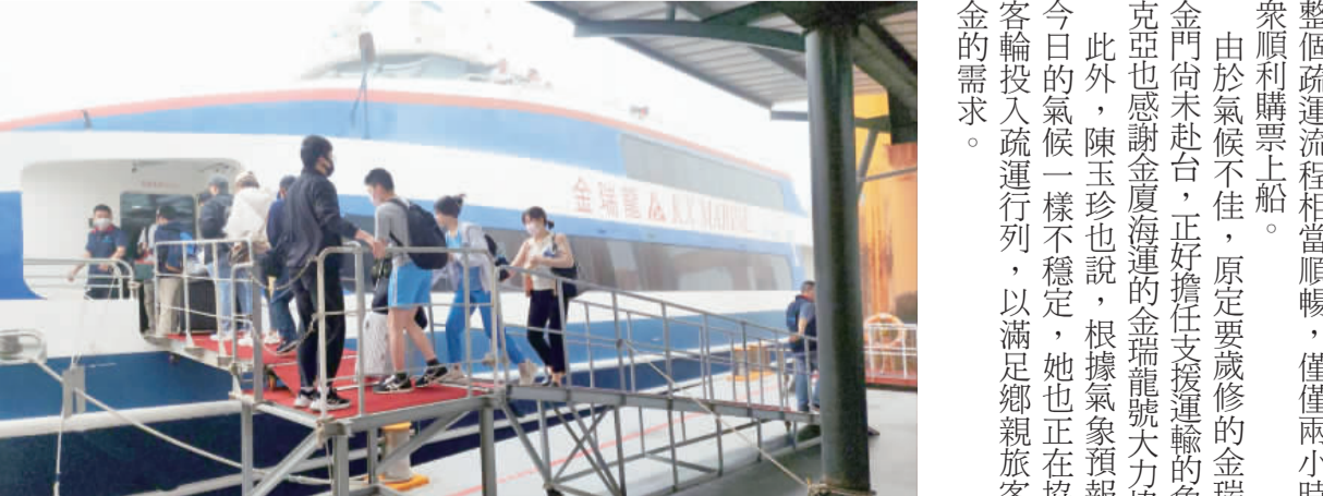
民航局啟動疏運B計畫，由金龍龍號載運兩百多人回台。

關於「金廈泳渡活動計畫」，今年由烈嶼雙口海邊游向廈門椰椰寒，金門體育會說，將持續維持100隊、200名選手，採雙人一組接力賽模式進行競賽，參與這項比賽的選手，需經過選拔產生，如有興趣的游泳愛好者及選手，皆可關注「金門海上長泳」及「金門體育會」臉書粉絲專頁，並可提出有效成績證明，或依照公開資訊報名參與選手選拔。 金廈泳渡活動規劃將在烈嶼雙口海邊至廈門椰椰寒中間點，檳榔嶼設置接力平台讓選手接力競賽，水上戒護規劃維持最高規格，採一對一進行戒護，並依照一些水域的活動安全維護計畫去執行，其他部分後續規劃，將陸續與金門縣政府會同金門體育會及廈門市進行討論，並陸續依進度於臉書粉絲專頁公告。籌備會議過程中，眾多協力單位如消防局、衛生局、CIS中央相關部會等單位陸續提出活動籌備的規畫細節與要求，為金門海上長泳暨金廈泳渡活動籌備正式展開序幕。