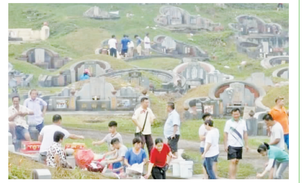
馬來西亞掃墓一景。

清明節，一個源自中國的傳統節日，在全世界多個國家和地區展現出其獨特的慶祝方式。越南、南韓、馬來西亞、新加坡等地雖然與中國擁有相似的慶祝傳統，但也發展出了各自的特色與習俗。 在越南，清明節被稱為「湯團節」，這一天民間會進行祭祀先人墓地及踏青活動。越南人在清明節進行墳墓修繕、清除雜草，並焚香燒紙，部分地區保留燃放爆竹的習俗。越南將清明節與寒食節的習俗結合，於農曆三月初三統一食用涼食，如湯圓或湯麵，以此紀念。 南韓的清明節落在公曆4月5日，儘管不是法定節日，但仍有掃墓和祭祖的傳統。南韓人在掃墓時特別強調使用鮮花來表達對逝者的思念，祭拜時會在墓前擺放酒、水果、年糕等祭品，以表達敬意。 馬來西亞的華人社群，於清明節也會進行掃墓祭祖，該節日在馬來西亞並非公共假期。當地華人通常稱清明節為「上山」或「一拜山」，在此日將墳墓及周圍環境打掃乾淨，獻上鮮花、水果，並點燃香燭，以寄託哀思和緬懷先人。 同樣以華人為主體的新加坡，清明節亦非公共假期。在新加坡，清明節主要以掃墓活動為主，這一傳統隨著社會進步逐漸簡化。每逢清明時節，新加坡華人會一家人出行，對先人的墳墓進行修整和清理，然後在親人墓前擺上酒果食品及鮮花，燃起香燭，焚燒紙錢，磕頭行禮，最後食用祭品回家。 透過這樣的比較，我們可以看到，清明節作為一個紀念先人、表達敬意和思念的節日，在不同文化中擁有共通之處。但每個國家和地區根據自己的文化背景與習俗，也給予了這個節日獨特的意義和慶祝方式。這種文化的共享與差異，不僅體現了中華文化的廣泛影響，也展示了全球多樣性文化的融合與互鑒。