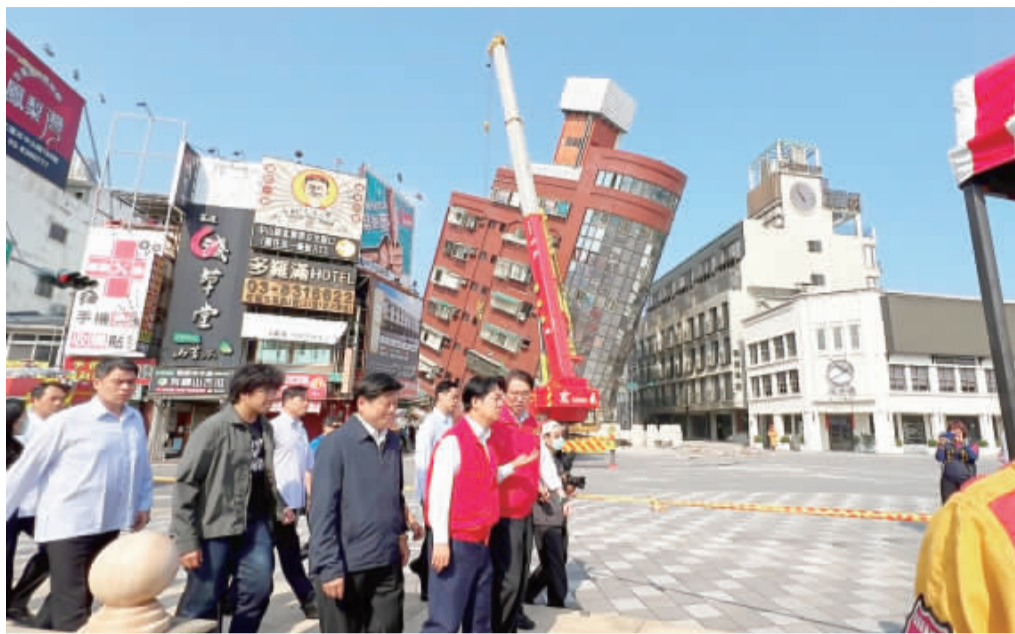
左、花蓮震災導致天王星大樓傾斜，副總統賴清德（前左4）3日前往視察災情，並做出3點指示，要以救人優先、民生需求為重，全力協助地方重建。 右、花蓮3日清晨地震，蘇花公路崇德隧道口前因大量落石，雙向交通受阻。