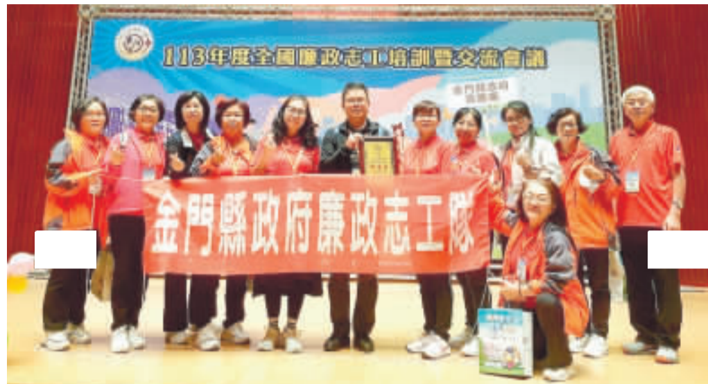
金門縣政府廉政志工隊跨海赴台參與本次全國廉政志工培訓暨交流會議，並在廉政志工創意展演活動競賽中榮獲第三名的佳績。