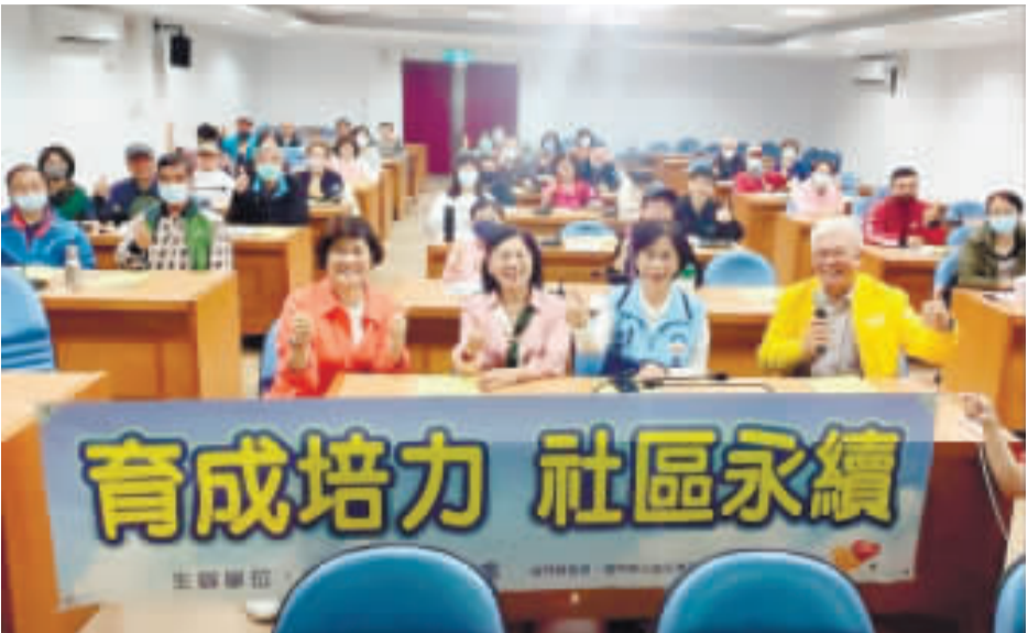
金門縣政府社會處辦理「計畫書撰寫能力養成與實作」課程。