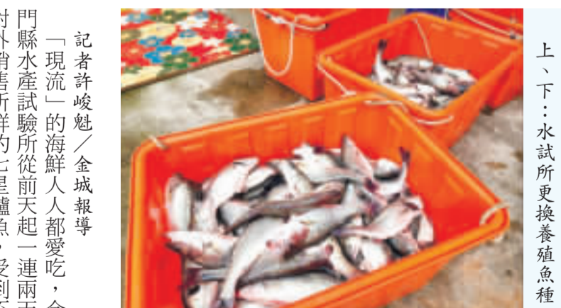
上：水試所更換養殖魚種，打撈鱸魚進行販售。

說，他對水試所養殖的魚類品質有信心，所以前後後後一共買了三十多隻。問到該如何處理？該民衆說，會先冷凍起來慢慢料理，也打算寄一些到台灣，讓在台的孩子們嘗一下家鄉養殖的新鮮鱸魚。 七星鱸魚經濟價值高，是金門重要的漁獲資源之一，而該魚種被認為有滋補、養生的作用，加上七星鱸魚肉質細嫩、刺少、味道鮮美及口感佳，且富含蛋白質、DHA等營養，因蛋白質含量十分豐富，魚肉纖維較其他肉類細密，易消化吸收，所以民間認為鱸魚是用來幫助傷口癒合的最佳食材，許多人在動手術後，或是婦女產後，都會食用鱸魚作為術後調理及補充元氣的食物來源。 七星鱸魚的料理方式一般以清蒸、紅燒及煲湯為主，也可加入中藥材進行燉煮，很多異國料理亦常選用七星鱸魚做食材，如泰式檸檬魚、鱸魚湯，甚至可作為魚片料理，方式豐富多樣，廣受到各年齡層民衆喜愛食用。