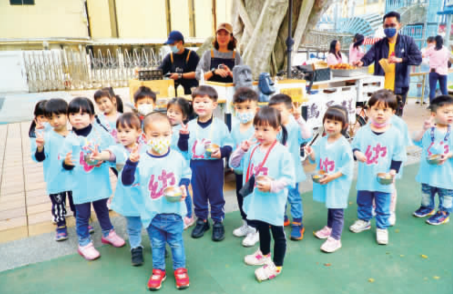
上、金湖國小家長會贈送小朋友兒童節紀念衫，鼓舞學子在各項領域都有多元傑出表現成績。 中、正義國小家長會贈送兒童節禮物，祝賀所有學生兒童節快樂。 下、城幼小朋友收到美味的雞蛋糕、爆米花，大家超開心。