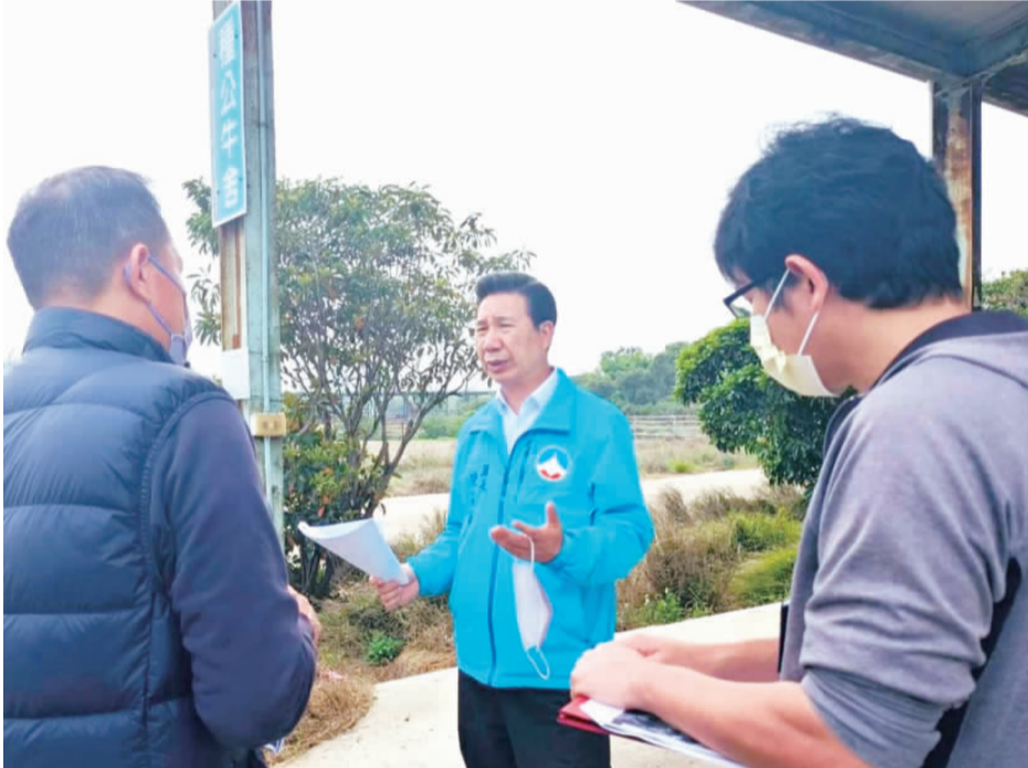
縣長陳福海日前走訪畜試所種牛牧場，與所方人員會談，了解種牛牧場使用情況，並責成畜試所朝推動畜牧專區示範場，以再現整潔美麗的金門。

記者陳麗好／金湖報導 縣長陳福海為了實現整潔、美麗、友善的金門之願景，並且改善金門畜牧產業的飼養環境，日前到金門縣畜試所，強調再調整的金門是他不斷在推進的施政方針，除責成畜試所將種牛牧場發展為畜牧專區示範場，並鼓勵支持畜牧業者朝向現代化的管理與運營。 坐落於金湖縣畜試所園區後方的種牛牧場，是一座現代化的牧場，場內空間寬敞、欄舍配置妥當，適合牛群集中管理，約可容納1,000頭牛隻，目前僅畜試所到使用效益最大化。故縣長日前也親自到畜試所種牛牧場視察，與所長李佳發等人會談中提及，也可朝公私部門相互合作，鼓勵飼養戶遷移牛群進駐，不僅可提升種牛牧場的使用效益，也能將整潔的金門之施政方針再推進一步，落實下來會是相得益彰的成果。 陳福海立即責成畜試所調查遷移住宅、村落等公有地空間，以確定適合進駐的飼養空間，並在必要時申請撥用國有地，以便將金門的放牧畜群集中管理，同時也將進一步指出，可將畜試所的種牛牧場打造成「畜牧專區示範場」，建立起飼養的標準作業流程，不僅能穩定畜養的成效，更可提供更優質的畜產品。 由於金門島的環境容納度無法承受高度污染性產業，地區的畜牧業普遍採用傳統的飼養模式。這種模式下，牛群及羊群常常四散於村裡四周，容易導致環境污染及交通問題，進而影響到環境整潔及當地居民的生活品質。為了改善畜牧業的飼養情況，對環境影響較大的業者將優先輔導，協調遷移至畜牧專區，引導產業走向現代化，並且以友善環境作為經營理念。 金門是一座美麗的小島，畜牧業也是其重要的產業之一。陳福海日前實地視察種牛牧場後也責成建設處、畜試所等相關單位研擬「畜牧專區示範場」的政策實施辦法，將有助於落實金門的整潔與美觀，同時也提升畜牧業的生產與管理效率，為環境和產業的永續發展做出貢獻。期盼在縣政團隊的輔導和畜牧業者的配合，金門將能更好地實現環境保護與經濟發展的良好平衡，以共同守護這片美好的家園。