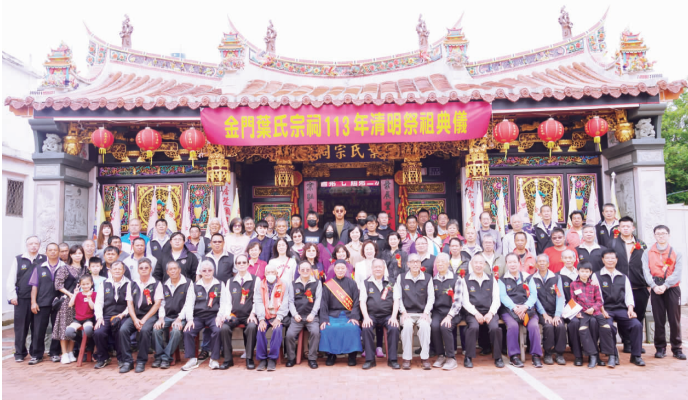
葉氏宗親會舉行清明祭祖。