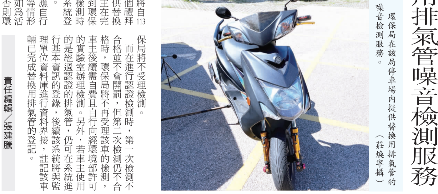
環保局在該局停車場內提供替換用排氣管的噪音檢測服務。

記者莊煥寧／綜合報導 環境部與交通部為了有效管理機車改裝排氣管所造成的擾人噪音問題，針對已經發布的「機動車輛替換消音系統認證管理規範」提供1年的緩衝期，即自113年1月1日至12月31日，若您是屬於排氣管改裝的車主，請在緩衝期內至環境部替換用排氣管噪音檢驗資訊系統 ( https://noisecar.moe.gov.tw/Carsilence/ ) 進行認證申請，後續地方環保局將會依據申請資料，以公文或電話聯絡的方式通知車主到指定地點進行檢測。而在緩衝期結束後，即14年開始，若車主使用未經認證且噪音值超標的排氣管，最高可處新臺幣5,400元罰鍰。