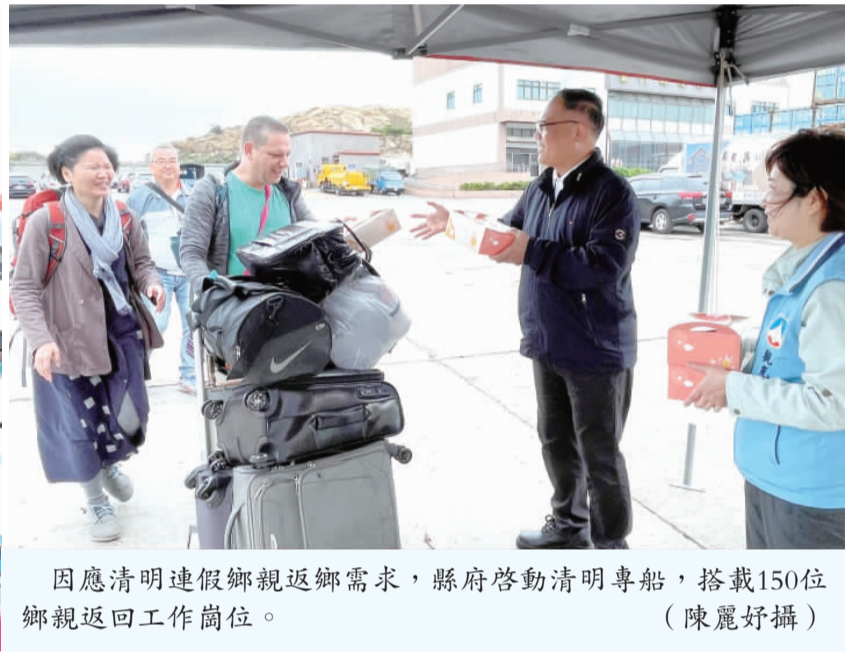
因應清明連假鄉親返鄉需求，縣府啓動清明專船，搭載150位鄉親返回工作崗位。

記者陳麗好/金湖報導 因應清明連假期間返鄉需求，金門縣政府特別加開台中至金門專船，供鄉親登記搭程，計有24位鄉親搭船返鄉掃墓祭祖。而伴隨清明連假期間返鄉需求，清明專船於昨(7)日上午11時自料羅港返航，搭載150位鄉親返回工作崗位。副縣長李文良率縣府及中央駐金單位於碼頭服務鄉親，祝福鄉親一路順遂，旅程平安。 為減輕金門旅台鄉親返鄉經濟負擔，紓解清明假期金航線空運壓力，金門縣政府加開清明專船(租賃客船航線)由台中(金門)往返1航次，自4月4日凌晨自台中港啟航，當日11時許抵達金門料羅港，共計有24位民眾搭船返鄉過節。 不過，由於受4月3日地區濃霧影響，金門機場當日航班暫停起降，為疏散滯留機場人潮，該搭船料羅港後，隨即配合民航局及航運局啟動之疏運B計畫任務，再往返台金1航次，以疏運因天候影響而受困兩地之旅客及鄉親。 而伴隨清明連假期間返鄉需求，鄉親陸續返回工作崗位，今年清明專船也依計劃於昨日上午11時許自料羅碼頭啟航，近日天氣雖為陰雨天，但飛機航班正常，故原有189位預計搭清明專船回台，最後依據觀光處統計，共計有150位民眾仍選擇搭船回台。 昨日上午10時許，副縣長李文良、觀光處副處長董雲馨、科長蔡百里、港務處處長許嘉興、以及交通部航港局專門委員顧克亞、金馬澎分署副署長熊同中等也一同於料羅港區，歡送搭船返台的鄉親，並致送每人一份餐盒，慰問搭船專船的鄉親，祝福旅途順風，期待下次返鄉。 而昨日也有些小插曲，有3位鄉親疑似錯過專車，先致電船公司後，幸運地搭乘計乘車趕到料羅碼頭，在船上等候的民眾報以掌聲，晚間的鄉親則不好意思連聲致歉，最後一同在副縣長李文良等各界歡送下，順利返回台灣。然而最後也有一車民衆就沒那麼順利，趕抵碼頭時船已離港，只能坐在計程車上一目送。