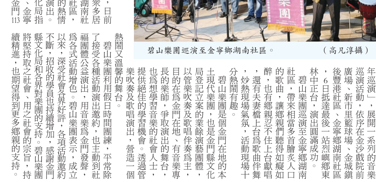
碧山樂團巡演至金寧鄉湖南社區。

記者高凡洋／金寧報導 碧山樂團吹響金門113年巡演，日前於金寧鄉湖南社區演出，吸引眾多居民熱情參與；碧山樂團表示，湖南社區是個非常棒，又有活動力的社區，感謝社區理事長以及附近居民的熱情參與，希望往後還有機會再來演出。 由碧山樂團主辦，金門縣文化局指導，金城鎮公所、金沙鎮公所、金寧鄉公所協辦的「碧山樂團吹響金門113年巡演」活動，在金門各地展開，共計11場演出，目前已圓滿結束。 碧山樂團利用假日時間團練，平常除了接受各種演出演出邀請外，也主動到社區公益活動，用音樂為金門發聲，為各式活動增添色彩。碧山樂團表示，成立以來，深受社會各界好評，各項活動邀約不斷，招收的學員也持續增加，感謝金門縣文化局和各鄉鎮對樂團的支持。碧山樂團將堅持取之社會、用之社會的宗旨，持續精進，也期望得到更多鄉親的支持。