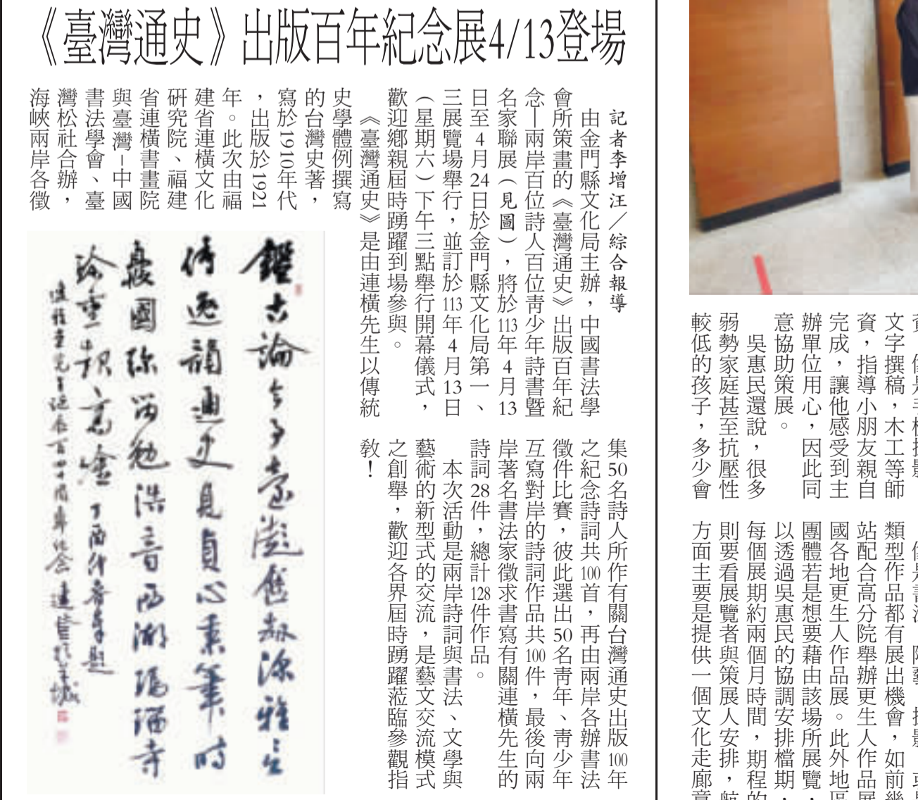
《臺灣通史》出版百年紀念展4/13登場

《臺灣通史》出版百年紀念展4/13登場 記者李增汪/綜合報導 由金門縣文化局主辦，中國書法學會策畫的《臺灣通史》出版百年紀念展(見圖)，將於13年4月13日至4月24日於金門縣文化局第一、三展覽場舉行，並訂於13年4月13日(星期六)下午三點舉行開幕儀式，歡迎鄉親屆時踴躍到場參與。 《臺灣通史》是由連橫先生以傳統史學體例撰寫的台灣史著，寫於1901年。此次由福建省連橫文化研究院、福建省連橫書畫院與臺灣、中國書法學會、臺灣松社合辦，海峽兩岸各徵