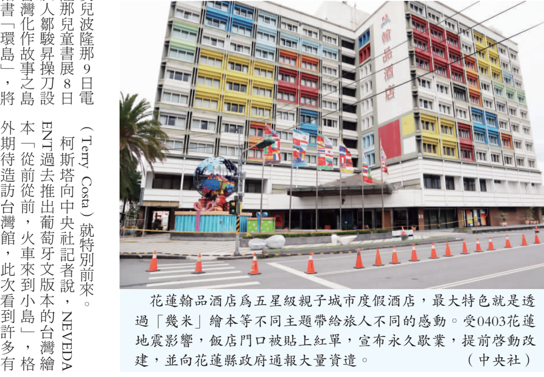
花蓮翰品酒店為五星級親子城市度假酒店，最大特色就是透過「幾米」繪本等不同主題帶給旅人不同的感動。受0403花蓮地震影響，飯店門口被貼上紅單，宣布永久歇業，提前啟動改建，並向花蓮縣政府通報大量遣送。（中央社）