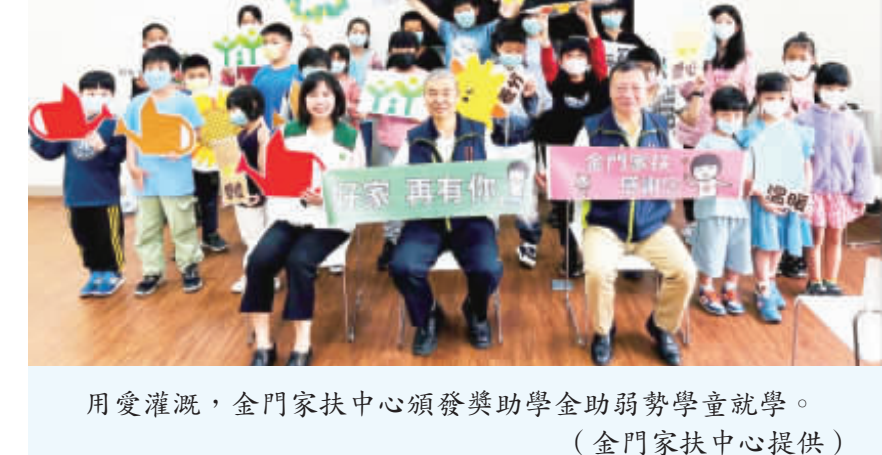
用愛灌溉，金門家扶中心頒發獎助學金助弱勢學童就學。