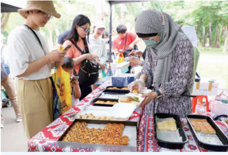
「2024 Eid-al-Fitr in Taipei 尋味台北 齊賀開齋」活動14日在大安森林公園登場，吸引不少民眾參觀市集，體驗穆斯林文化及品嚐美食料理。（中央社）

【中央社記者陳昱婷台北14日電】慶祝齋戒月結束，台北市開齋節活動今天在大安森林公園登場，現場安排清真市集及舞台表演，吸引約3萬人次遊客共襄盛舉。市長蔣萬安說，將持續致力打造穆斯林友善環境。 台北市觀傳局今天在大安森林公園舉辦「2024 Eid-ul-Fitr in Taipei 尋味台北齊賀開齋」活動，安排體驗活動及舞台表演，還設置清真市集，販售異國料理、特色文化小物及穆斯林日常生活用品。 台北市長蔣萬安致詞表示，台北市是個友善、多元的共融城市，不僅有慶祝開齋節的活動，也致力於打造穆斯林友善環境，包含醫院、旅館與餐廳在內，已累計輔導超過70處場域獲得穆斯林友善認證。 觀傳局統計，今天約有3萬人次在大安森林公園共襄盛舉，未來將持續推動穆斯林友善認證，爭取更多國際旅客來到台北旅遊，帶動觀光發展。 此外，觀傳局表示，去年攜手全家便利商店、中國回教協會設置「穆斯林友善商品專區」後，目前台北市已有20間全家設有專區或南洋酸辣湯「馬尚煮」，讓穆斯林旅客都能安心享用、就近採買。