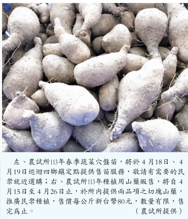
左、農試所113年春季蔬菜穴盤苗，將於4月18日、4月19日巡迴四鄉鎮...