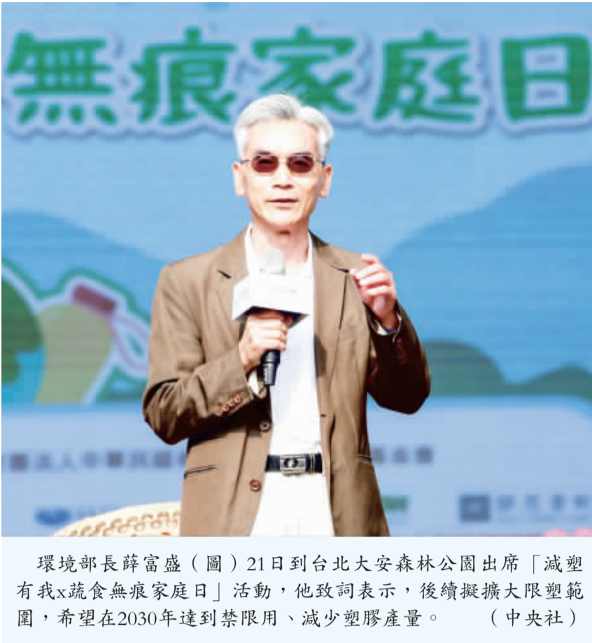
環境部長薛富盛(圖)21日到台北大安森林公園出席「減塑有我x蔬食無痕家庭日」活動，他致詞表示，後續擬擴大限塑範圍，希望在2030年達到禁限用、減少塑膠產量。

【中央社記者張雄風台北21日電】環境部今天表示，台灣從2002年開始推動限塑，當年購物用塑膠袋約使用20億個，去年降至9億餘個；後續會擴大限塑範圍，希望在2030年達到禁限用、減少塑膠產量。 環境部攜手台北市府及民間團體今天在大安森林公園舉辦「減塑有我x蔬食無痕家庭日」活動。 環境部長薛富盛致詞時表示，台灣從2002年開始推動限塑，陸續選了14個場域限制使用塑膠袋；2021年一整年購物用塑膠袋使用約90億個，在各界努力下，去年降至約90億個。 薛富盛說，現在減塑達到了某一個程度的瓶頸，環境部擬推動限塑範圍擴大，也希望在2030年達到禁限用、減少塑膠產量，雖然預計會對產業及生活有很大的影響，但今年聯合國全球塑膠公約將在年底公布，台灣身為負責任的國際一分子，也會跟隨世界的腳步。 台北市副市長李四川表示，這兩天下了大雨，受到溫室效應影響，現在是3小時內下完3天的雨，1小時內下完1天的雨，做多少的水利系統都跟不上。 李四川呼籲減塑從衣食住行做改變，在傳統市場，要買湯湯水水的食物，沒有塑膠袋不方便，但為了這個地球，就是要改變習慣；台北市75%排碳是來自自用電、20%交通、5%是垃圾焚燒，因此不只要減塑，也要節約能源。 李四川舉例，市府每年編新台幣2億元多針對ESG，各局處編預算執行，例如登記悠遊卡可以納碳存摺、綠建築可以減低利率等。 環境部表示，在4月地球日暨6月世界環境日串聯成「環境月」，期間將持續辦理相關地球日及世界環境日的活動，邀請民眾走到戶外接觸大自然，感受美好的環境。