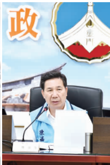
金門縣長陳福海主持縣府前瞻基礎建設計畫暨離島建設基金補助計畫一三三年度第一季執行情形檢討會議。

記者楊水詠／縣府報導 金門縣政府前瞻基礎建設計畫暨離島建設基金補助計畫一三三年度第一季執行情形檢討會議，由縣長陳福海主持，邀集相關局處單位逐案追蹤預定與實際進度及結案期程。同時，縣長陳福海指出執行前瞻及離島計畫應提前看出盲點，超前部署，掌握執行進度與結案期程。在向中央爭取預算時，應以彰顯計畫的價值和故事之重要性，以彰顯計畫的價值和故事之重要性。 在討論前瞻基礎建設計畫時，承辦單位行政處報告前瞻基礎建設計畫2.0(110-113年)總經費五千萬元以上列管計畫計九案，今年度第一季執行情形統計，本季前已解除列管計一案、進度正常計八案(無進度落後計畫)。陳福海表示，施政建設要有優先順序，並且要有系統性地思維和管控。他強調，該建設的固然是要做，但在進行工程建設時，必須更加謹慎地看待財政紀律，才能有效地管住支出，避免過度浪費資源。此外，從整體計畫和策略出發，制定配套的方針和資源配置，以確保資源的有效運用和預算的合理分配。 由此，地方政府必須提前做好規劃和準備工作，以確保計畫的順利執行和推動。陳福海指出，透過提前看出盲點、超前部署，不僅能有效掌握執行進度與結案期程，更能夠凸顯執行計畫的價值和意義，為地方帶來更多正面影響和發展機會。在爭取中央預算的過程中，陳福海強調呈現地方特色和感人故事的重要性，透過案例說明與地方故事，展現出計畫的價值和對當地居民的影響，讓中央政府能深刻了解地方需求並給予相對應的支持。 至於離島建設基金補助計畫四年總經費五千萬元以上列管計畫計六案，今年度第一季執行情形統計，進度超前計一案(維護傳統建築風貌補助計畫)、進度正常計五案。另，去年度經費保留計畫計二案(金門縣廢棄物處理及循環再利用計畫、藝文特區雙乳山坑道軍事古蹟修復規劃設計及工程保存計畫)，因涉及到縣府整體執行進度及離島基金執行率之績效評核與計畫滾動檢討激勵獎金額度，保留之經費請儘速執行完畢，並辦理結報。 此外，去年度離島建設基金補助計畫，縣府提報修正計畫計三案(維護傳統建築風貌補助計畫、乳牛智慧化飼養暨乳牛專區修繕計畫、金門縣畜牧產業廢棄物、汙染物暨飼料粉混合再利用計畫)，經審查核定共爭取離島建設基金新臺幣三千七百二十七萬七千元。依據第六期離島綜合建設實施方案滾動檢討機制，今年度研提新與計畫計十六案，業於一月份提報行政院辦理審議及核定，以爭取離島建設基金及中央經費補助。 縣長陳福海最後表示，縣府團隊與中央對接渠道仍然太過薄弱，很多中央預算，尤以國發會牽涉很多離島建設基金，只要提出具體計畫與感動的故事，相信中央一定會支持予以離島建設基金的補助。未來，離島建設基金補助計畫與相關部會的對接，務必將層級提高，由業務單位的處長進行聯繫與會議，甚至連他都願意親自跑一趟，請相關單位繼續致力於執行前瞻及離島設計計畫，對於地方發展具有極為重要的意義，讓金門發展更向前邁進與美好。