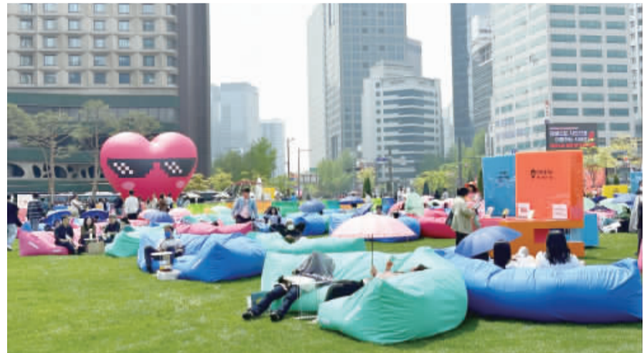
韓國首爾市政府舉辦的露天圖書館活動，為提升民眾閱讀體驗，今年在首爾廣場設置特地訂做的2到3人用大型懶骨頭沙發，以及陽傘等設備。(中央社)

【中央社記者王承中台北21日電】傳國民黨智庫因財源不足須精簡人力，國民黨主席朱立倫今天表示，民進黨執政後用不當黨產條例封鎖國民黨，也無法取得財源，只有透過轉型、改革，讓智庫輕量化並結合民間資源。 國民黨近期持續進行內部組織改革，包括整併黃復興黨部，以及派任多名黨籍立委擔任地方黨部主委，以達到內造化等目標。現在也傳出因財源不足，國民黨智庫「國家政策研究中心基金會」須精簡人力，預計將大砍2/3人力。 朱立倫今天前往新北市中和區參加2024緬甸新年浴佛活動受訪表示，智庫設置最重要的目的就是希望能夠為國家培養好人才，同時設計出好的政策。 他指出，民進黨執政後用不當黨產條例封鎖國民黨，也無法取得財源，只有透過轉型、改革，讓智庫輕量化並結合民間資源。 朱立倫表示，今年預計減少1/3開銷，明年會繼續往下減，讓智庫能夠可長可久，結合學界、持續提供立法院黨團、地方對政府最好的政策。 對於國民黨立法院黨團總召集人蔣經國近期將率黨籍立委訪中，引發爭議。朱立倫表示，傳聞其從2月開始就有跟他溝通，此行主要是針對民眾反映的問題，尤其是最近大家關心的兩岸旅遊、農漁產品問題，相信立委訪陸一定能充分反映民意，解決問題。