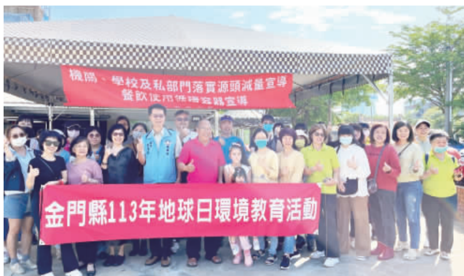
左、金門縣環保局結合金寧鄉四埔社區辦理「綠蔬行動趣·減塑新生活」環境教育活動；右、參與者聚集在自由烘培坊DIY，運用在地食材，製作出健康美味的鹹派料理。

埔後的自由烘培坊DIY，動手製作烘培美食，運用四埔社區自行栽種的在地食材，加上烘培坊COO老師的指導下，製作不影響環境且又營養美味的鹹派料理，參與者從過程中增加對烘培的興趣，也提高對環保意識的認識，同時體驗到蔬食生活的魅力，學習如何減少食物的浪費。 環保局表示，本次課程結合知識性與體驗課程，期望民眾透過吃當季食材，認識在地食材，在親近大自然的同時，更加珍惜金門這片土地及食物資源，進而從生活中落實惜食行動與減塑飲食。另外，配合縣府近期推動政策「自掃門前雪計畫」，呼籲民眾一起關心環境問題，針對亂丟垃圾、廢棄車輛、社區村落內積堆廢物、公共開放空間綠美化等現況課題，鼓勵全島協力合作清理及認養社區鄰近公共空間場域，多多美化種植花草樹木點綴市容，並期望鄉親亦一同從整理自身周遭環境做起，達成「整潔金門·永續美麗島嶼」的目標。 現場參與活動的民眾表示，透過農園體驗與製作鹹派料理的樂趣，做中學的課程，大人小孩都玩得不亦樂乎，同時體會到由「土地」與「食物」串連起的幸福感，也更加瞭解珍惜食物的重要性。