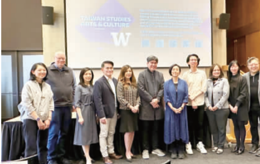
台北流行音樂中心首度將珍藏的近50件作品移展西雅圖，用音樂開啓國際文化交流。

【中央社記者張欣瑜西雅圖24日專電】台灣流行音樂陪伴許多人成長，歷經世代轉變，反映台灣多元且迷人的身世。台北流行音樂中心首度將珍藏的近50件作品移展海外，今天在搖滾樂重鎮西雅圖盛大開幕，用音樂開啓國際文化交流。