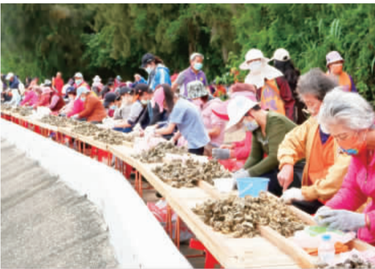
「千人剝蚵」將於27日登場。

記者高凡洋／金寧報導 2024金寧鄉石蚵文化季活動預計5月4日、5月5日兩日，於金門大橋慈湖湖濱廣場舉行，以石蚵做為活動主軸，推廣金寧鄉特色農產品發展農家美食創意市集，並以多項孩童遊藝遊樂器材規劃好玩的遊樂場親子同樂，結合在地文化、食農創意市集、親子遊戲嘉年华、藝術表演等四大推廣面向，藉由不同的體驗活動，建立人與土地及文化美學的連結，活動於下午2時開始一連串的表演及精彩節目持續至晚間9時結束。 石蚵文化季的經典傳統「千人剝蚵」活動，將於4月27日下午4時於古寧頭北山出海口海堤盛大舉行，歡迎民眾踴躍參加，採自由入座、額滿為止。 金寧鄉公所表示，本次活動以「石蚵」為主題規劃出一系列相關活動，除了經典傳統千人剝蚵外，同時規劃了多場探訪石蚵林體驗。石蚵作為金寧傳統經濟特色產業，透過近年流行的食農教育，大小朋友們一同化身一日蚵農，在在地農民的帶領與解說下親自體驗，盼能藉此推廣及傳承傳統文化，讓更多人看見這個寶貴的無形資產。本次活動也將本鄉特色景點進行串聯，設計為期一個月的景點推薦員「打卡週週抽活動」，鼓勵在地民眾與外地遊客一同來金寧鄉走走。 5月4、5日戶外活動兩日，另有小朋友喜歡的大型遊樂設施及多項親子同樂體驗活動。表演方面除了在地團體，也準備了小朋友喜愛的哥哥姐姐唱跳秀、魔術等，更特別邀請台灣知名特技火舞團帶來精彩刺激的視覺饗宴。另外，本次更推出新活動「石蚵大胃王」品嘗在地美食一同挑戰極限。除了海軍石蚵麵線等來挑戰，也有現烤鮮蚵體驗、在地創意美食料理會等保證讓大眾品嚐到滿滿多樣美味的石蚵料理。 金寧鄉公所指出，為因應活動可能帶來之人潮與車輛出入，統一管制車輛經由北山古洋樓經南山路至北山出海口沿路單向停車，實施交通疏導管制工作，以維持道路之行車順暢及人車安全。也歡迎民眾搭乘接駁車，接駁車為活動當(27)日下午3時至晚上18時30分運行，人滿即發車，接駁站1為古寧頭紀念園區、接駁站2為南山路口。另大橋慈湖湖濱活動會場規劃有停車場，另安排工作人員接管及指揮車輛行車動線引導等，呼籲前往參與之民眾及遊客配合交管人員及員警之指揮。 鄉長楊忠俊表示，一年一度的石蚵文化季活動是金寧鄉每年的重頭戲，這幾年也不斷的調整與創新活動內容，期望透過更多元更豐富的活動帶來更好的效益，一系列活動包含千人剝蚵、蚵田採蚵體驗(親子體驗為主)、蚵殼藝術創意競賽、石蚵料理饗宴、烤蚵體驗、蚵農挑戰關關、現場剝蚵體驗，讓民眾遊客們一起體驗一日蚵農，一剝蚵樂趣，藉由活動帶動地方產業的發展，也歡迎民眾來石蚵的故鄉金寧作客，邀請鄉親、遊客熱情參與。