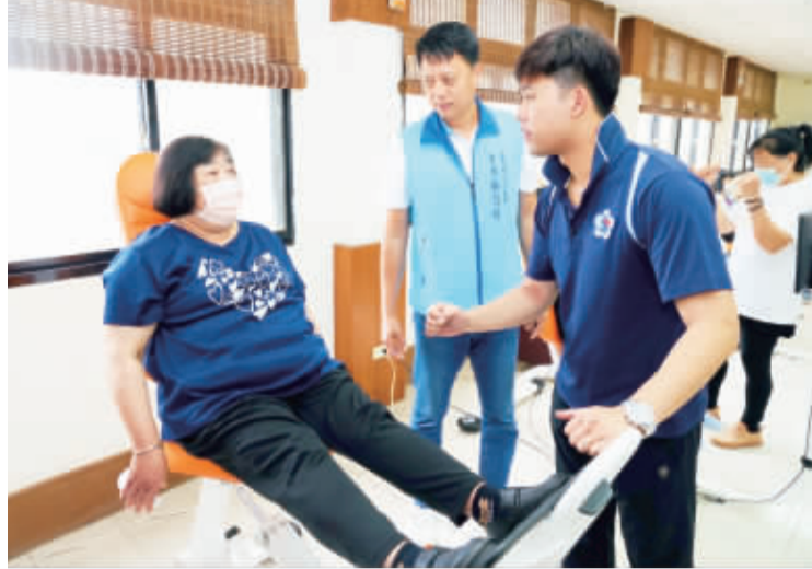
右、金湖鎮「銀髮俱樂部」日前在金湖鎮圖書館舉行開幕典禮；左、民眾現場試用健身器材。