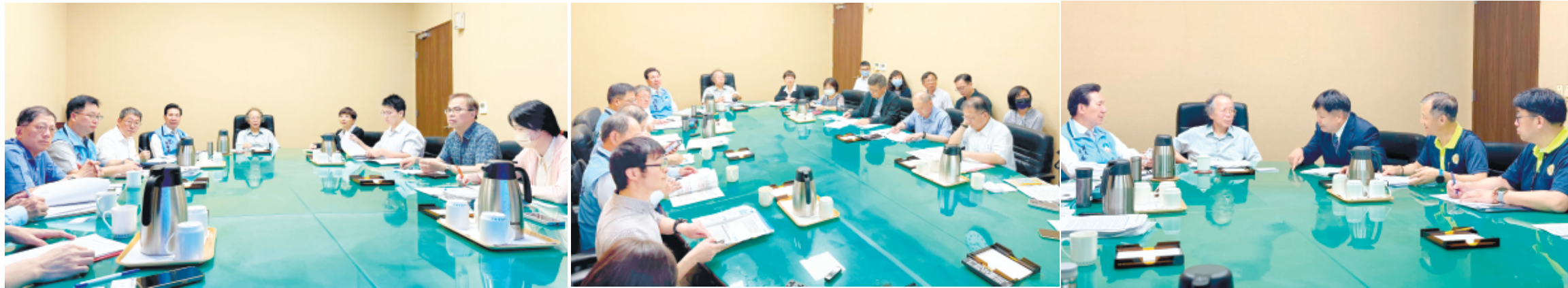
縣長陳福海率縣府官員赴行政院，在行政院政務委員張景森主持下召開協調會議，分別與相關部會官員討論金門財力級次分級（左）、自來水廠財務問題（中）、金門榮民之家（右）等議題。