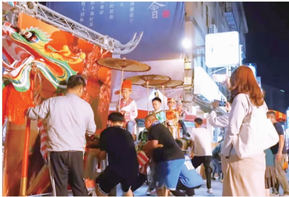
金城鎮公所每週在北鎮廟都有各境特色陣表演，歡迎前往體驗。

【記者許峻魁／綜合報導】金門鎮最近的夜晚很熱鬧，一年一度的金城活潑迎城隍觀光文化季活動，已經在四月二十日正式開跑了，金城鎮公所表示，在五月十九日（農曆四月十二日）城隍爺出巡繞境以前，鎮公所每週都會推出特色表演，歡迎民眾到現場體驗，感受道地的金門宗教習俗。 金城鎮公所表示，在文化觀光季活動期間，將有地方特色陣表演活動，第一週的特色表演由北門境特色陣表演，昨日登場的是天震堂醒獅團、北門十二婆姐、天震堂龍獅隊、昊天官將首等陣頭體驗，小朋友也可以在現場體驗蜈蚣座妝人，以及欣賞傀儡戲的表演。 金城鎮公所表示，接下來