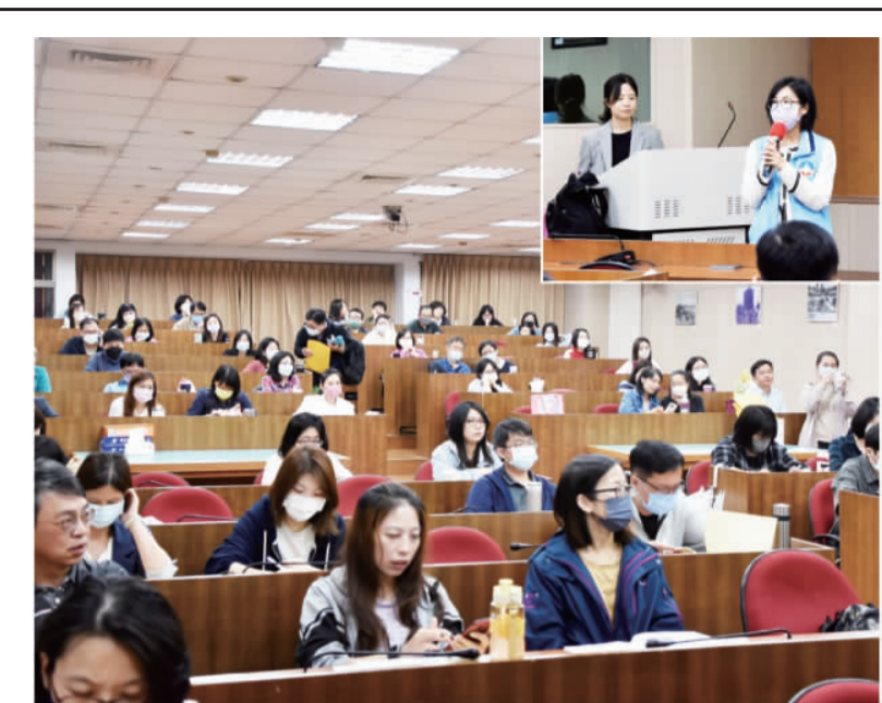
金門縣政府與勞動部合辦「113年度職場平權及性騷擾防治研習會」。