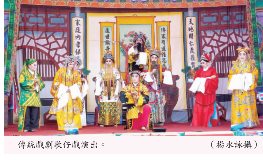
傳統歌仔戲演出。

記者楊水詠／金湖報導 自昨(廿七)日起，料羅順濟宮舉行慶祝六姓王府誕辰醮，今天作醮慶祝註生娘娘誕辰，為一連三天醮慶天上聖母一〇六四週年聖誕千秋揭開序幕。為慶祝天上聖母一〇六四週年聖誕千秋，料羅順濟宮管委會和村民從前幾天即展開醮慶籌備工作，先在金港路兩旁豎立彩旗，向過往人車宣告農曆三月廿三日順濟宮即將來臨和舉辦醮慶活動。在昨天，順濟宮管委會也搭起醮慶活動，預告在天上聖母誕辰暨醮慶慶典期間，並將有傳統歌仔戲公演演出活動。