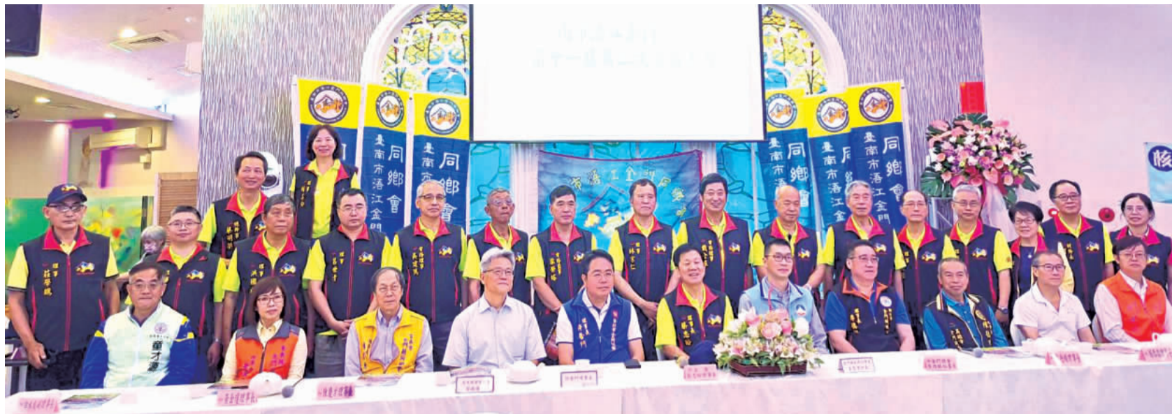
臺南市濱江金門同鄉會舉辦「第11屆第2次會員大會」。