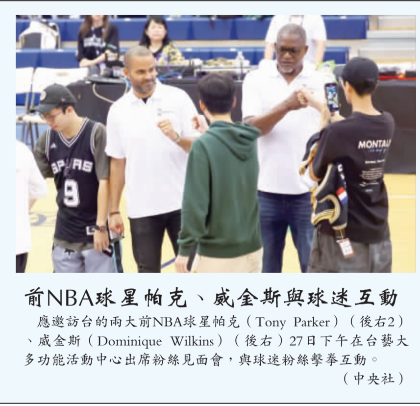
前NBA球星帕克、威金斯與球迷互動。應邀訪台的兩大前NBA球星帕克(Tony Parker)(後右2)、威金斯(Dominique Wilkins)(後右)27日下午在台藝大多功能活動中心出席粉絲見面會，與球迷粉絲擊拳互動。

【中央社東京27日綜合外電報導】日本製藥公司「極東」因生產成分不足的胃腸藥「正露丸」後遭假數據出貨，昨天遭富士縣政府勒令停業。已知極東改裝藥品試驗結果長達30年之久。 日本讀賣新聞報導，截至目前為止尚未接獲富士縣內有民眾健康受損通報。富士縣政府昨天祭出的停業命令將從4月30日起生效，停止極東製造藥品23天，及停止販售22天。 名為「正露丸」的藥品，在日本有數間製藥公司各自生產製造。富士縣政府表示，根據日本國家標準，極東在製造的「正露丸」所需必要成分不足情況下，卻提出造假的藥品試驗結果後出貨。 富士縣政府是在2021年夏天進行突擊檢查時，發現極東在生產方面有不完備之處，極東當時進行了516萬份藥品的自主回收作。極東表示，至少從30年前就持續竄改藥品試驗結果。 極東昨天透過聲明表示，過去一直以來都欠缺遵守法令的意識，由表對相關人士表示歉意。北日本放送(KNH)報導，極東昨天受訪時除表達歉意外，也表示未來將徹底查明原因，研議防止類似情況再度發生的對策。 富士縣內製藥公司近年接連發生製造過程有所不當的情況，這次的極東遭勒令祭出行政處分，是近5年來第7例。 北國新聞報導，極東生產的「正露丸」等4項胃腸藥，還被發現採購原料時未進行品質試驗，而是直接使用原料製造商試驗數據的違反法令行為。