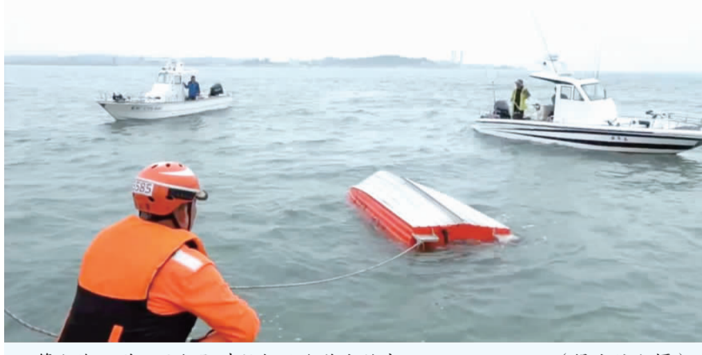
第九海巡隊巡防艇即時救起兩名落水釣客。

記者楊水詠／金湖報導 金門大橋靠近小金門段海域，昨(廿七)日傳出有一艘波特船翻覆及二人落水事件；正在金烈水道巡邏的金門第九海巡隊21135巡防艇即時趕赴救起。兩名釣客經送醫後，有驚無險，挽回寶貴的生命。第十二巡防區指揮部表示，民衆若遇有緊急危險時，可撥打一一八海巡服務專線。