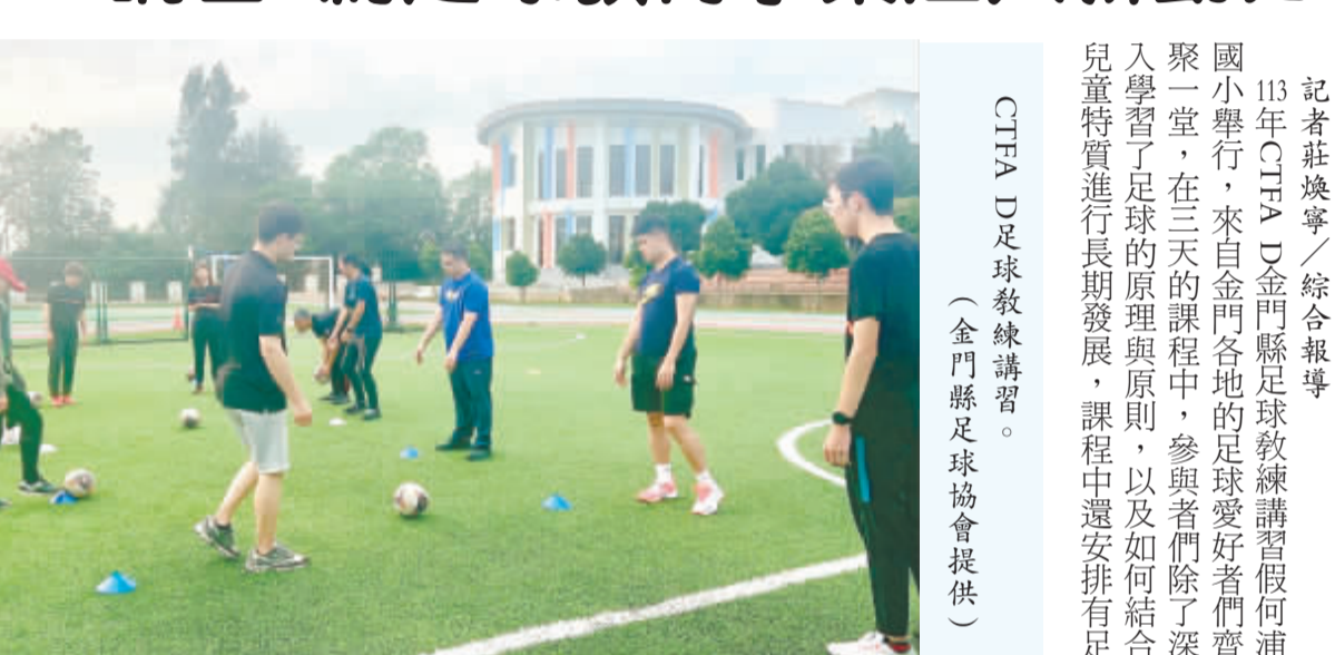
CTFA D足球教練講習。

記者莊煥寧／綜合報導 113年CTFA D金門縣足球教練講習假何浦國小舉行，來自金門各地的足球愛好者們齊聚一堂，在三天的課程中，參與者除了深入學習了足球的原理與原則，以及如何結合兒童特質進行長期發展，課程中還安排了有足球兒童特質進行長期發展，課程中還安排了有足球兒童特質進行長期發展，課程中還安排了有足球兒童特質進行長期發展。