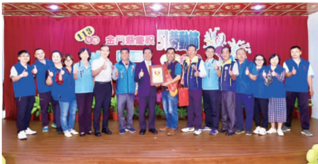
金門日報社產業工會獲選為13年金門縣優良工會。