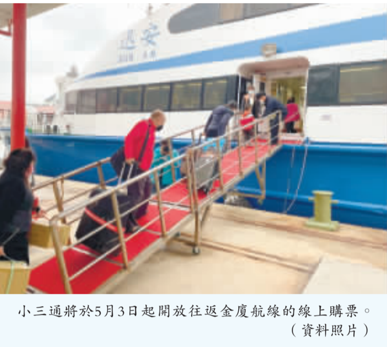
小三通將於5月3日起開放往返金廈航線的線上購票。(資料照片)

記者陳冠霖／綜合報導 金門縣車船處表示，自去年12月1日開放小三通金門前往廈門及泉州單程航線票上線，迄今已為期4個多月，為進一步提升售票服務，將於5月3日起開放廈門航線的線上購票，以方便往返金廈小三通的船票都可以線上預購，歡迎民衆多加利用。 金門縣公共車船管理處兼管滄江輪渡有限公司表示，自12月1日開放小三通前往廈門及泉州單程航線票，線上售票迄今已為期4個多月，為進一步提升售票服務水準，現階段將於13年5月3日起開放廈門航線線上購票。 車船處表示，線上開放售票時間為每月月底前由交通部航港局公布隔月航線表後即開放購票，售票期限及退票期限於航線表開航前三日中午12點截止，本階段每日提供廈門航線客船及泉州航線20張預購船票，倘系統顯示線上票額已售完，請依循原有實體票模式改洽船公司或碼頭現場售票窗口諮詢購票事宜。 車船處表示，詳情請上臉書搜尋金門縣公共車船管理處粉絲專頁、滄江輪渡有限公司售票官網（ https://ticket.wjyangferry.com.tw ）或至手機App搜尋下載「金門小三通」即可進行線上購票作業。