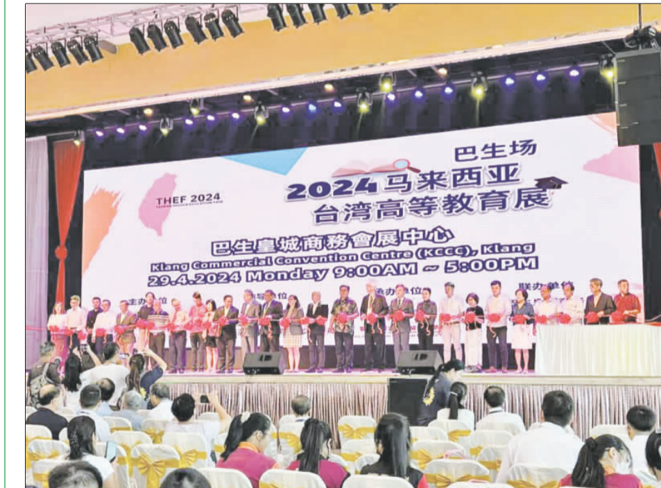
2024 馬來西亞臺灣高等教育展（巴生場）花絮。