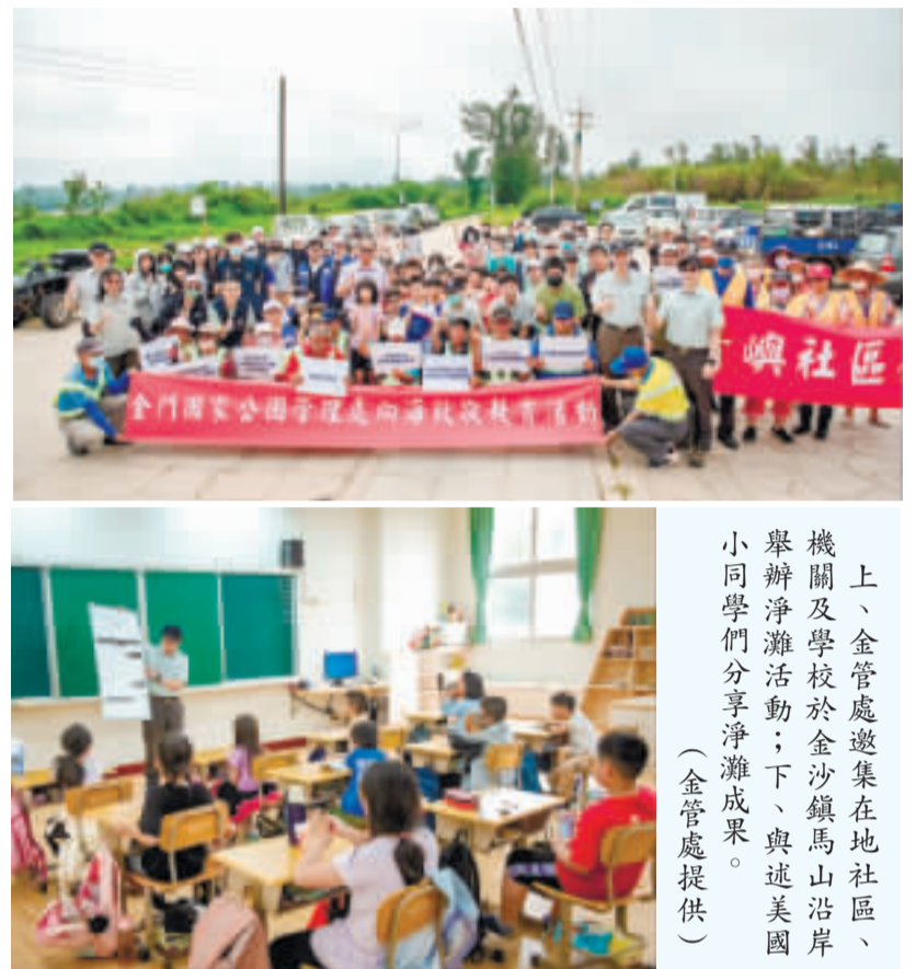
上、金管處邀集在地社區、機關及學校於金沙鎮馬山沿岸舉辦淨灘活動；下、與連美國小同學們分享淨灘成果。