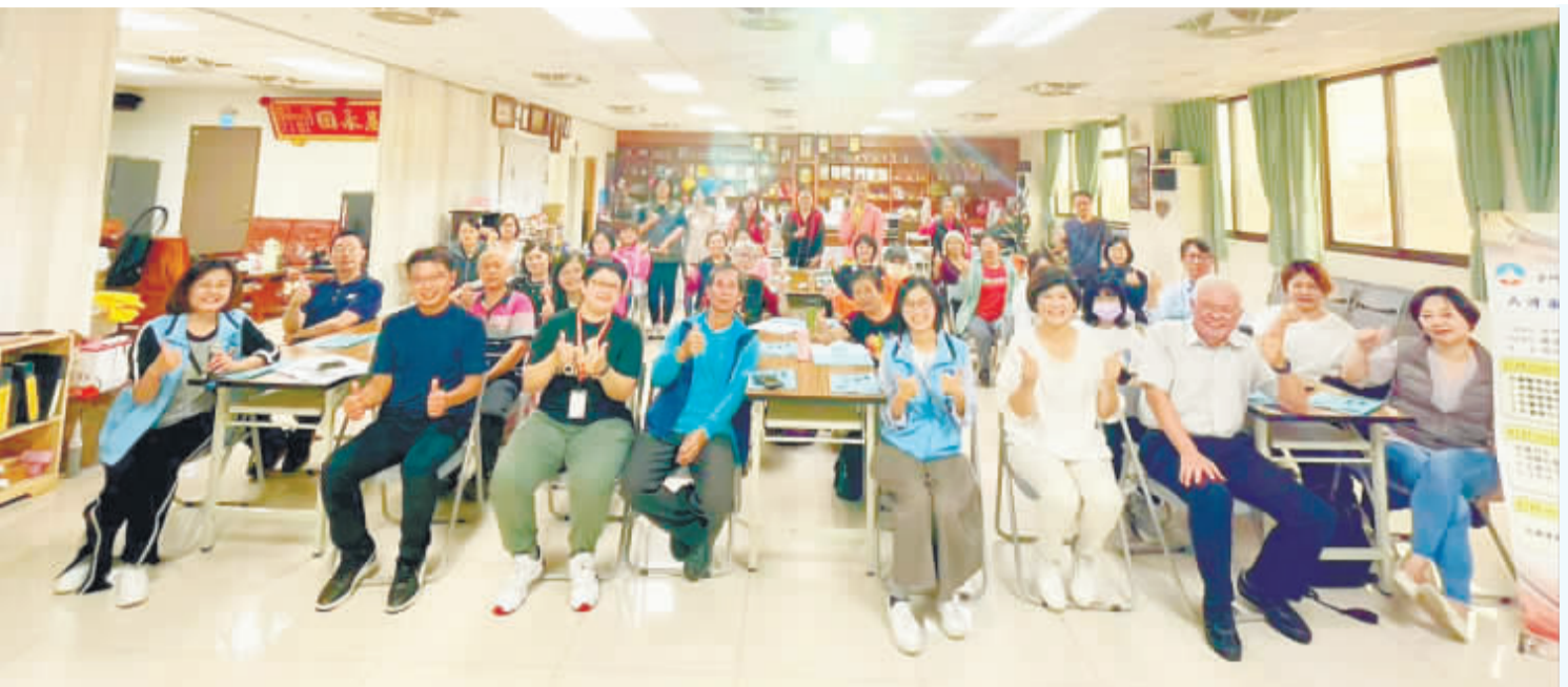
社會處在古寧頭社區辦理「社區共生、離您不遠」進階培力課程。

記者陳冠霖／綜合報導 社區共生是啥呢？我們社區正在做的種種福利服務是共生嗎？這是社區志願者們常常疑惑的。金門縣政府社會處將於3月30日第一階段培力課程，為能力養成實作基礎培力課程後，於4月27日上午9時在金寧鄉古寧頭社區活動中心辦理第二階段「社區共生、離您不遠」之進階培力課程。隨著高齡化、少子女化、實際關係的互動傳統逐漸轉變，「共生社區」的思維，成為現今社區發展的重要對策。因應此新的議題參與課程之社區幹部相當踴躍，共計有公所與社區幹部等58人參與。