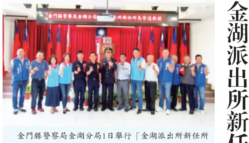
金門縣警察局金湖分局1日舉行「金湖派出所新任所長布達典禮」。

金門縣政府委託中華青年公共事務協議會辦理的金湖托育資源中心暨遊藝館，日前舉辦「爸爸跟孩子們的童年遊戲」親子遊戲講座，邀請爸爸們一起來學習陪伴的技巧，並邀請爸爸們加入遊藝館育兒俱樂部，當帶孩子的一同參與中心辦理的親子活動，善用金門縣政府的美意，享有免費又專業的資源，共同創造友善育兒環境，及建立合理家務分工的正確家庭觀念。 記者楊水詠／金湖報導 金門縣政府委託中華青年公共事務協議會辦理的金湖托育資源中心暨遊藝館，日前舉辦「爸爸跟孩子們的童年遊戲」親子遊戲講座，邀請爸爸們一起來學習陪伴的技巧，並邀請爸爸們加入遊藝館育兒俱樂部，當帶孩子的一同參與中心辦理的親子活動，善用金門縣政府的美意，享有免費又專業的資源，共同創造友善育兒環境，及建立合理家務分工的正確家庭觀念。