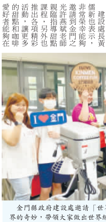
金門縣政府建設處邀請「世界金廚冠軍」許燕斌教學，與地區業者一同探索甜點世界的奇妙，帶領大家做出世界級的知名甜點。

記者陳冠霖／縣府報導 金門咖啡節的舉辦在地方上引爆了熱潮！為了讓咖啡「必吃」的甜點愛好者們有更多學習和交流的機會，主辦單位金門縣政府建設處特別邀請到「世界金廚冠軍」許燕斌親臨指導教學，與地區業者一同探索甜點世界的奇妙，帶領大家做出世界級的知名甜點，成就了一場精彩的甜點饗宴！