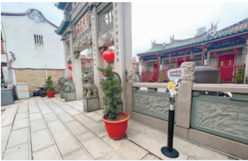
環保局於縣內部分商圈設置熄菸筒，透過造型及標語吸引吸菸者目光，期能大幅減少菸蒂落地機會。

記者莊煥寧／綜合報導 為維護本縣環境衛生，環保局長長期倡導「菸蒂不落地」政策，請民眾在觀光景點、超商、交通場站等易吸菸地區勿亂丟菸蒂，但仍有部分吸菸者因找不到垃圾桶或「習慣」，隨意丟棄菸蒂或彈入水溝中，為此，環保局於縣內部分商圈設置熄菸筒，透過造型及標語吸引吸菸者目光，期待大幅減少菸蒂落地機會，避免菸蒂破壞街道景觀，共同維護並營造優質縣容環境。 環保局表示，菸蒂對環境的污染遠比我們想得還巨大，多種有害化學物質集中於菸蒂內，且菸蒂頭端為一種「醋酸纖維」塑膠材質，在環境中不易分解，丟入水溝中將隨著流水排到大排、大海中影響海洋環境，最終進入食物鏈危害人體。另外菸蒂容易卡入街道或水溝蓋縫隙，清潔人員僅用掃帚則難以完全清除，須以夾子或特殊工具撿拾，費時耗力，嚴重影響縣容觀瞻。 去年環保局於陽翟老街設置熄菸筒，