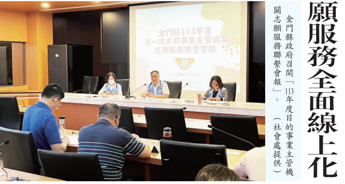
金門縣政府召開「113年度目的事業主管機關志願服務聯繫會報」。

代表隊出發順利，希望每一位選手都能充分發揮自己的潛力，勇往直前，奪得佳績，為學校爭光，同時也展現金門大學學子的團隊精神。 陳建民指出，金門大學運動代表隊參加全國大專運動會，這是一個展現金門大學活力與實力的絕佳機會，也是選手們展現自己體育精神和運動技術的舞台。陳建民表示，本次大專運動會不僅是一場體育盛事，更是一個展現學校形象的良好契機，學校會全力支持代表隊參賽，同時希望透過這次比賽，能夠加深各校之間的友誼，提升校園運動文化的風氣。 113年全國大專校院運動會將於5月4日至8日於國立臺灣體育運動大學盛大登場，本屆全大運以「經典再現、活力無限」為精神標語，期許展現大專青年的青春活力。 臺灣大擁有創校63年歷史，曾6度承辦全大運，是全大運舉辦次數最多的學校，去年全大運，臺體大以78金58銀71銅的佳績拿下總冠軍。 全大運聖火於4月15日在臺中公園湖心亭點燃，接連三天完成北中南共九大專院校的傳遞，在5月4日開幕典禮前，將陸續展開開球、擊劍、網球、角力、射擊、柔道、羽球、跆拳道品勢、韻律體操等比賽，所有賽事將於5月8日結束，隨即舉行閉幕典禮。 而巴黎奧運預計在今年7月底登場，許多奧運選手預計也會把這次全大運當暖身賽，包含台灣桌球一哥「小林同學」林昀儒、「台灣蝶王」王冠閎、亞運拳擊金牌陳郁婷、舉重女將方芳靈、射擊國手湯智鈞、田徑跳遠名將林昱堂預計都會參賽。 全大運是國內學生運動最高層級的賽事，也是培育體育精英的重要搖籃，今年全大運有許多深具潛力的選手出賽。為展現本屆全大運的創新精神，臺體大由師生共同設計出全大運首創的虛擬網紅代言人「小藍」，將與全國參賽選手一同加油打氣。此外，臺體大也運用多媒體動畫科技，為本屆所有競賽項目的標誌設計專屬動畫，並搭配學生自行創作的加油主題曲「為我喝采」。這些專為大學生設計的附屬創作，也為全大運增添不少亮點。各校選手蓄勢待發，準備在賽場上展現青春活力與運動熱情。