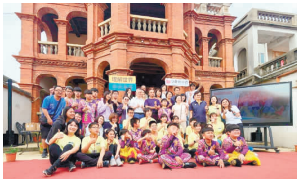
金鼎國小、少年報導者「影像共創成果發表會」，與會者合影。

記者許峻魁／金鼎報導 去年的城隍活動記者會現場，一群僅十歲左右的金鼎國小的小記者穿梭其中，用文字與相機記錄整個過程，親身感受在地傳統宗教文化，這群孩子們將一年來的學習成果在昨(3)日進行發表，更親自擔任主持人，從問題草擬到訪問一手包辦，讓師長們看見他們一年來的成長。 用文字、影像將地方上所發生的人事物記錄下來，是媒體從業者的日常，透過他們的撰述及傳播，讓民眾了解生活周遭乃至全球發生的重要事件。在非營利媒體「少年報導者」專業記者的指導下，帶著金鼎國小十二位四、五年級的學生，深入迎城隍的現場，記錄下金門傳統的迎城隍陣頭、遶境巡安宗教文化。昨日的