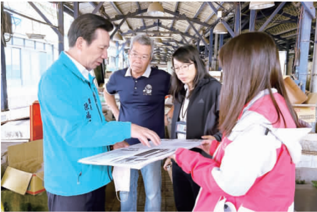
沙美市場整建案，縣長陳福海多次親自前往沙美市場進行勘察。

記者陳冠霖／綜合報導 沙美市場建築結構老舊，多處鋼筋裸露，將不堪使用，重建已討論多年。縣長陳福海上任後，多次前往市場現勘，並指示縣府建設處及金沙鎮公所盤點出沙美市場長年遇到的問題及現況，在不影響土地所有權情形下，先就現況急需變善的部份分期改善。