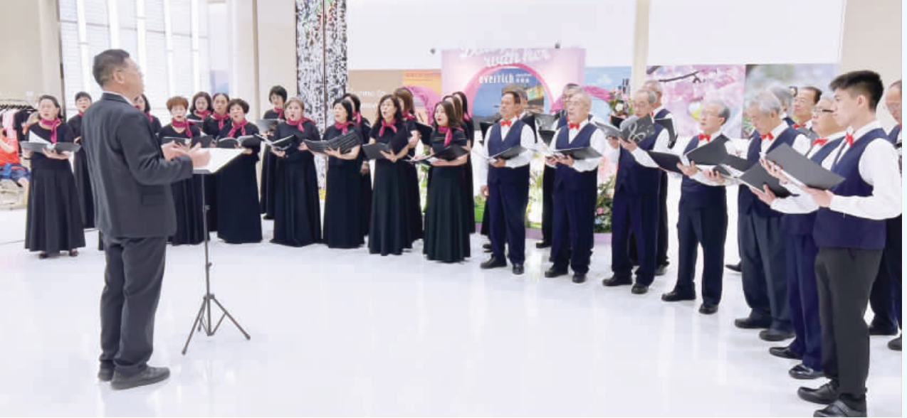
迎接溫馨的母親節，金門縣合唱團舉辦「愛的饗宴2024母親節感恩音樂會巡迴演繹」。

記者陳冠霖／金湖報導 迎接溫馨的母親節，金門縣合唱團4日在昇恆昌廣場舉辦「愛的饗宴2024母親節感恩音樂會巡迴演繹」，快樂獻唱多首感恩母親節的溫馨歌曲，讓遊客旅人在金湖廣場與藝術不期而遇，一場美好的邂逅為生活增添驚喜；