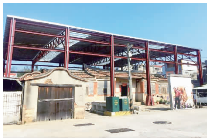
金門縣定古蹟料羅吳氏六路大厝修復及再利用工程，訂於13日5月10日上午9時起舉辦開工動土典禮。

金湖鎮料羅100、101號。 縣定古蹟料羅吳氏六路大厝，建築格局為雙落帶雙階(六路大厝)及雙護龍，為金門地區最大獨棟民宅，且是料羅吳氏開基最早大厝，建築整體形制及符號形式豐富，建築木構造精美，極具保存及再利用價值。金門縣政府將投入新臺幣6,088萬元整預算進行修復，預定在13年5月10日上午9時整舉行修復工程動土典禮。