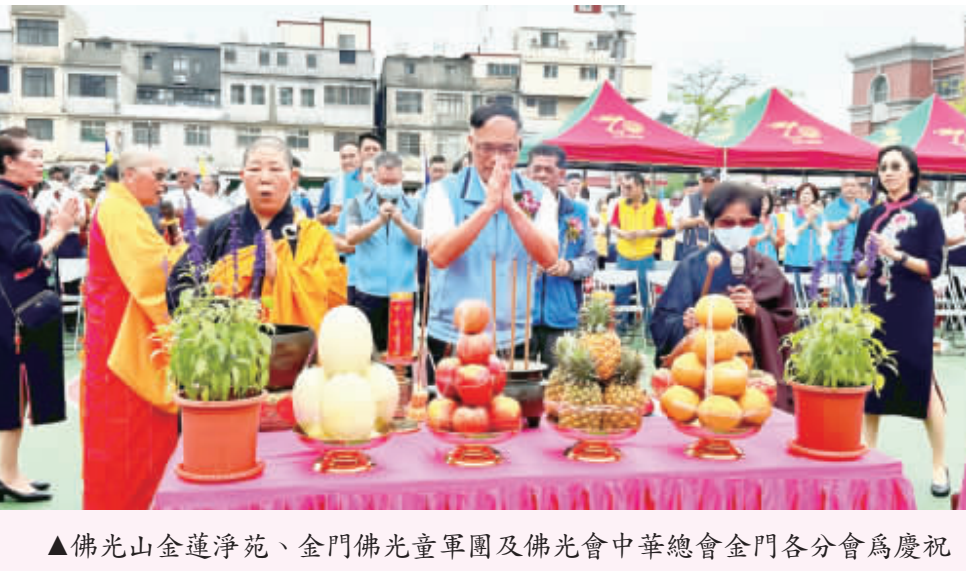
▲佛光山金蓮淨苑、金門佛光童軍團及佛光會中華總會金門各分會為慶祝2024年佛誕節暨母親節，4日上午舉辦浴佛祈福活動。