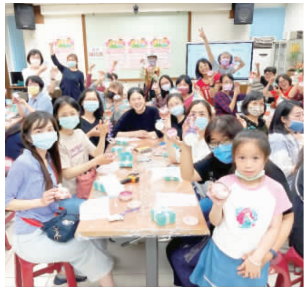
金門縣文化局於5月4日辦理兩場次的愛心香氣蠟燭手作課程，讓參加的婦女、親子享受手作的療癒時光。

記者李增汪／綜合報導 金門縣文化局於5月4日辦理兩場次的愛心香氣蠟燭手作課程，讓參加的婦女、親子享受手作的療癒時光。活動一開始，文化局局長呂坤和特別到現場祝賀大家母親節快樂，並表示拍手是一個很好的運動，拍的越大聲，講節不僅會說的更起勁，也會讓自己更健康快樂。而文化局這幾年的閱讀推廣活動，在大家的努力下有了長足的成效，也希望大家都來多來文化局借閱圖書，參加活動。他表示，今天的講師「接洽老師」在10年來來過金門授課，優良的品質被大家所喜愛，因此特別再次邀請來金門，希望大家都能把優質的香氣蠟燭帶回家，享用溫馨的燭光晚餐。