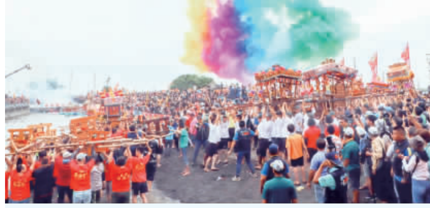
新塹嘉應廟「衡水路迎客王」王船碼頭擠滿人潮 嘉義縣布袋鎮新塹嘉應廟5日舉辦年度宗教盛事「衡水路、迎客王」，王船碼頭擠滿人潮，現場神轎、陣頭蓄勢待發，碼頭旁的鞭炮、煙火點燃，場面壯觀。