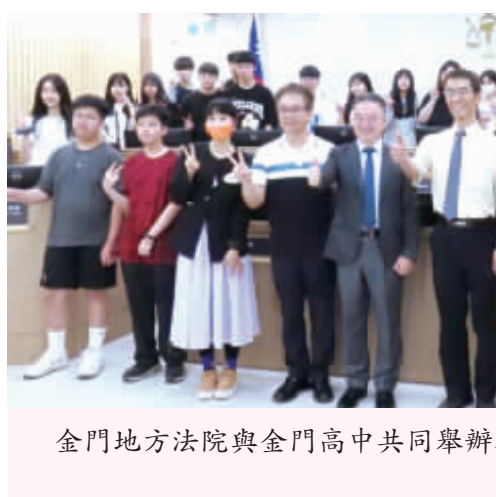
金門地方法院與金門高中共同舉辦校園模擬法庭活動。

金門地院為使法治教育能全面推進至各校園，鼓勵金門在地之國中以上各級學校，日前由國立金門高中籌備處與地院共同舉辦校園模擬法庭活動。