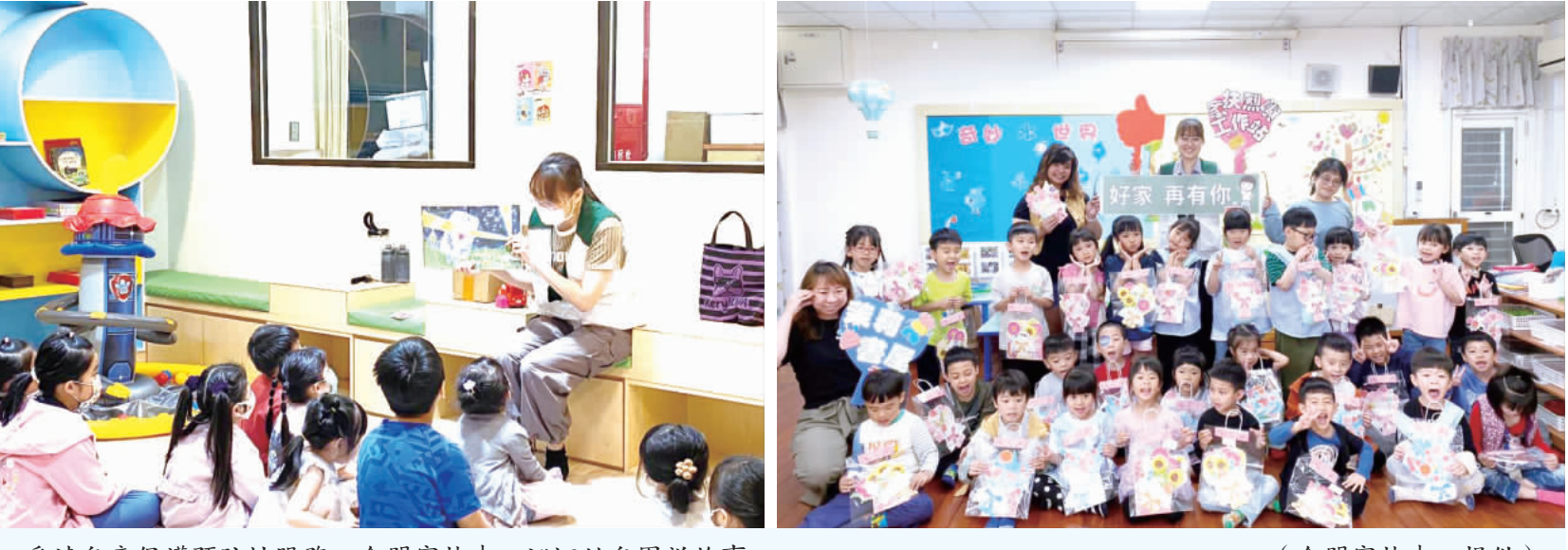
為達兒童保護預防性服務，金門家扶中心巡迴幼兒園說故事。

記者李增汪／綜合報導 為達兒童保護預防性服務，金門家扶中心巡迴幼兒園說故事。 金門家扶中心日前在「小茉莉巡迴各小幼幼園」展開一系列「小茉莉巡迴故事活動」，旨在提供兒童更豐富多元的學習和手作體驗。親子也可以透過繪本的教育，學習相關知識內容，也可以提升親子關係，讓兒童避免遭受不當對待，並同時達到兒童保護預防性服務。