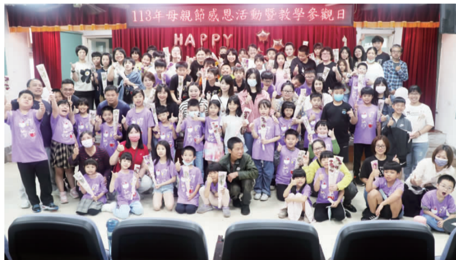
上岐國小舉辦母親節慶祝活動暨教學參觀日活動，在充滿感恩的節日裡，學校準備了豐富多彩的活動，學生們邀請家長入校共同度過一個難忘的時光。

邱忠民也表示，當一位稱職的公務員，必須具備有效處理公文之能力，而主管對於業務承辦人員之表現的評估，往往可以從公文處理之品質與效率上看出端倪。同時，他亦從製作好公文必備知識及公文製作錯誤態樣解析談起，接著從函稿之寫作技巧、簽與函稿之關係深入講解說明，並延伸討論公文書類型使用時機以及執行層級、用語字及數字規範等細節問題，並運用大量的公文簽辦及函稿擬要領及注意事項，藉以加深參訓同仁的學習記憶。