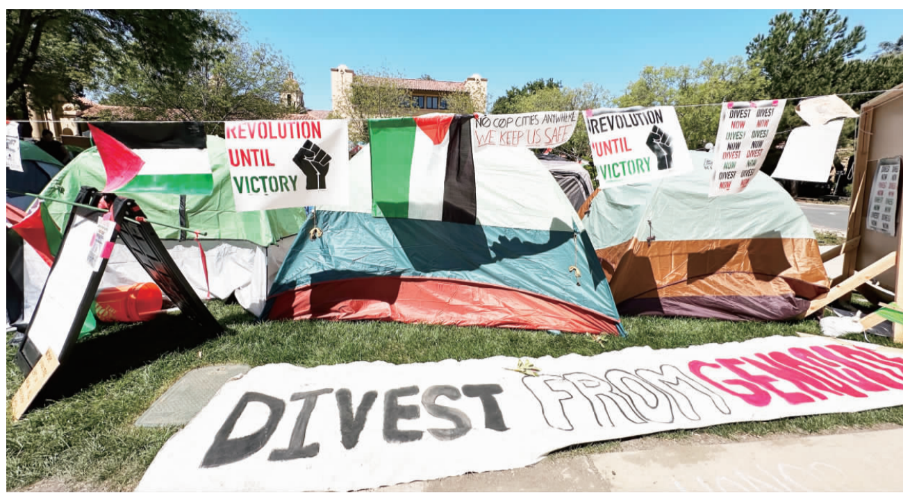
全美校園正迎畢業季，4月中過後開始蔓延的挺巴勒斯坦示威，造成至少1000人被逮捕，幾所學校陸續傳出暴力衝突，讓原本溫馨的儀式蒙上陰憂。(中央社)

【中央社記者張欣瑜舊金山6日電】美國校園挺巴勒斯坦示威浪潮未歇，哥倫比亞大學今天宣布取消畢業典禮。加州大學柏克萊分校畢業典禮也是各種抗議活動場域，部分學生表示「走到這地步極不易」，不希望畢業典禮受到影響。 哥倫比亞大學畢業典禮原訂15日舉行，校方透過聲明表示，在哥大校園舉辦大型畢業典禮有無法克服的安全問題，也沒有找到可以容納超過5萬人的場地。校方和學生一樣，對取消畢業典禮深感失望，這2週將為幾個學院舉辦小型儀式。 華爾街引述一名知情人士消息指出，校方先前與多名外部安全顧問討論，包括反恐顧問，得出的結果是舉辦這樣的大型活動「變數太多」。