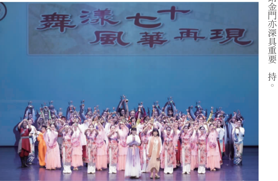
金門棠風舞蹈團5月5日受邀前往台北親子劇場與台灣各團體菁英老師同台演出。

記者李增江／綜合報導 「舞漾七十風華再現」，今年70年週年舞節，有別於以往舞節節慶祝活動，特別於5月5日當天下午於台北市親子劇場頒發舞蹈獎暨全國舞蹈菁英教師聯合演出「舞漾七十風華再現」，該場活動趁此特別紀念時刻，邀請舞蹈界前輩一起登台聯演，深具延續傳承之意。