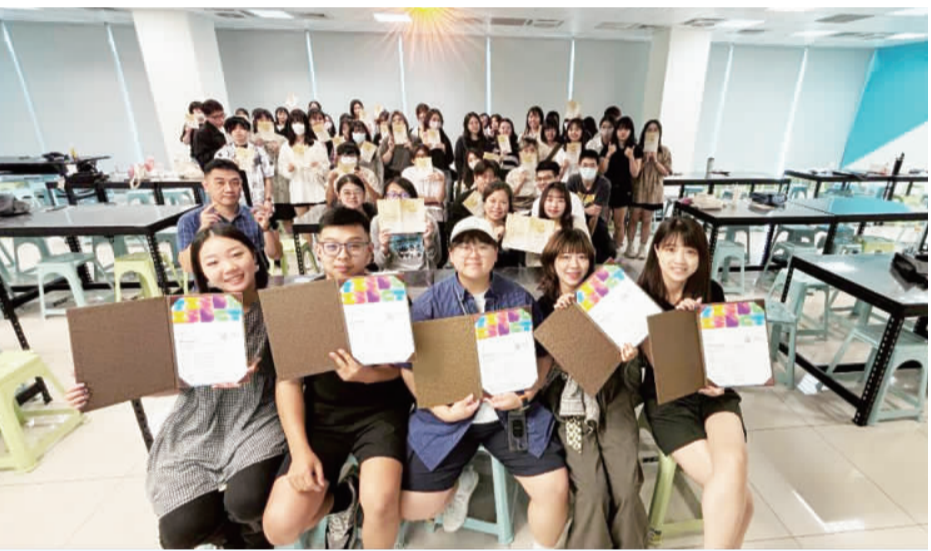
金門設計問鼎計畫規劃一系列的推廣活動，召開專家諮詢會議，邀請全臺22位大專院校代表共襄盛舉。

多學生發揮創意。 同時，金門設計問鼎計畫也透過線上媒體宣傳，打擊計畫知名度，讓更多民眾認識金門縣文化局舉辦的在地文化藍圖努力耕耘不遺餘力，為金門文創產業的發展奠定了堅實基礎。 金門設計問鼎計畫旨在激發全臺大專校院師生所師生，以金門地區文化符號發揮創意提交企劃書，入圍後將發展設計及參加國內外設計競賽。金門縣文化局局長呂坤和表示，歷屆辦理兩屆，已有3件作品榮獲國際紅點設計獎實屬不易，金門設計問鼎計畫將持續鼓勵支持年輕設計師站上國際舞台，推廣金門文化邁向世界舞臺。