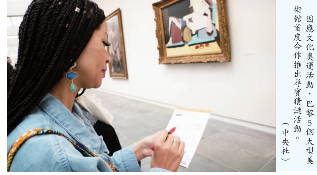
因應文化奧運活動，巴黎5個大型美術館首度合作推出尋寶猜謎活動。(中央社)