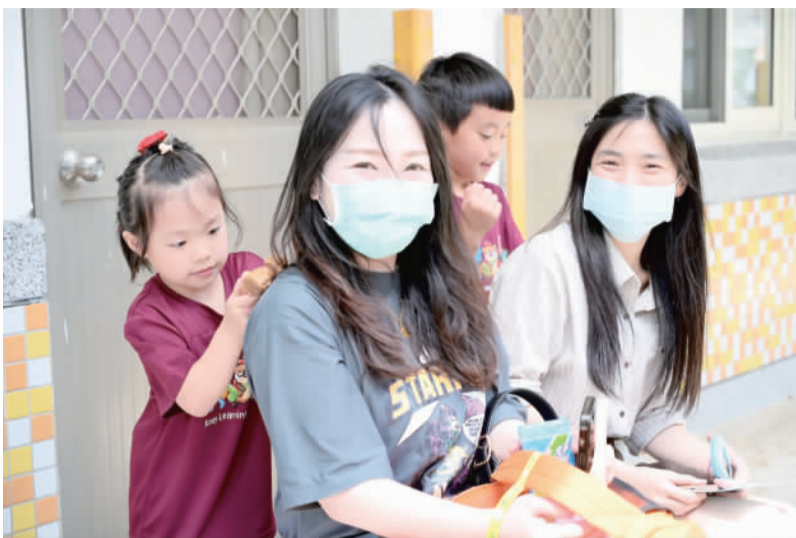
金湖國小幼兒園舉辦母親節慶祝活動，在「愛」及「感恩」中，共度佳節。