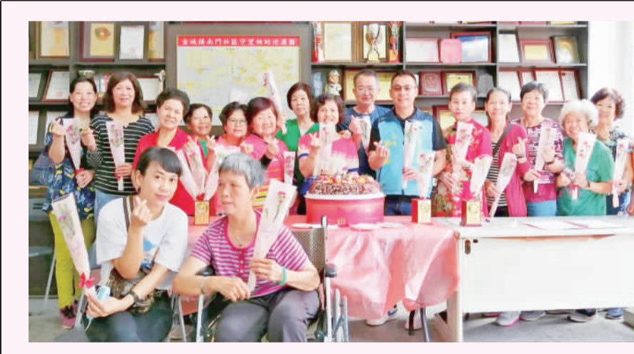
文·許峻魁／圖·南門社區提供

金湖國小幼兒園 記者陳麗好／金湖報導 金湖國小幼兒園舉辦「愛的總動員感恩百分百」活動，以「愛」及「感恩」為主題，規劃全園師生跳律動、幼生與家人關關活動、愛心義賣攤位等內容。首先由全園師生一聽我說謝謝你、「青春修練手冊」兩首律動開場。闖關活動關卡有：親子擲球、跳圈圈、跳房子、吹乒乓球、步步皆冰、喜從天降、讓你爸爸扭一下、水平推推樂、SVA按摩趣、愛的抱抱、傳球遊戲、浪跡天涯，凡完成8個關卡即算過關。愛心義賣攤位則由全園家長們以及老師們所捐贈物資，物品琳瑯滿目，大班孩子們發揮創意結合在地特色集體創作布置攤位，在校園的南洋杉林蔭大道上進行，在蟲鳴鳥叫聲伴襯下，宛如一場森林園遊會；而現場愛心義賣所得，將捐贈給金門家扶中心，藉以幫助更多需要幫助的人。 金湖國小校長陳為信表示，在這充滿溫馨感恩的五月裡，全國親師生用「愛」總動員，舉辦溫馨的活動。五月是個充滿感恩的月份，每年父親節與母親節都是在暑假，沒有機會舉辦全國感恩活動，因此利用這次的活動，讓幼生父母及祖父母及家中成員一同參與，活動期間校園裡處處可見幼生與家人彼此溫馨、愉悅、感人的畫面，也提前共度佳節，祝福所有媽媽們佳節快樂。