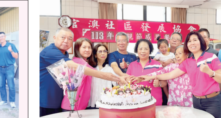
官澳社區發展協會辦理「113年母親節感恩餐會」

金寧鄉長楊忠俊日前走訪鄉公所、圖書館、戶政所、衛生所及清潔隊等單位，贈送康乃馨鮮花向女性同仁賀節及祝福，感謝母親們一生辛勤地為家庭付出，並勉勵為入子女要及時行孝，同時祝福所有母親身體健康、幸福喜樂、母親節快樂。