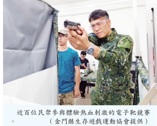
近百位民眾參與體驗熱血刺激的電子靶競賽。