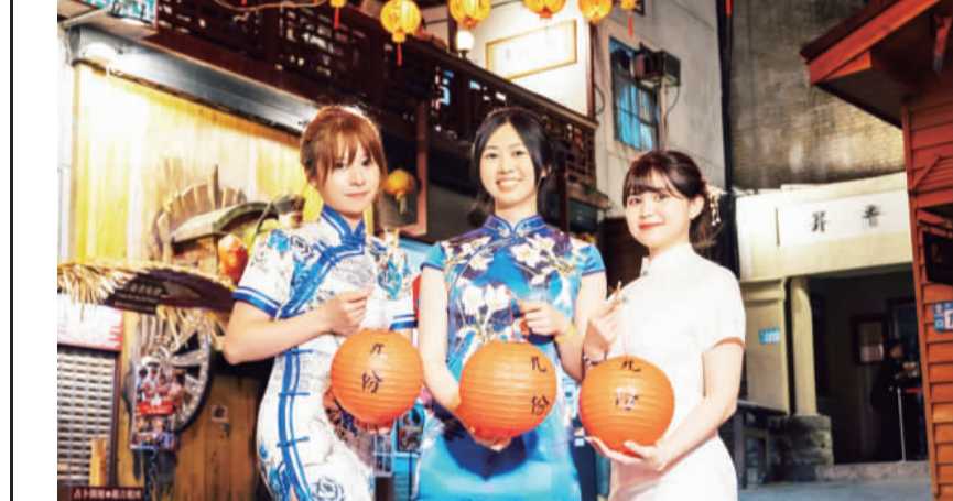
九份紅燈籠祭5/24點燈 [2024九份紅燈籠祭] 24日起將在新北市瑞芳區九份老街及周邊景點舉行，觀光旅遊局表示，今年特別推出2場小提燈夜遊活動，歡迎民眾前來欣賞黃金山城之美。