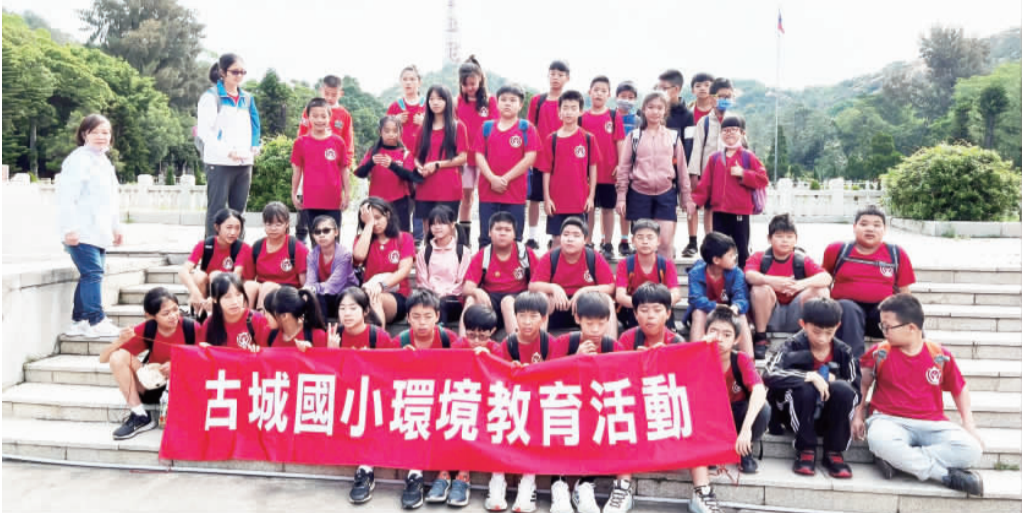
左、右：古城國小辦理校外教學活動，走訪金門歷史古蹟、戰地遺跡、自然生態景觀及各紀念館。