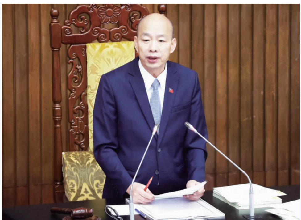
立法院會14日三讀修正通過道路交通管理處罰條例部分條文，限縮民眾可對交通違規檢舉的項目。交通部表示，最快6月可以施行。圖為立法院長韓國瑜宣布三讀通過。

【中央社記者王承中台北14日電】立法院會今天三讀修正通過道路交通管理處罰條例部分條文，限縮民眾可對交通違規檢舉的項目，最快6月可以施行。 立法院會今天三讀修正通過道路交通管理處罰條例部分條文，限縮民眾可對交通違規檢舉的項目，最快6月可以施行。交通部表示，最快6月可以施行。 去年6月上路的交通新制，因記點加嚴及增加13項交通違規開放民眾檢舉，引起計程車等職業駕駛等，不開放民眾檢舉。