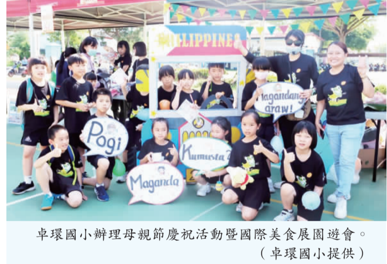
卓環國小辦理母親節慶祝活動暨國際美食展園遊會。