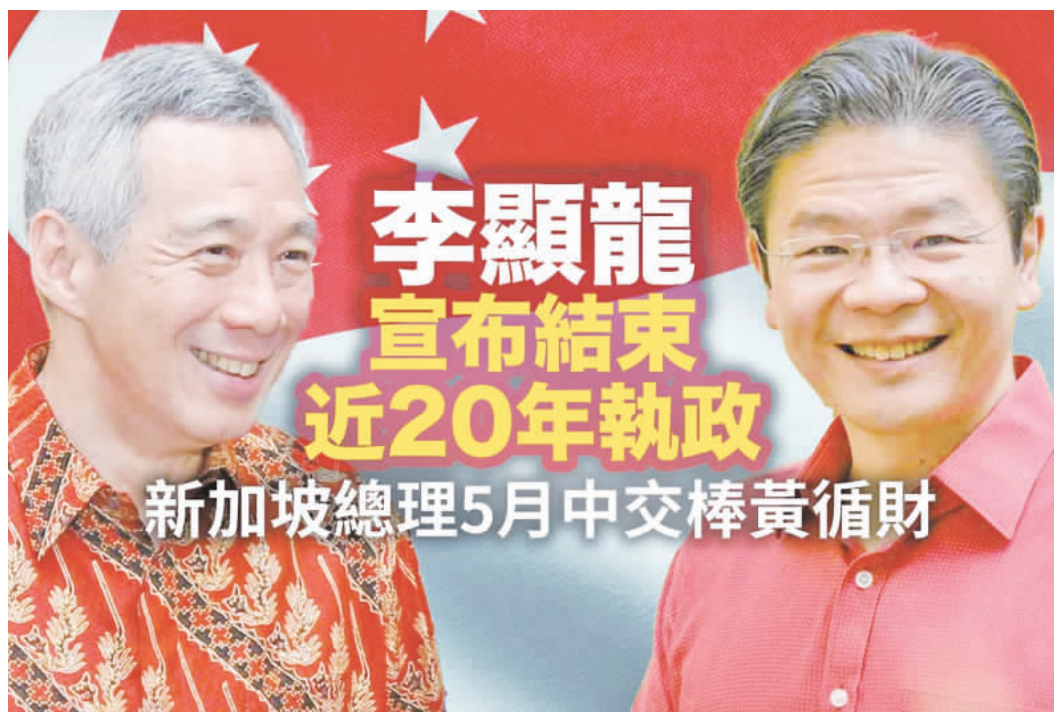
〔整理採訪：僑訊小組〕

新加坡總理李顯龍於5月15日正式卸任，將領導棒交給副總理兼財政部長黃循財。72歲的李顯龍在5月7日表示，卸任後他仍將留在政府，繼續擔任宏茂橋集選區的國會議員，並全力協助黃循財及其團隊取得成功。這一消息標誌著新加坡政壇的一次重要變動，也引發了廣泛關注和討論。 李顯龍表示，卸任後將出任國務資政（Senior Minister），這一職位使他能夠繼續對新加坡的政策制定和政府運作發揮影響力。他計劃在5月15日當天提交辭職名單與接任者名單，確保權力順利過渡。當晚8時，黃循財將在宣誓就職後，公布新內閣名單，正式接任總理職務。 在社交媒體的發文文中，李顯龍對過去幾周收到的感謝和鼓勵表示深深的感謝。他提到，許多人分享了政府各項政策如何改善他們的生活，並表達了對身為新加坡人的自豪感。這些感言充分體現了李顯龍任內政策的影響力和廣泛認同感。李顯龍也特別提到，許多非新加坡人對新加坡的讚賞，這反映了一個全、幸福的國家，這反映