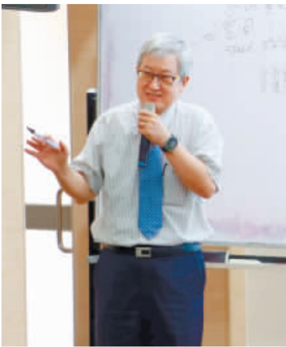
吳連賞分享人生經驗，並與金大師生合影。

記者許加泰／綜合報導 金大僑領講座，邀請高雄師範大學前校長吳連賞開講，吳連賞以「我的學思歷程與人生體驗」為題，分享人生體驗與研究成果，期盼學子可以早日找到人生的目標，並勇敢向前邁進。 由通識教育中心所辦理的「僑領講座」及涇洲書院「與大師秉燭夜談」系列講座，邀請鄉賢吳連賞返金演講，受到金大師生的熱情歡迎與迴響。 金門大學校長陳建民主表示，金大與高師大關係密切，過去也有諸多學術上的交流，高師大在吳連賞校長的帶領之下也受到了眾多肯定。吳連賞對金門有著深厚的感情，此次的演講對學子而言，無論是人生、學業、工作、生活，都將有所裨益。 吳連賞於兩場演講中帶來精彩的主題，分別為：「高師大與高雄港都的創新發展」、「我的學思歷程與人生體驗」。前者為其現今面臨的利弊與弊，可以從中窺見其對於高雄這塊土地的熱愛與憂心；後者則與學子分享其人生歷程，如何由童年的艱困歲月中淬煉鋼鐵般的意志，進而改變自身的人生軌跡。吳連賞亦勉勵：「讀萬卷書不如行萬里路，行萬里路不如閱人無數，閱人無數不如高人指路，高人指路不如自我覺悟。」期盼學子可以早日找到人生的目標，並勇敢向前邁進。 吳連賞表示，自己的教育理念是一切為學生，一切為老師，一切為教職員工生；「一樹樹木，莫道是他人子弟；滿園桃李，都看若自己兒孫」。教育是已成人的志業，是生命影響生命，靈魂感動靈魂的最偉大希望工程，帶好每個學生；誨人不倦，以身作則，實踐角色典範，學校便沒有失敗者。 出生於烈嶼鄉上庫村的吳連賞，2015年8月1日當選國立高雄師範大學校長，是首位接任國立大學校長的烈嶼鄉子弟，於去年8月退休。地理學博士出身的吳連賞，與高師大淵源極深，經歷地理系副教授、教授、主任、台灣文化與語言研究所所長、文學院院長、教務長、副校長，主要研究興趣包括台灣工業發展、工業化與都市化研究、中國研究及鄉土與社區發展研究，長期投入台灣區域研究、高雄地區、紅毛港及鄉土與社區研究，曾主編國立編譯館國中地理1至3冊教科書，亦擔任過教育部高中地理課綱召集人、民間版高中職教科書總主編，同步關注全球化、本土化與中國研究，擁有《中國發展、發展中國》、《台灣工業發展過程與環境變遷》等著作。2006年獲頒教育部優秀教育人員獎；2015年獲頒教育部師範獎。 金大指出，僑領講座以各領域專家學者、巨擘等到校演講為目標，期盼學子能向典範人物學習、看齊；與大師秉燭夜談則藉由與大師的對話，提升學子對生涯規劃、各種新知與實務的了解，擴大人生視野與國際觀。