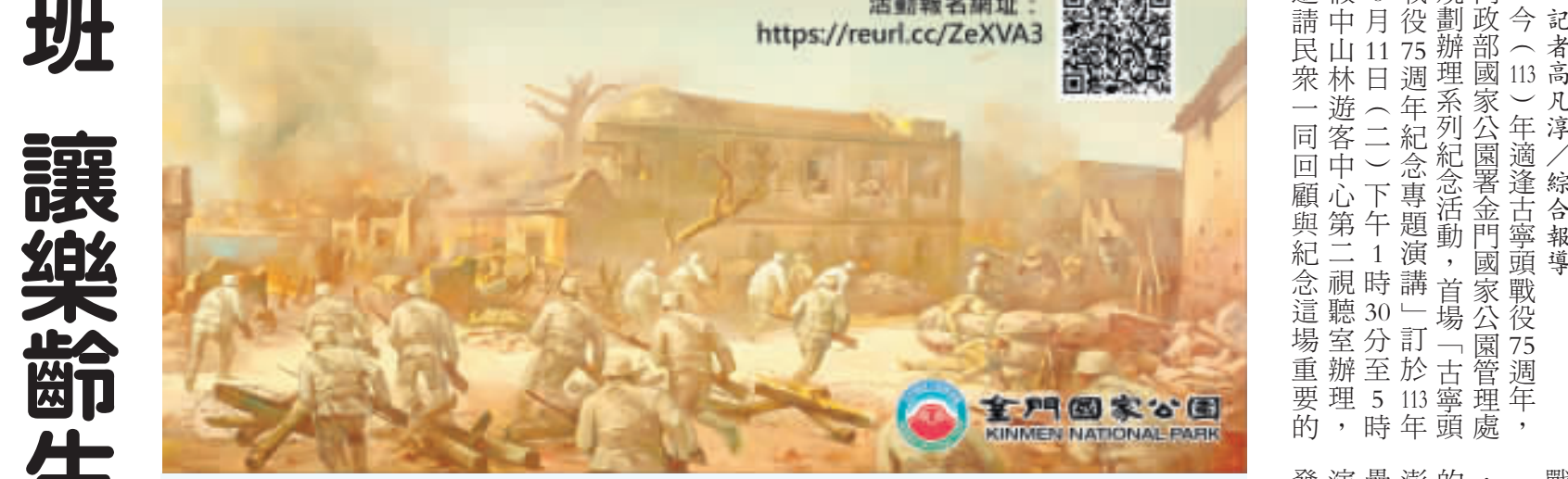
古寧頭戰役75週年，金管處規劃辦理「古寧頭戰役75週年紀念專題演講」。

記者高凡淳／綜合報導 今(113)年適逢古寧頭戰役75週年，內政部國家公園署金門國家公園管理處規劃辦理系列紀念活動，首場「古寧頭戰役75週年紀念專題演講」訂於113年6月11日(二)下午1時30分至5時，假中山林遊客中心第二視聽室辦理，邀請民眾一同回顧與紀念這場重要的戰役。 民國38年10月25至27日的古寧頭戰役，國軍在金門島古寧頭地區與渡海來犯的共軍激戰後始獲得戰役勝利，使臺、澎、金、馬得以成為得獲民主自由的堡壘。本次「古寧頭戰役75週年紀念專題演講」，邀請鄭瑞堅將軍及劉國奇先生就兩場講座進行與談，希望讓未曾經歷這場戰役的與會民眾，藉由再次回顧當年戰火交鋒的點滴，共同緬懷與紀念國軍守護國家的貢獻，體會戰爭的無情，更加珍惜和平的可貴。 金管處表示，本次活動將贈送與會人員書籍《金門軍事史話：中華民國三十八年至四十二年》、《金門軍事史話：中華民國三十八年至四十二年》、《古寧頭大戰》DVD及《烽火歲月》明信片1套，名額有限，歡迎有興趣的民眾報名參加。其中，《金門軍事史話：中華民國三十八年至四十二年》為鄭瑞堅將軍所著，該書蒐羅整理許多文獻史料，旁徵博引探討古寧頭戰役前後大小戰役及我國軍事部署等主題，值得作為相關研究之參考書籍，文字流暢易讀亦可作為一般民眾認識該時期金門軍事史的歷史讀物。此外，為讓民眾體會軍人砥礪精神，金管處為古寧頭戰役75週年相關紀念活動製作了軍中口糧，歡迎民眾持續關注該處全球資訊網最新消息，或是臉書粉絲專頁，踴躍參與相關系列活動。 責任編輯／張建騰