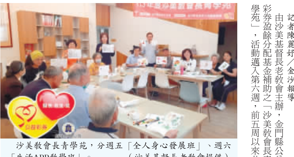
沙美教會長青學苑，分週五「全人身心發展班」、週六「生活APP教學班」。

記者陳麗好／金沙報導 由沙美基督長老教會主辦，金門縣公益彩票盈餘分配基金補助之「沙美教會長青學苑」，活動邁入第六週，前五週以來共有一百五十人次參與。學員「全人身心發展班」課程能讓他們學會以簡易的手指動作，達到運動的效果，各式手作、繪畫活動陶冶心靈；而「生活APP教學班」則能幫助大家不與社會脫節，享受運用數位生活的便利，讓樂齡生活更有趣。 長青學苑於四月十二日「開張」，每週五上午十時假沙美教會教育館進行「全人身心發展班」，除了固定的樂齡運動，還有歌曲欣賞和歌唱、文創手作、彩繪多肉植物花盆、桌遊、生活美語教學，日常手機攝影將於本週五(十七日)登場，未來還有DVD流動畫和老歌歡唱等。 與會學員表示，期間，一堂手繪課程中，大家化身「一日米羅」，在瞭解米羅創作的元素和風格後開始創作，或以畫筆反映生活樣貌或投射自己的心情，畫作中都有米羅的元素；星星、月亮、梯子、小鳥等，大家各自展現不同創意，作品令人驚喜。 每週六上午十時在金寧福音中心辦理的「生活APP教學班」，則協助長者學習生活物品外送、餐飲外送、道路導航和網路購物等，長者在上課當「一現學現賣」，利用全聯的「小時達」和家樂福「家速配」。