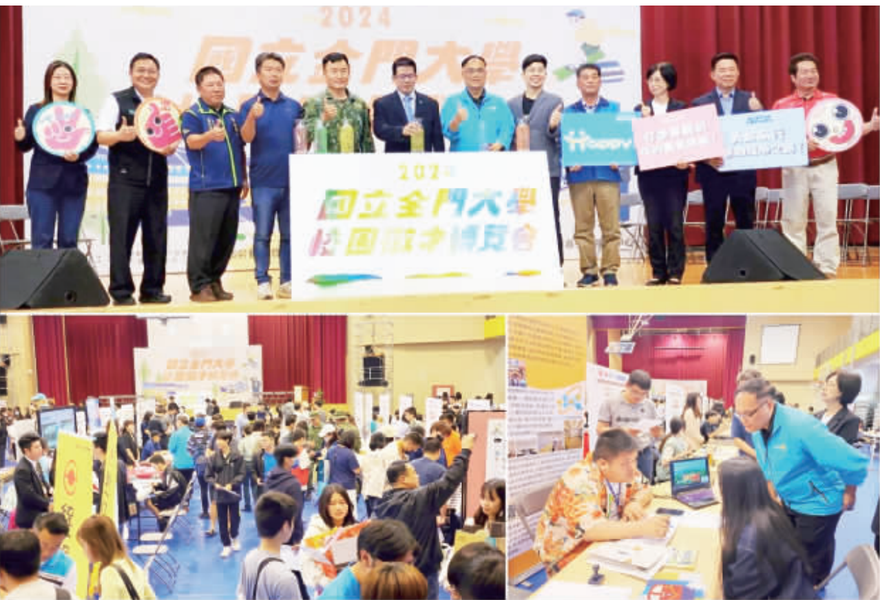
金門大學校園徵才博覽會，昨日在金大體育館登場。