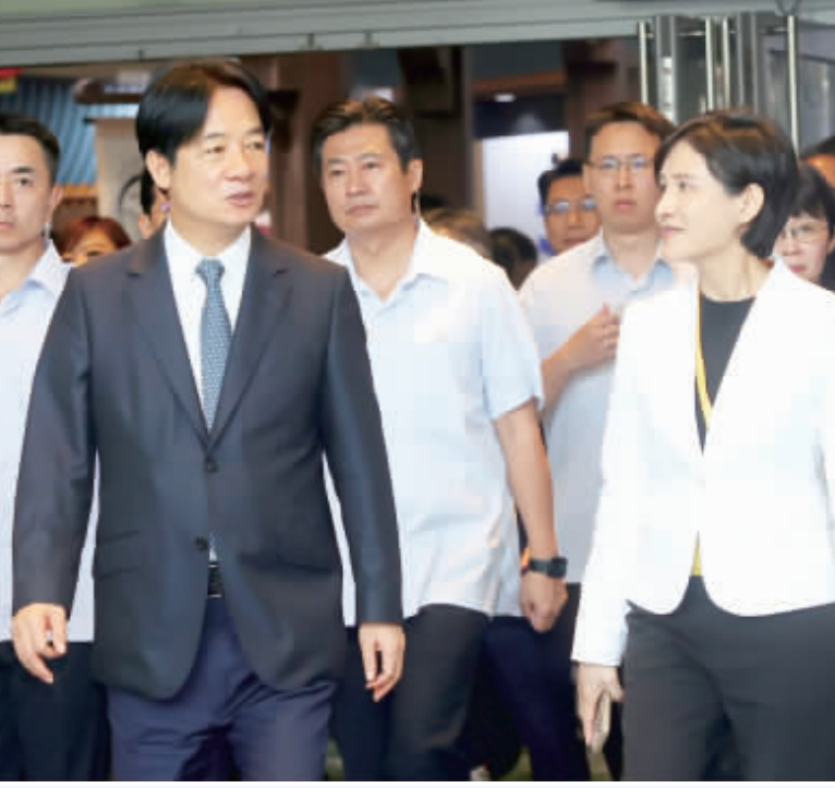
邁入第10屆的CYBERSEC 2024台灣資安大會，14日至16日在台北南港展覽館2館舉行，副總統賴清德（前左）與內定行政院副院長鄭麗君（前右）15日上午出席活動。