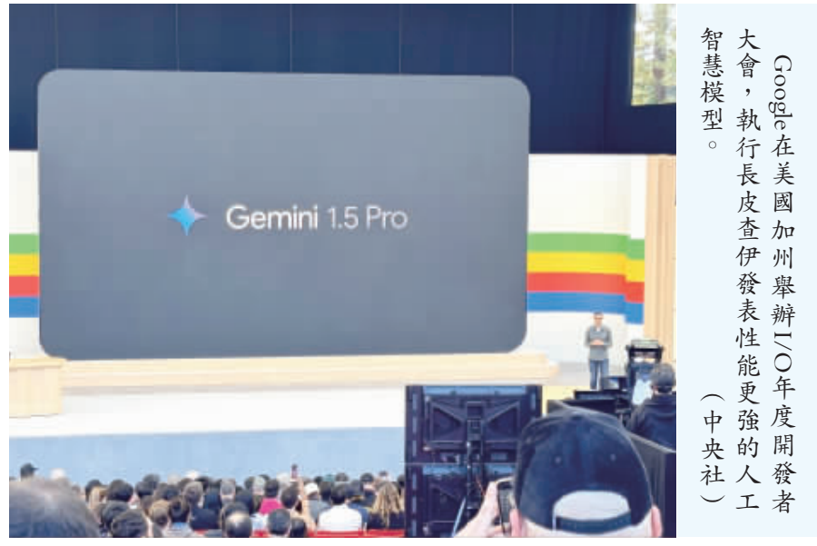
Google在美國加州舉辦2024年度開發者大會，執行長皮查伊發表性能更強的人工智慧模型。（中央社）

【中央社記者吳家豪舊金山14日電】Google今天在2024年度開發者大會發表性能更強人工智慧模型Gemini 1.5 Pro，輕量模型Gemini 1.5 Flash，會中提出AI共12次強調其重要性，並試圖於AI市場與OpenAI公司較勁。 搶在Google I/O大會前夕，美國新創公司OpenAI於13日推出更高性能、更高效人工智慧（AI）技術模型GPT-4o，能進行真真的語音對話，將鞏固旗下生成式工具ChatGPT地位，而且對所有使用者免費。 面對OpenAI來勢洶洶，Google今天於美國加州山景城總部海岸線劇院舉行「O」開發者大會，以AI為核心發表新技術與服務，現場活動僅邀請全球部分開發者及媒體參與，中央社記者為台灣少數媒體代表之一。 隨著開場音樂響起，Google執行長皮查伊（Sundar Pichai）緩緩走上台表示，「我們還在AI非常早期的階段」，現在看到這麼多機會，推動這些機會的正是Gemini。目前有超過150萬名開發者，在Google平台上使用Gemini模型。 皮查伊說，Gemini 1.5 Pro模型從一次可處理100萬個詞元脈絡長度，將擴增到200萬個，是目前為止可提供最長脈絡處理的基礎模型。現在開發者和Google Cloud的客戶可加入等候名單，使用200萬個詞元脈絡長度的Gemini 1.5 Pro。從實際應用來看，Gemini 1.5 Pro以僅需1.5GB的記憶體，為100封電子郵件摘要，或處理長達1小時的影片內容。為滿足開發者需要更快速、更具成本效益的AI模型，Google DeepMind執行長薩比斯（Demis Hassabis）宣布推出輕量模型Gemini 1.5 Flash，特別針對大規模、高頻率的任務進行最佳化。薩比斯也公布AI計畫的最新進展，讓AI助理即時分析手機拍攝的畫面，提供語音回答，展現AI助理未來的可能性。此外，Google也透過專門為Google搜尋量身打造的全新Gemini模型，能夠將Gemini的先進能力，像是多步驟推理、規劃和多模態等特性，與Google的搜尋系統進一步整合。