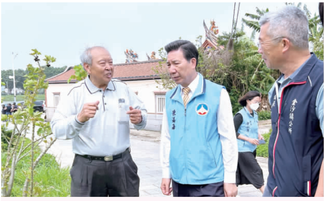
縣長陳福海與金沙鎮長吳有及社區會勘周邊環境，期能營造整潔的生活空間

環保局指出，近來積極結合公私部門，擴大環境認養計畫，根據統計，計有 99 個社區參與 113 年度「金門縣推動社區環境清潔維護計畫」及 87 處商家進行「金門縣道路環境清潔維護計畫」。