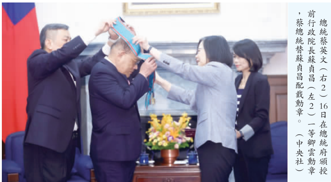
總統蔡英文(右二)16日在總統府頒授前行政院長蘇貞昌(左二)一等卿雲勳章，蔡總統替蘇貞昌配戴勳章。

【中央社記者溫貴香台北16日電】總統蔡英文今天頒授前行政院長蘇貞昌「一等卿雲勳章」，感謝蘇貞昌在任內，充滿挑戰的時刻，扛起壓力，接行政院長，讓台灣往前邁進一步。蘇貞昌也感謝蔡總統給他4年的時間，讓他有機會為國家奉獻心力。