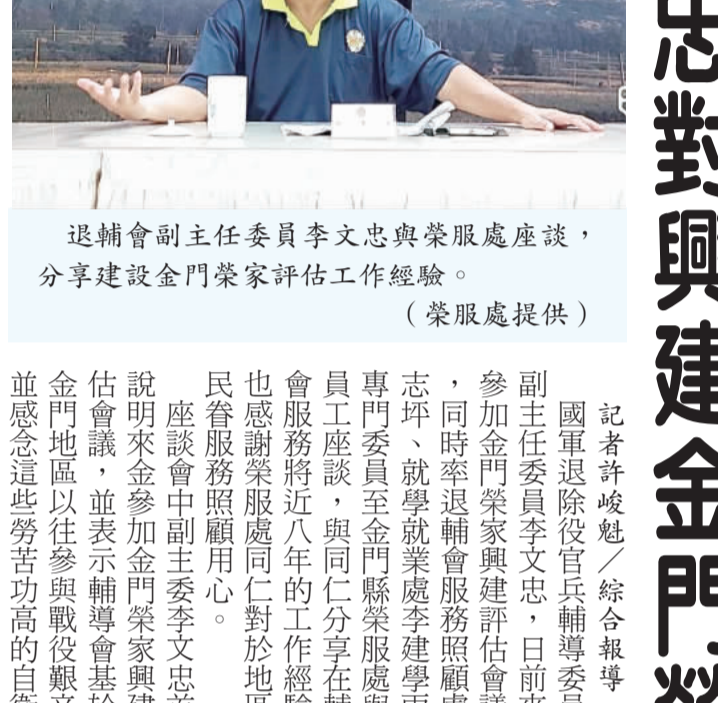
退輔會副主任委員李文忠與榮服處座談，分享建設金門榮家評估工作經驗。

榮民的犧牲奉獻，對建設案表題，才能讓工作推展順利水到渠成，並請各級官員除了適時接受部政院拍板定案，也表示整個案件執行過程，榮服處員工與地方政府都不斷溝通，才能讓各項案件有現在這樣的发展。 李文忠也期望榮家服務處同仁，能在從事公務時是重大建設的評估上，一定要仔細謹慎避免造成後續實際執行時的落差，事先做好各項評估研究工作。 李文忠同時期許同仁要勇於任事，針對各項工作要有方法有計畫的推動，並且要站在執行者立場，替基層解決各項問題。