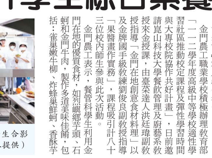
金門在地創意食材料理課程，參加學生合影

記者許峻魁／綜合報導 金門農工職業學校積極辦理教育部「一二三年度高級中等學校適性學習社區推動校定課程及彈性學習時間與大專校院協作共好計畫」，日前邀請崑山科技大學餐飲管理系及廚藝系教授來金授課，由臺東達人洪廷璋副教授指導，金門在地創意食材料理一以「果醬畫作實務」課程吸引計八十多位師生參與此次活動。 金門農工表示，餐管科學生利用金門在地的優質食材，如烈嶼鹹芋頭、石蚵和金門牛肉，製作多道美味佳餚，包括：雀巢鹹牛柳、炸鱈魚鮮蚵、香酥芋 金門農工表示，透過共好計畫的活動，讓學生不僅提升了自我的專業能力，也體驗到跨領域合作的樂趣與價值，崑山科技大學餐飲管理系及廚藝系是技職科大產學典範，擁有國際名廚江振誠擔任講座教授，優質多元的國際及國家級專業考場及教學設備，該系在國際大賽亦是常勝軍包辦金銀銅獎盃，對於廚藝美食、烘焙點心、飲調咖啡、餐飲服務、品評侍酒有興趣的學生而言也是他們日後升學的重要選擇之一。 金門農工校長吳志則表示，以該校技職需求為基礎，進行大專校院之交流合作，能將大學、業界資源匯入農工，提升學生自主學習動機、豐富學生學習歷程以及培植就業競爭力。這次的共好計畫邀請到崑山科大優秀教授團隊到校指導，讓學生接觸到更專業的烹調及藝術技巧。而學生們豐碩的學習成果，也將會在五月二十五日（星期六）的上午十時至十二時，在中山林咖啡室進行成果發表會，他也歡迎認識進一步了解的國中學生前往欣賞，認識金門農工所提供的多元課程供同學修習，提升學生的綜合素養與實務能力，並強化在地產業資源引進，打造優質教學系統。