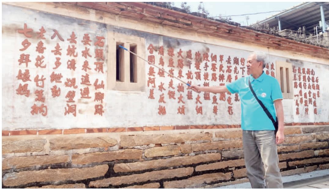
左、右：后湖打造「六壁七謠」，保存母語文化與鄉音記憶，期望成為社區亮點。