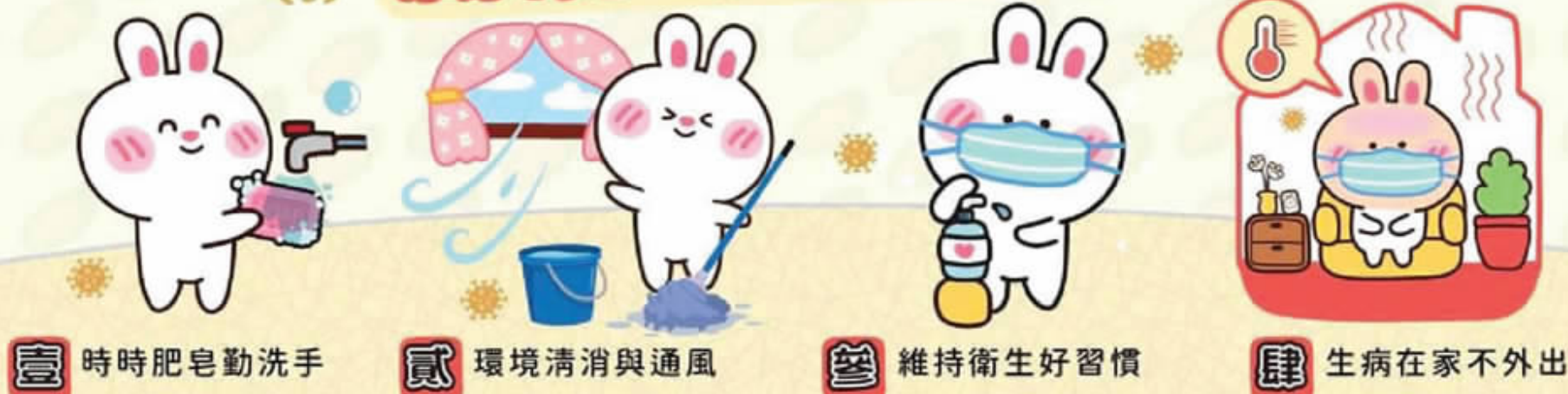
壹 時時肥皂勤洗手