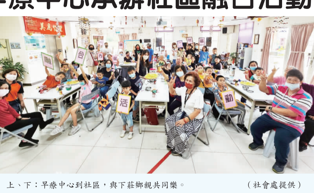
上、下：早療中心到社區，與下莊鄉親共同樂。

記者李增注／綜合報導 金門縣政府社會處委託瑪利亞基金會承辦早期療育聯合服務中心，於5月11日舉辦13年度社區融合活動，「康乃馨Come & Smile」親子社區融合活動，借用下莊社區活動中心空間進行親子活動，希望讓社區民眾認識早療孩子，也便早療家庭接觸不同的社區特色及文化，活動共計11組家庭、34位早療服務對象及家庭成員及11位社區民眾參加。 每年農曆年後，家家戶戶常有許多的年糕未食用完，鄉親秉持著惜福惜食的態度，把深藏冷凍庫的年糕，做成了大人小孩都愛的新風味——起酥。 記者李增注表示，其實最理想的療育方式，就是在社區裡就能做早療，日常的活動就是最好的練習，繩毛線或使用叉子、刷子等工具，可以增加精細動作經驗，認識毛線、顏色、年糕、起酥片，則是能提升認知能力；以家庭為中心、社區為基礎，是一個努力的方向，讓社區居民和早療的家庭、孩子們互相了解，才能消弭歧視，達成真正的共融才是最終目標。 縣府社會處表示，感謝下莊社區無償提供活動中心空間，和鄉親們熱情的共襄盛舉，讓參與的家庭能完成手作活動，使活動如期舉行及順利圓滿達成。如果想更進一步的了解兒童發展、教養、早療服務內容，歡迎追蹤「金門縣早期療育聯合服務中心」FB粉絲專頁。