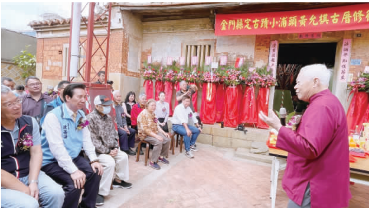
左、金門縣定古蹟小浦頭黃允棋古厝修復工程昨動土典禮，縣長陳福海偕與會嘉賓及所有權人代表完成三持鏟動土及傳統動土儀式；右、陳福海專注聆聽小浦頭鄉親代表黃能水述說祖先「見病救、知恩報恩」的故事。

金門縣政府定古蹟小浦頭黃允棋古厝修復工程昨動土典禮，縣長陳福海偕與會嘉賓及所有權人代表完成三持鏟動土及傳統動土儀式。黃允棋古厝有感人的故事以及六路大厝之格局，在建築用材上也相當有代表性，相當有價值。以後浦頭黃允棋古厝未來修復工程完工後能有良好的活化運用，以發揮古厝更大的價值。