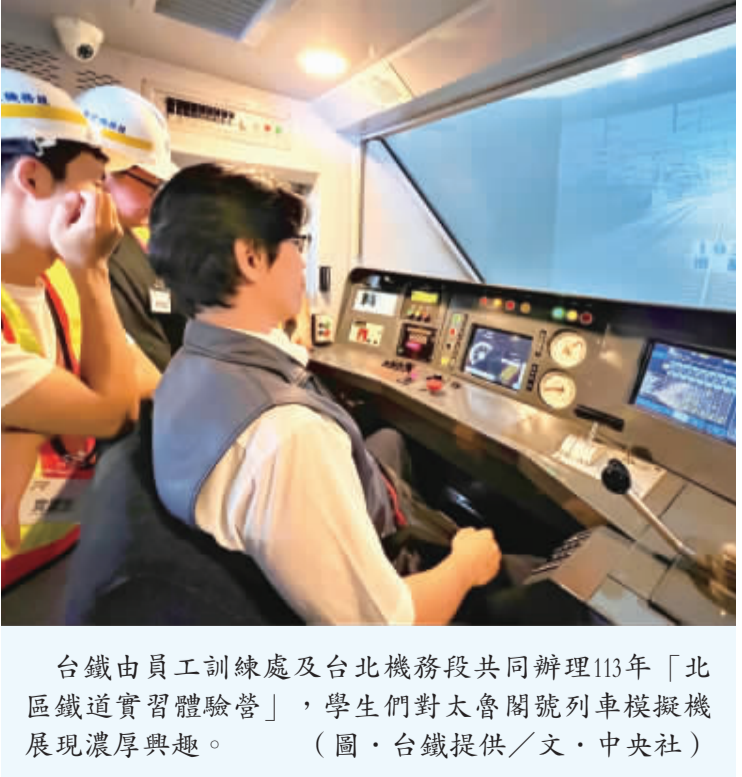
台鐵由員工訓練處及台北機務段共同辦理113年「北區鐵道實習體驗營」，學生們對太魯閣號列車模擬機展現濃厚興趣。(圖、台鐵提供/文、中央社)

【中央社記者汪淑芬台北18日電】台鐵為招攬高教技術人才，日前舉辦實習體驗營，有8所大專院校、52名在職生報名，學生樂於動手實作，對太魯閣號列車模擬機更躍躍欲試。 台鐵今天發布新聞稿說，為招攬各大專院校高教技術人才，15日由員工訓練處及台北機務段，共同辦理113年「北區鐵道實習體驗營」。 台鐵指出，這次體驗營有國立台北科技大學、亞東科技大學、國立陽明交通大學、逢甲大學、正修科技大學、中華大學、暨南大學及致理科技大學等8所車輛工程及機電系統計52名在職生主動報名參加。 台鐵總經理馮輝昇向參加體驗營的學生提到，以「淨零碳排」的未來發展趨勢，導入鐵路運輸的未來挑戰與策略，及台鐵未來發展，並由他自身職涯經歷，勉勵學生，勇於嘗試、挑戰自我。 我，取得幸福人生的乘車票。馮輝昇也向學員遞出橄欖枝，保證台鐵是一個福利好、升遷與進修管道順暢的工作環境，對擁有專業技術的學生來說，絕對是一個很好的自我實現的工作場所，鼓勵未來新鮮人共同加入台鐵團隊。 台鐵這次舉辦的體驗營，主要介紹鐵路司機員與檢査員工作、車輛檢修作業與設備導覽、自動化設備實務，同時也讓學員親身體驗地下車床與洗車機、閘瓦安裝、鬆緊控制操作、列車自動防護系統(ATP)、轉盤操作、駕駛模擬器等。 台鐵指出，為讓學員能深入瞭解實務運作，台北機務段共派出講師、助教與領隊共13人，現場講解與操作，參加學員在實習過程中樂於動手實作，尤其對太魯閣EMU1000型模擬機，更是躍躍欲試。