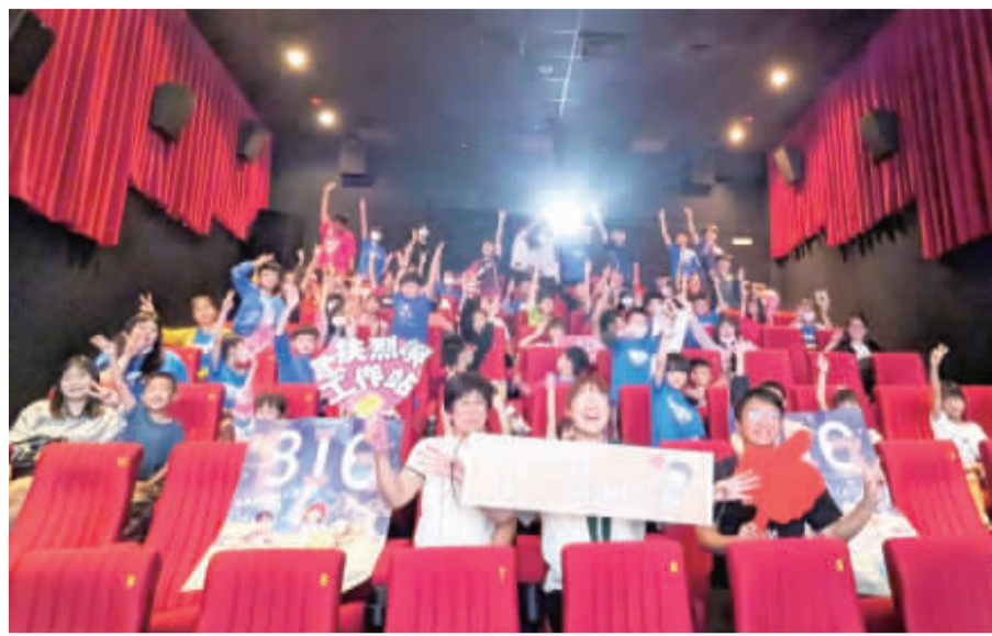
西口國小師生們受邀觀賞電影《BIG》公益包場活動。