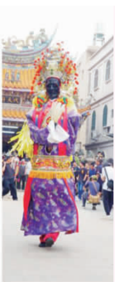
左上、人力蜈蚣座。右上、右中、左下、多個陣頭共襄盛舉。左中、繞境慶賀團，從北鎮廟出發。右下、扯鈴隊表演。