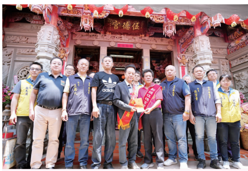
議會昨日前往新頭伍德宮上香祈福。

金門縣自來水廠委由金門縣政府辦理「金城鎮第六標污水下水道及用戶接管工程自來水管線汰換及電力管線預埋工程」，預計從五月二十日起至二十四日期間，實施間歇性停水作業。自來水廠提醒受影響區域的民眾，還請提前儲水備用。 自來水廠表示，金城鎮第六標污水下水道及用戶接管工程暨自來水管線汰換及電力管線預埋工程，預計將進行金城鎮東沙、東社等區域的用戶端改接施工，因此會在二十二至二十四日共五天的每天上午八時三十分至十時三十分，以及下午一時三十分至三時三十分等時段，每日上午各停水二小時實施間歇性停水，以利施工改接。 受停水影響的區域，分別會有：金城鎮東沙、東社、珠山（以上含駐軍及機關）等區域。水廠說明，部分地區（末端或高處）因管線需進行排泥排空作業，可能延遲復水，期間將會影響用戶用水，復水後自來水水壓、水質有不穩定之現象，若有任何問題，可以撥打免付費專線：800-002-117，水廠將會派員前往處理。