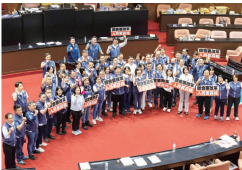
立法院會17日處理藍白所提國會改革相關法案，直至今夜，立法院長韓國瑜才宣布休息，後續將在21日繼續開會審查，國民黨團會後集會在場內高喊「國會要改革、人民要真相」口號。(中央社)

【中央社台北18日電】立法院17日處理藍白所提國會改革相關法案，直至今夜，立法院長韓國瑜才宣布休息，後續將在21日繼續開會審查，國民黨團會後集會在場內高喊「國會要改革、人民要真相」口號。 立法院17日處理藍白所提國會改革相關法案，直至今夜，立法院長韓國瑜才宣布休息，後續將在21日繼續開會審查，國民黨團會後集會在場內高喊「國會要改革、人民要真相」口號。