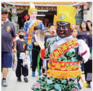
左中、繞境慶賀團，從北鎮廟出發。右下、扯鈴隊表演。