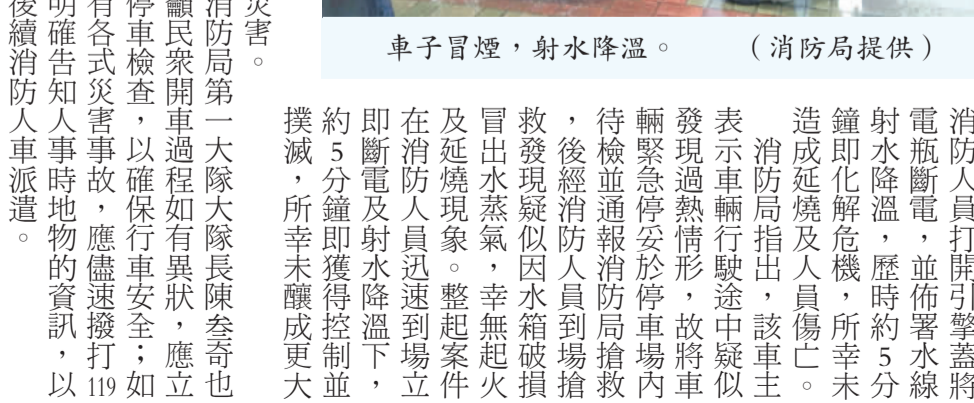
車子冒煙，射水降溫。

記者許峻魁／金城報導 金門天震堂、金門國際商會、鶯歌商會邀請台灣培德體育會來金門交流，正巧碰上一度一度的宗教盛事「迎城隍」，於昨日晚間七時三十分，在北鎮廟進行一場醒獅高樁表演，民眾超級捧場，現場人山人海，為了一睹醒獅團的精湛技巧。 金門天震堂表示，「獅王爭霸賽」已經約六年多的時間停辦了，過去每支隊伍如空中飛人般的神技還讓人記憶猶新，此次台灣培德體育會也曾經受邀參賽，他們常年的練習，許多高難度的高樁動作都難不倒他們，精彩的表演也讓觀眾者感受到舞獅生力。 昨日的演出，現場民眾的驚呼聲不斷，更有許多鄉親讚嘆表演者的好臂力、超強的腰力，直呼平日苦功一定沒有少。