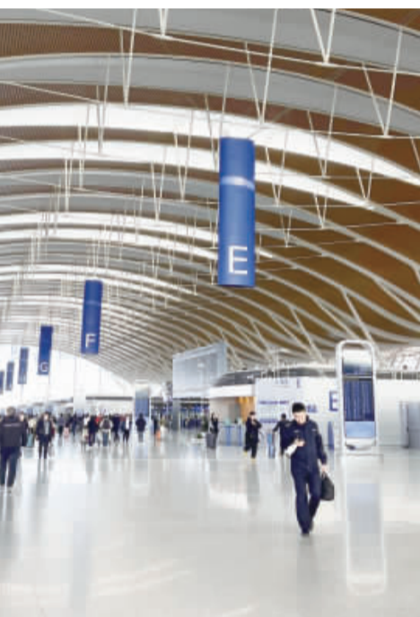
行政院主計總處統計資料顯示，國人赴中國(含港澳)工作人數連續8年遞減。圖為上海浦東機場大廳。(中央社)

【中央社記者李雅雯台北18日電】行政院主計總處統計資料顯示，國人赴中國(含港澳)工作人數連續8年遞減，2014年至2021年期間連年下滑；受到COVID-19疫情衝擊影響，赴中國工作人數占海外工作總人數僅剩37.5%。 主計總處最新統計資料顯示，民衆赴中國工作人數連續8年遞減，2013年達43萬人，2014年起減為42.7萬人，COVID-19(2019冠狀病毒疾病)疫情大爆發前一年，2019年為39.5萬人。受到疫情衝擊，2020年、2021年、2022年赴中國工作人數相繼創下新低。主計總處最新統計截至2022年，這年赴中國工作人數為17.1萬人，相較10年前、2012年(43萬人)驟減25.9萬人。 觀察赴中國工作人數於赴海外工作總人數占比，有統計資料以來，2009至2013年期間，赴中國工作人數占比年年突破6成，2011年一度高達62.2%。2014年起逐漸下降，疫情大爆發前一年，2019年為53.4%，疫情期間，2022年僅剩37.5%。 前任東南亞國家工作人數則呈成長趨勢，2013年達109萬人，有統計資料以來，第一次突破100萬人；2014年增加為113萬人。赴東南亞國家工作人數在2019年達12萬人，較10年前、2009年增加43萬人。 台灣大學國家發展研究所兼任副教授辛炳隆對中央社分析，民衆赴海外就業大多跟隨著台商腳步走，台商的海外布局改變，中國不再是台商投資第一優先考慮地方，台商轉赴其他地區設廠，台灣幹部當然也是跟著轉赴他地。辛炳隆指出，中國外資政策在改變，在中國的經商成本也愈來愈高，美中貿易戰、美科技戰加速台商改變布局，加上新南向政策推動，海外就業情勢也有了明顯變化，可以看到赴中國工作人數遞減、赴東南亞國家工作人數漸增趨勢。 辛炳隆提到，除了台籍幹部跟著台商赴中國工作外，另一部分前往中國工作的台灣群體為年輕一代。有的台灣年輕人在中國就學畢業後，直接留在當地就業；有的則是自行選擇前往。 「中國對於台灣年輕人就業吸引力確實在下滑」，辛炳隆說，一方面為台灣年輕人對岸職場現況沒有特別優勢，另一方面為中國經濟環境現況不是很好，三方面為台灣年輕人對於極權政治環境較難接受，沒有辦法一賺錢歸賺錢。 文化大學國家發展與中國大陸研究所兼任教授陳松興對中央社指出，台商採取China Plus One策略，回應供應鏈上游要求，減少在中國投資，這些新廠多是轉移到東南亞國家設置。 陳松興表示，新廠設址東南亞國家，減少在中國的產能，相對地對於駐點中國的工作人員需求也降低，台籍幹部、台籍勞工前往中國工作誘因不再，於是呈現出赴中國、赴東南亞國家工作人數消長趨勢。 一名要求匿名受訪的38歲民衆表示，COVID-19疫情拿到一個在香港的工作，考慮香港國安法通過後，當地生活氛圍改變，於是放棄了這個機會。香港薪資較台灣薪資多2至3倍，不過一時時不自由，恐懼感讓人壓抑，不後悔取消赴港工作決定。 這名民衆說，其現所任職公司主管為香港籍人士，學業搬遷到台灣生活、工作，很大原因是為了孩子的教育，他們不願意孩子接觸中共引領下的「愛國教育」；另也有些香港籍友人欲離開香港，有的已經轉赴英國、加拿大展開新生活。 一名畢業於政治大學轉赴上海工作的民衆受訪指出，畢業後先在台灣工作一陣子，考慮中國市場大、職缺多，於是選擇落腳上海。上海薪資優於台灣的薪資，不過物價成本、工作壓力也高了不少；對於兩岸局勢感到緊張，希望和平穩定。