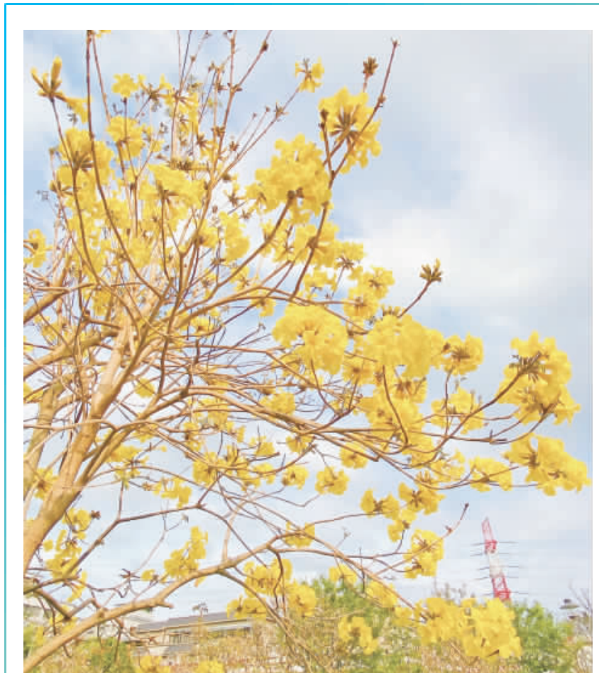
花語是「感謝」和「再回來的幸福」的黃金風鈴木。

村落南面隆起的地方就是大文山，與太武山遙相呼應，據文獻及前輩文章記載：「太武山在雙蓮山南，與太武對峙，海上望之，如玉柱雙擎。」又說：「太武山海拔79米，為西半島的最高點，與太武山在金門島東西相對。」山上的祖師殿主殿，奉祀著清水祖師，和村裡鄉親信仰的幾位王爺，後殿的朱子祠，則是朱文公、文昌帝君跟魁星爺，祖師殿同時與太武山海印寺、田浦城隍廟、金城南門香蓮廟、庵前恩主公廟，合稱金門五大名廟。