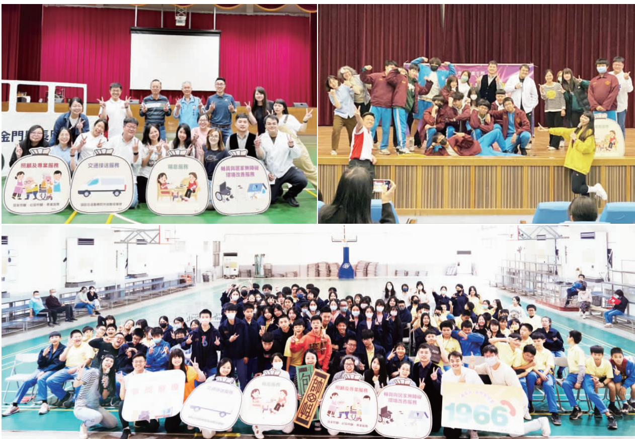
金門縣衛生局「閃閃長照劇團」巡迴全縣五所國中演出宣導長照服務。

記者楊水球／金湖報導 自政府實施長照2.0政策擴大長期照顧服務項目，並推動長照服務專線(24小時)及長照服務4包錢(包含照顧、專業服務、交通接送服務、喘息服務、輔具及居家無障礙環境改善服務)等，而且為讓地區民眾及青年學子更清楚長照服務4包錢、如何運用、如何申請，金門縣衛生局成立「閃閃長照劇團」巡迴全縣五所國中演出，期盼藉由劇團巡迴校園演出方式，認識長期照顧服務之福利及管道。 「閃閃長照劇團」係由衛生局十三位同仁組成，自去年十月首發巡迴公演場次於金寧國中與金沙國中演出，今年陸續於金寧國中、金湖國中與烈嶼國中巡迴。劇情為失智症阿嬤與照顧者心負荷的兒女之生活實境，在里長、志工隊長及接受長照人員服務下減輕照顧壓力與生活環境的五場情節，宣導長照服務及長照服務專線1966。 衛生局表示，「閃閃長照劇團」為金門地區以話劇演出的長照服務宣導，希望民眾了解「長照服務專線」及長照服務4包錢申請管道，幫助自己與家人。在巡迴校園期間，各校師生專注的看著每個情節，於有獎徵答期間的熱絡互動，在三分鐘的演出，戲劇將長照服務潛移默化在師生的腦海中，讓參與的學生與教師們認識長照2.0政策是劇團成立及巡迴校園的最大目的。 衛生局說明，長照服務4包錢是指第一包：「照顧及專業服務」，照顧服務包含居家服務、日間照顧、家庭