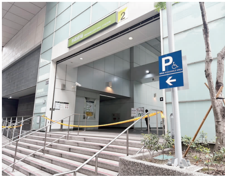
台中捷運綠線21日上午在列車上發生持刀隨機攻擊事件，市政府站事發後暫停營運，現場並拉起封鎖線。

【中央社記者趙麗娟、郝雪卿台中二十一日電】台中捷運車廂今天發生砍人事件，男子進車廂後，先放行李、上廁所才搭車，在車廂拔刀砍人，事發時中捷接獲2次通報，列車在下一站停駛，乘客慌亂逃出車廂，結束2分鐘驚魂。