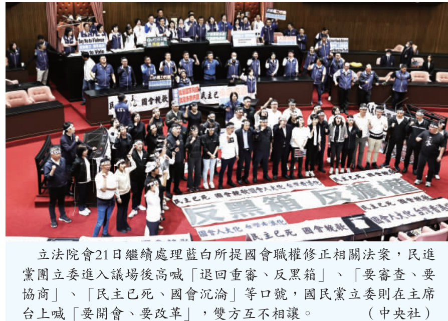
立法院會21日繼續處理藍白所提國會職權修正相關法案，民進黨團立委進入議場後高喊「退回重審、反黑箱」、「要審查、要協商」、「民主已死、國會沉淪」等口號，國民黨立委則在主席台上喊「要開會、要改革」，雙方互不相讓。(中央社)