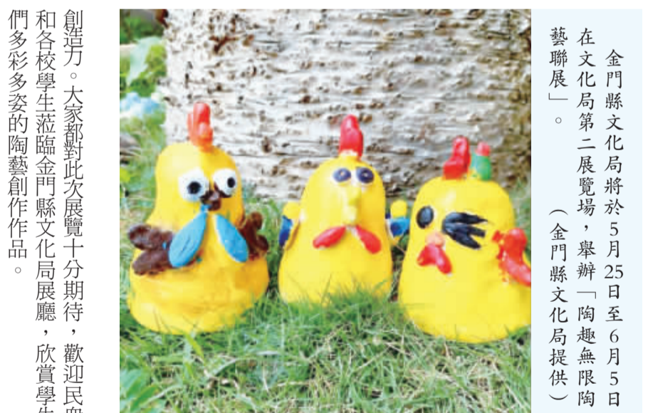
金門縣文化局將於5月25日至6月5日，在文化局第二展覽場，舉辦「陶趣無限陶藝聯展」。

金門縣文化局將於5月25日至6月5日，在文化局第二展覽場舉辦「陶趣無限陶藝聯展」，5月25日上午十時將舉行開幕式，歡迎喜愛陶藝的鄉親蒞臨欣賞，展期長達12天。