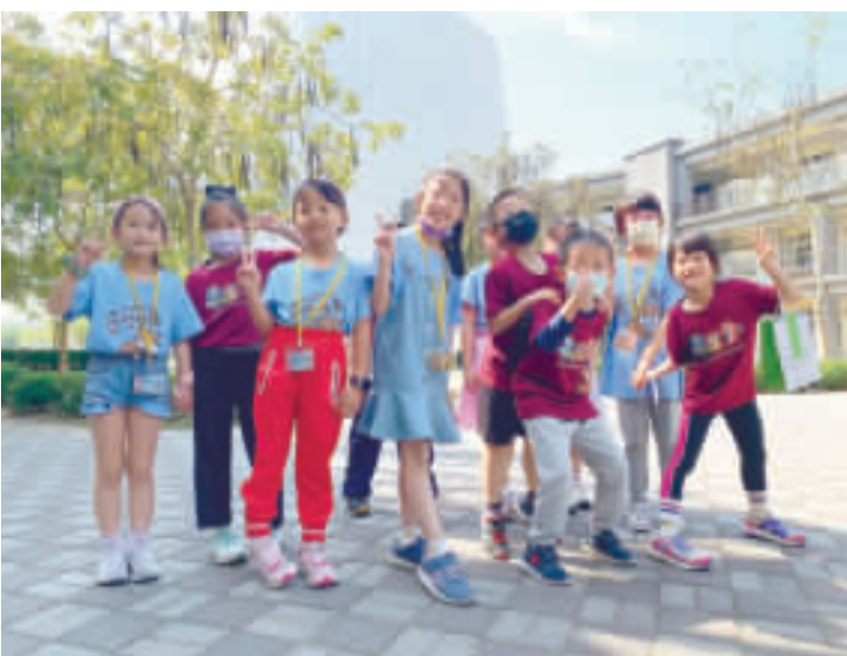
金湖國小204班與中正國小206班，兩校學生結交筆友，日前安排初次見面活動。

記者陳麗好／金湖報導 金湖國小204班與中正國小206班共同舉辦以閱讀為核心，結合國語和生活之課程《訪友手作藝啟玩》，學子在班導師協助下結交筆友，經由書信往來，日前安排初次見面活動，透過繪本閱讀、藝術手作等，感受延伸自國語課本《春天的顏色》的學習感受，彼此從陌生到熟稔最後依依不捨。孩 記者陳麗好／金湖報導 金湖國小204班與中正國小206班共同舉辦以閱讀為核心，結合國語和生活之課程《訪友手作藝啟玩》，學子在班導師協助下結交筆友，經由書信往來，日前安排初次見面活動，透過繪本閱讀、藝術手作等，感受延伸自國語課本《春天的顏色》的學習感受，彼此從陌生到熟稔最後依依不捨。孩