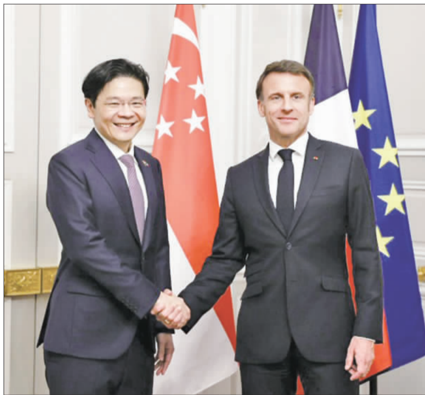
左、新加坡副總理兼財政部長黃循財(左)與法國總統馬克宏(右)留影。右、黃循財從基層公務人員一路成為新加坡總理。

【整理撰稿：新加坡】72歲的李顯龍(Lee Hsien Loong)於5月15日卸任新加坡總理，將領導職位交給年僅51歲的黃循財(Lawrence Wong)。新加坡的「李氏王朝」也正式落幕。觀察家分析，美中競爭加劇及人民行動黨的精英化可能成為黃循財的執政隱憂，他未來將如何應對一系列挑戰，有待觀察。