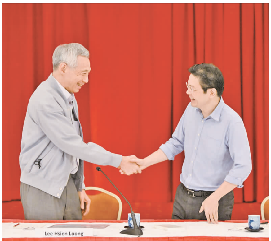
李顯龍閣下(左)與黃循財閣下(右)。

【整理撰稿：僑訊小組】新加坡總理李顯龍5月15日正式卸任，將領導職位交給第四代總理黃循財。在他20年的執政期間，經濟表現卓越，並在外交上努力維持與美中兩國間的平衡。然而，他堅持人民行動黨的長期精英統治，強烈壓制反對聲音，這一點受到了批評。