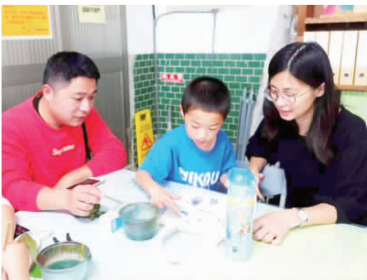
左、西口國小師生與家長們合影留念；右、西口國小及附幼舉行慶祝母親節系列活動，讓親子感受溫馨氣氛。

西口國小及附幼在5月母親節月份，舉辦一系列豐富多彩的活動，包括親子戶外手作與野趣活動、家扶繪本與花束活動、海角之西聯合音樂會、寵愛媽咪健康講座、親子心靈成長活動、主題書展佳句摘要及合影等活動，不僅豐富校園生活，也讓親子感受溫馨氣氛。