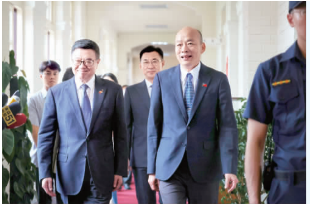
新任行政院長卓榮泰(前左)20日就任，22日中午到立法院拜會立法院長韓國瑜(前右)。

【中央社記者王承中台北22日電】行政院長卓榮泰今天前往立法院拜會立法院長韓國瑜。韓國瑜表示，近期立法院朝野政防較激烈，但3黨為了國家利益都是一致的。未來希望在第2會期能將政治性、衝突高的議題往後擱，跟行政院配合一起優先推動福利法案。