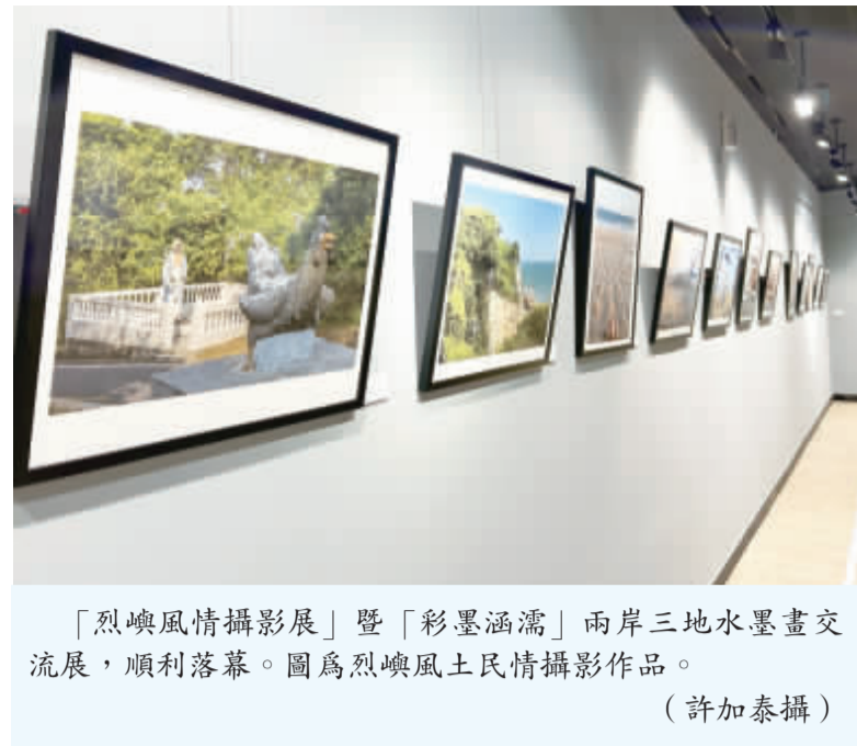
「烈嶼風情攝影展」暨「彩墨涵濡」兩岸三地水墨畫交流展，順利落幕。圖為烈嶼風土民情攝影作品。