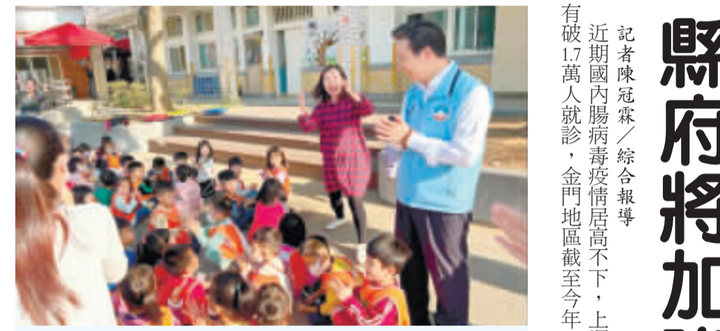
縣長陳福海提醒小朋友要注意日常衛生，勤洗手、勤消毒，預防腸病毒感染。